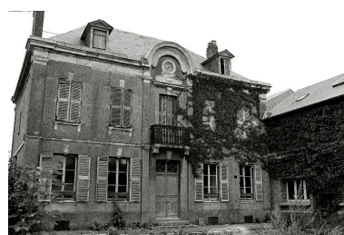
Vue générale, en 1990. IVR22_19908000842Z