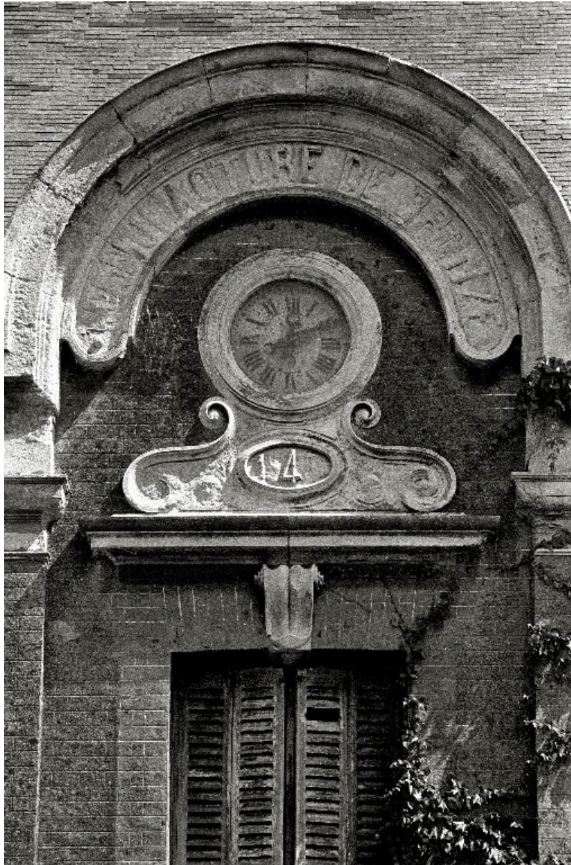
Vue du cartouche et de l'horloge, en 1990.