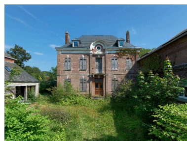
Vue générale. IVR22_20148000434NUC2A