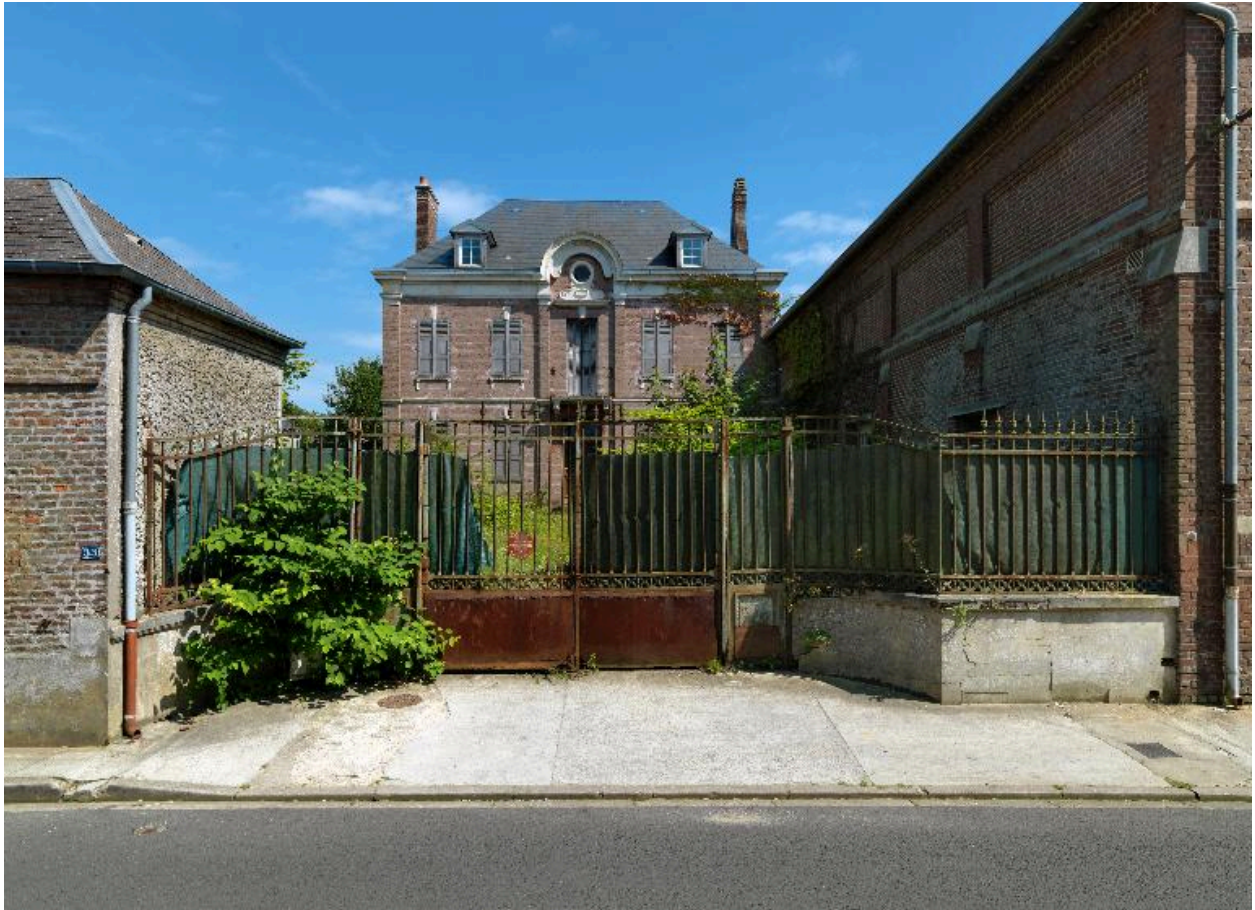
Vue depuis la rue Jean-Catelas de l'ancien logement patronal de M. Beauvisage.