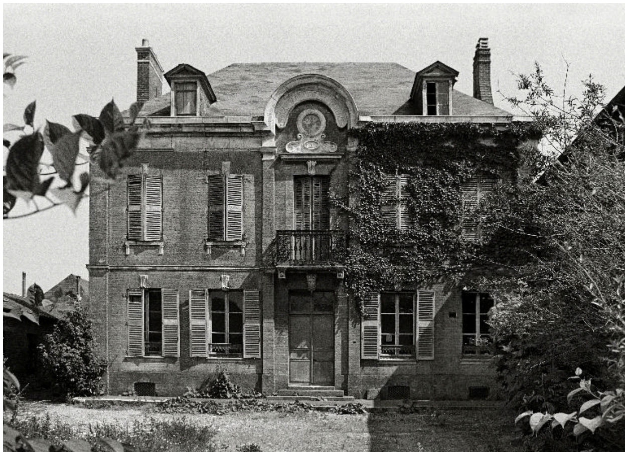
Vue générale, en 1990.