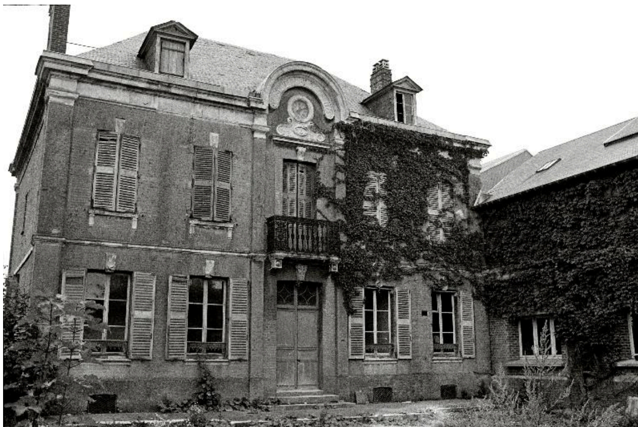
Vue générale, en 1990.