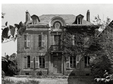
Vue générale, en 1990. IVR22_19908000436Z