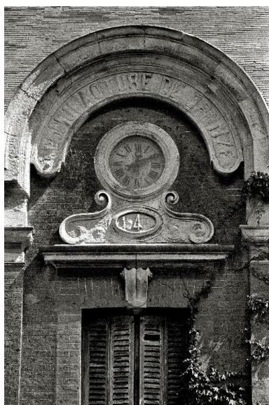
Vue du cartouche et de l'horloge, en 1990.