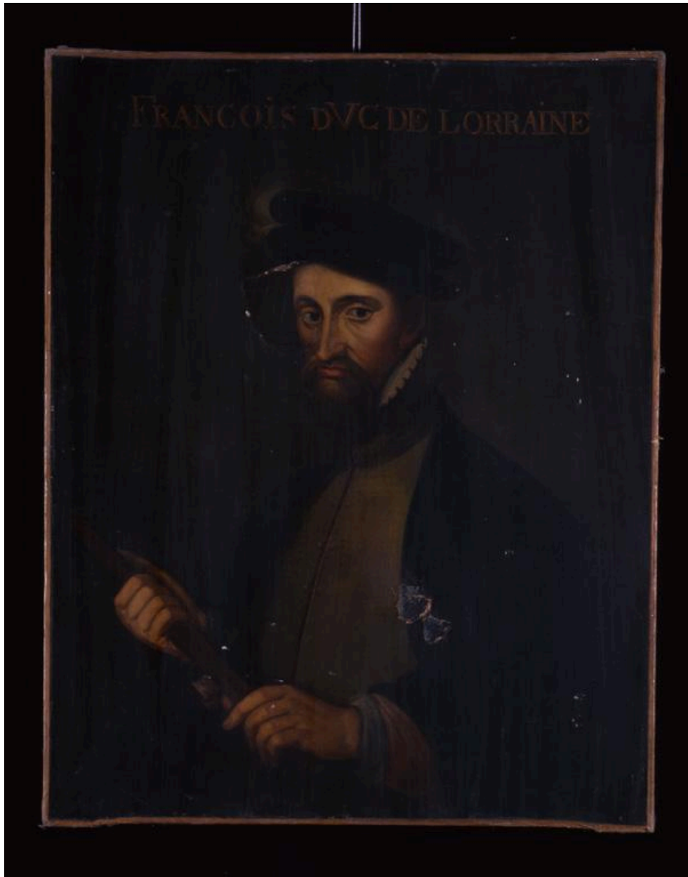
Vue du tableau représentant François, duc de Lorraine.