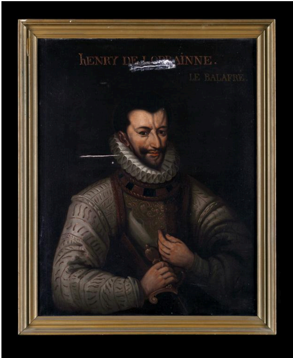
Vue du tableau représentant Henri 1er de Lorraine, duc de Guise.