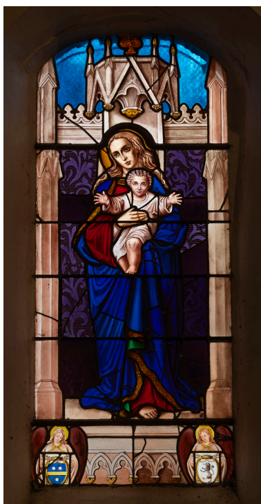
Verrière (baie 2) : Vierge, verre peint, second quart du XIXe siècle et 1925. IVR32_20246001315NUCA