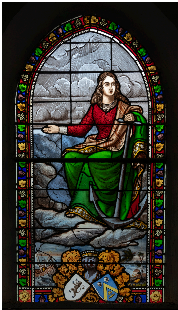
Verrière (baie 4) : sainte Philomène, verre peint, second quart du XIXe siècle et 1925.