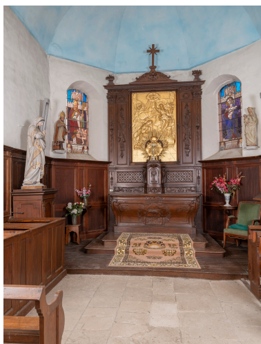
Vue générale du sanctuaire. IVR32_20246001307NUCA

IVR32_20246001325NUCA