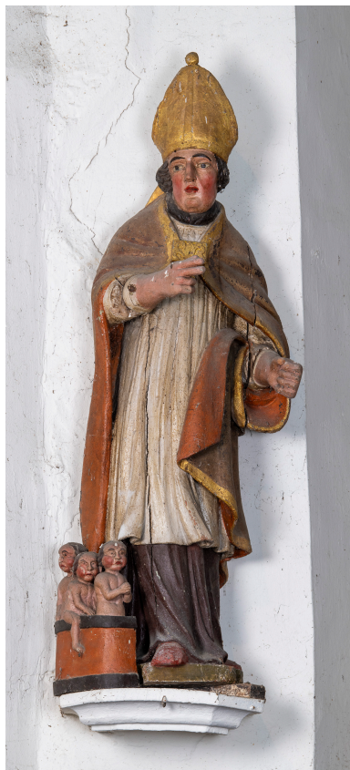
Statue : saint Nicolas, bois polychrome, XVIIIe siècle.