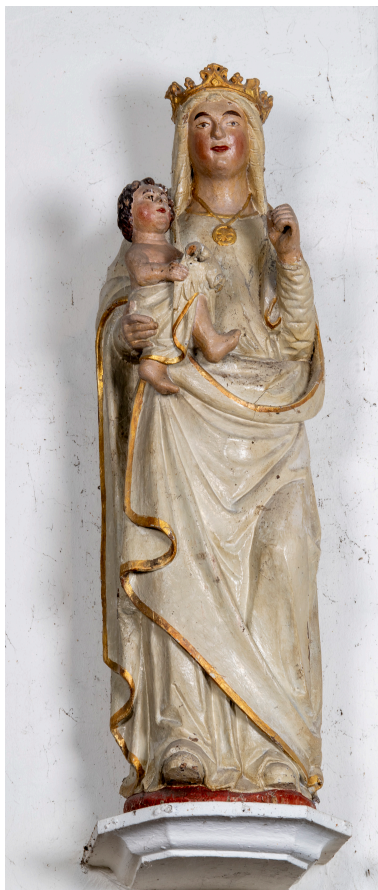
Statue : Vierge à l'Enfant, bois polychrome, XVIIIe siècle. IVR32_20246001312NUCA