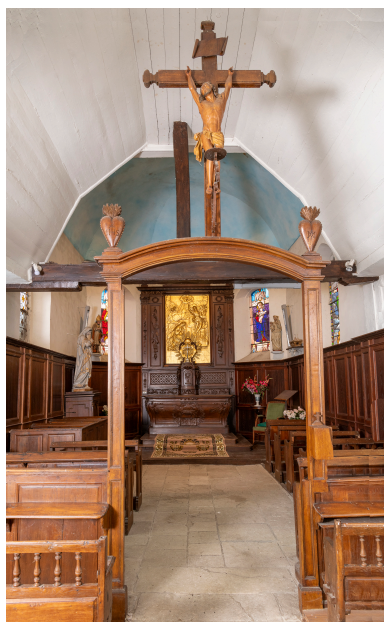
Poutre de gloire : Christ en croix et deux cœurs, bois, XVII e siècle (?).

IVR32_20246001325NUCA