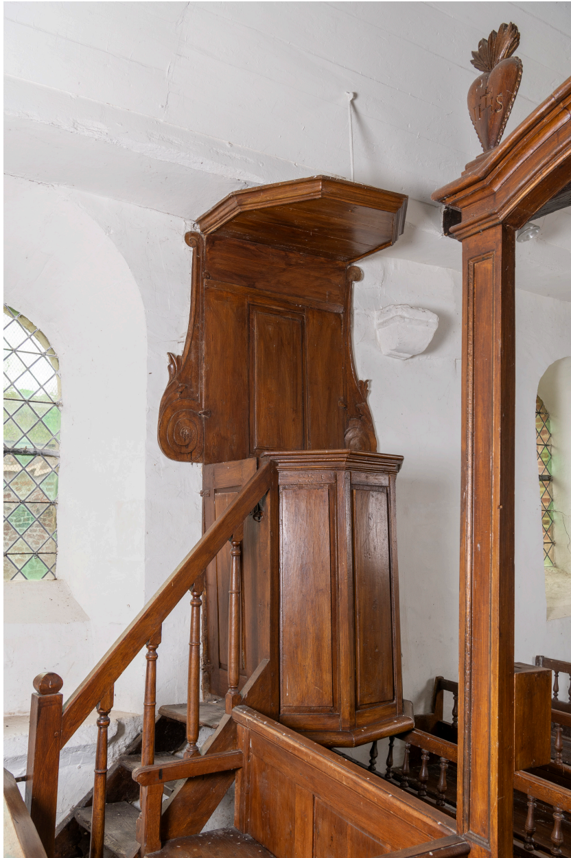
Chaire à prêcher, bois, XIXe siècle.