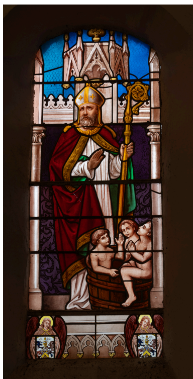
Verrière (baie 1) : saint Nicolas, verre peint, second quart du XIXe siècle et 1925. IVR32_20246001314NUCA