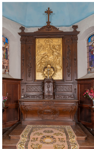
Vue générale de l'ensemble du maître-autel.