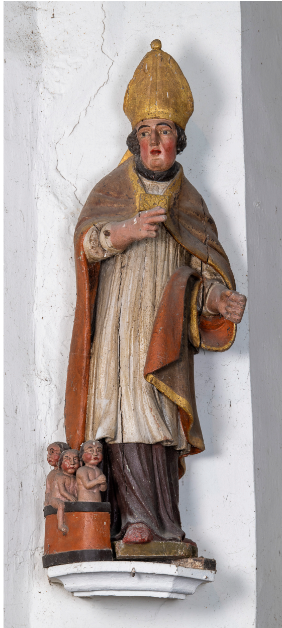
Statue : saint Nicolas, bois polychrome, XVIIIe siècle.