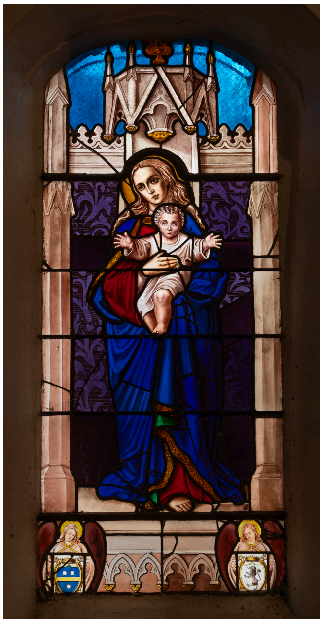
Verrière (baie 2) : Vierge, verre peint, second quart du XIXe siècle et 1925.