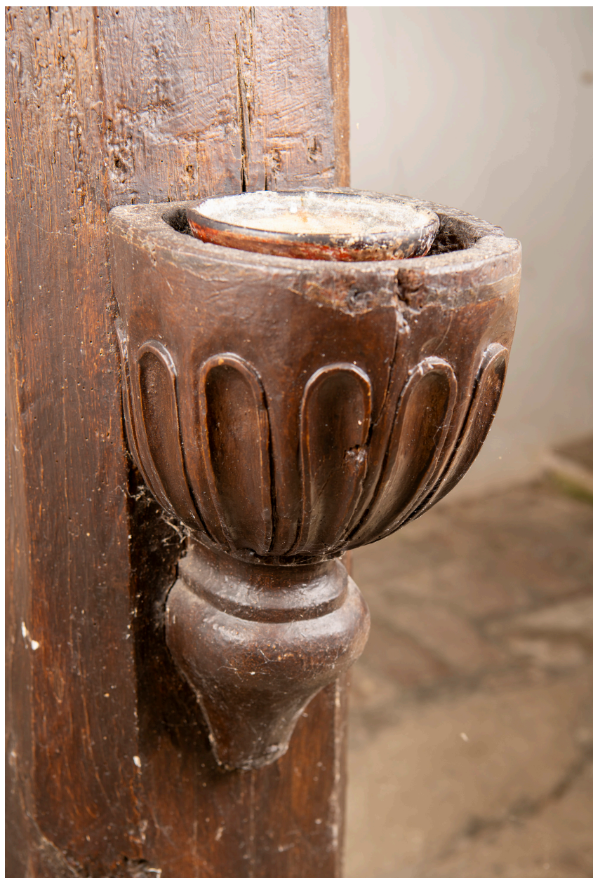
Bénitier, bois, XVIIe siècle (?).