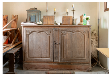
Chasublier, bois, limite des XVIIIe et XIXe siècles (?).