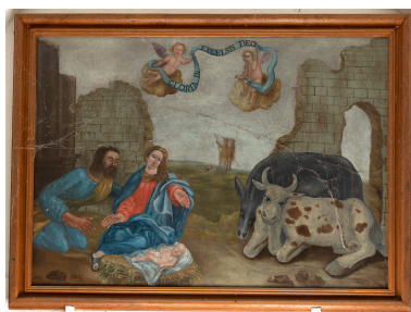
Tableau : Nativité, huile sur toile, XXe siècle. IVR32_20246001320NUCA