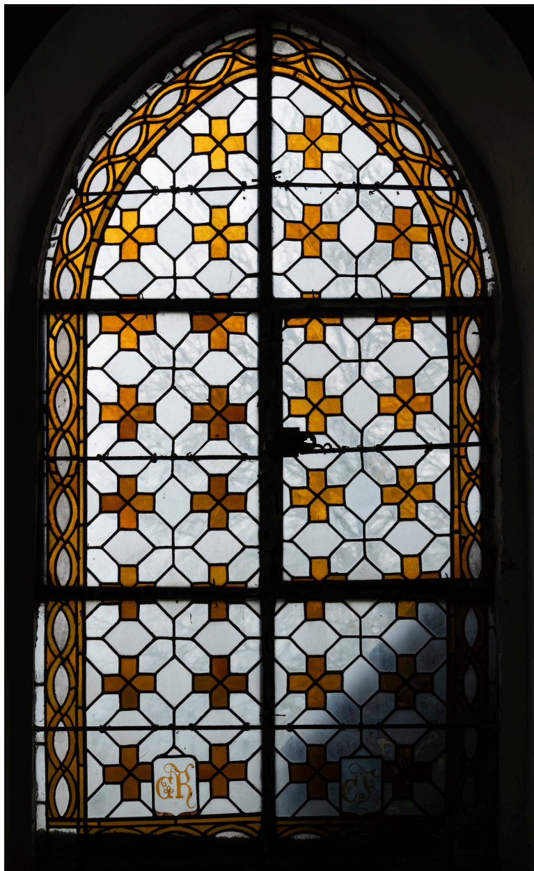
Verrière à bornes (baie 3), verre translucide et peint, second quart du XIXe siècle et 1925.