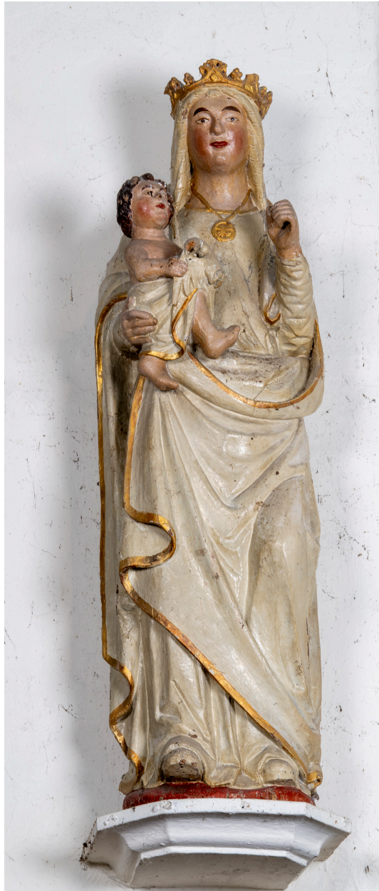
Statue : Vierge à l'Enfant, bois polychrome, XVIIIe siècle.