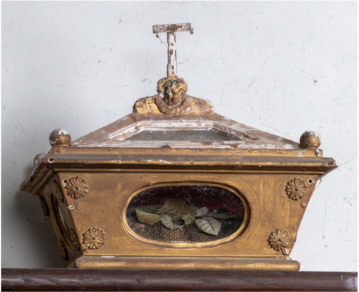
Châsse, bois doré, seconde moitié du XIXe siècle.