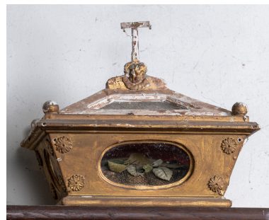
Châsse, bois doré, seconde moitié du XIXe siècle. IVR32_20246001313NUCA