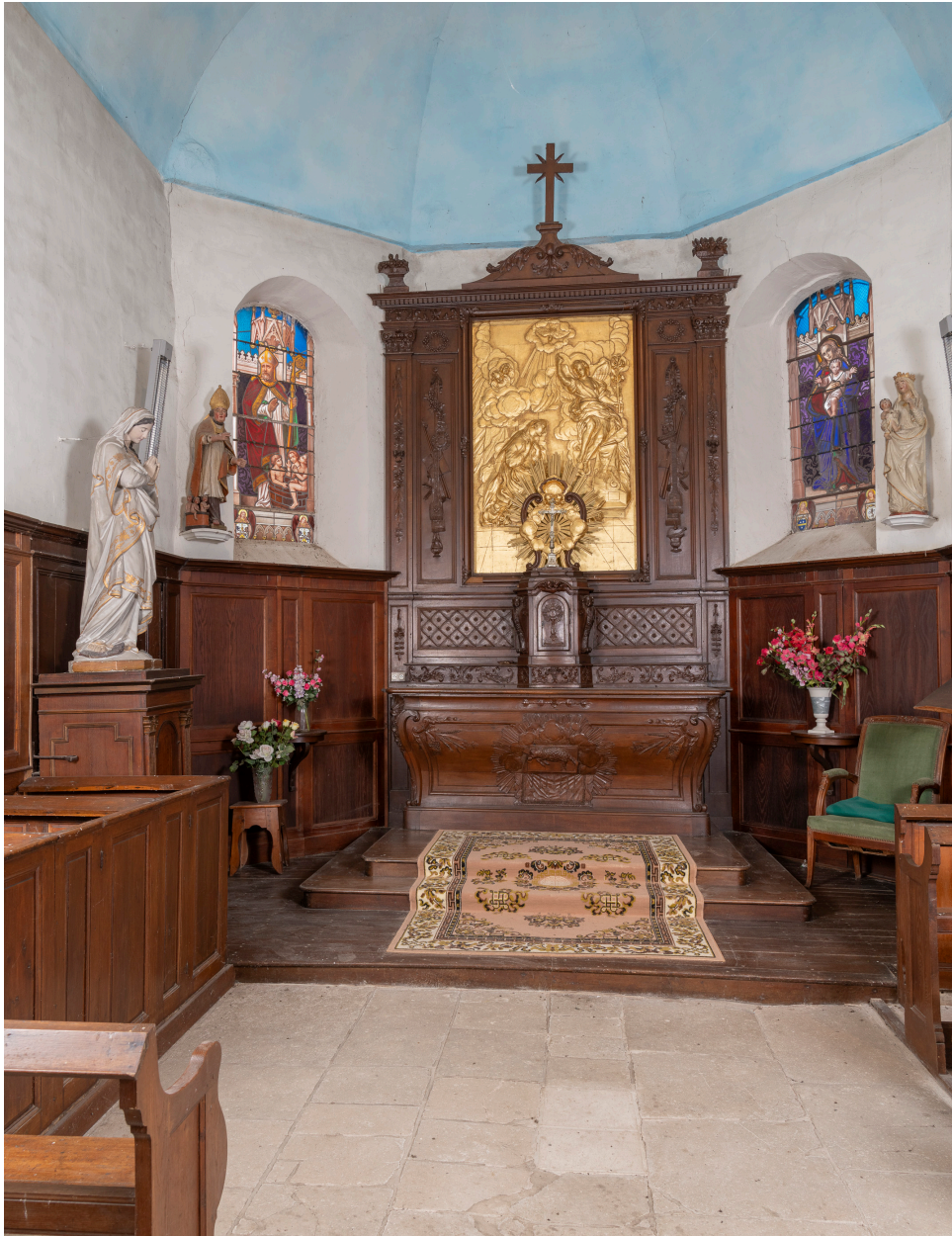
Vue générale du sanctuaire.