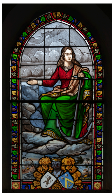
Verrière (baie 4) : sainte Philomène, verre peint, second quart du XIXe siècle et 1925. IVR32_20246001316NUCA