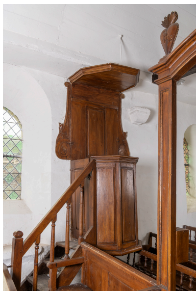
Chaire à prêcher, bois, XIXe siècle. IVR32_20246001319NUCA