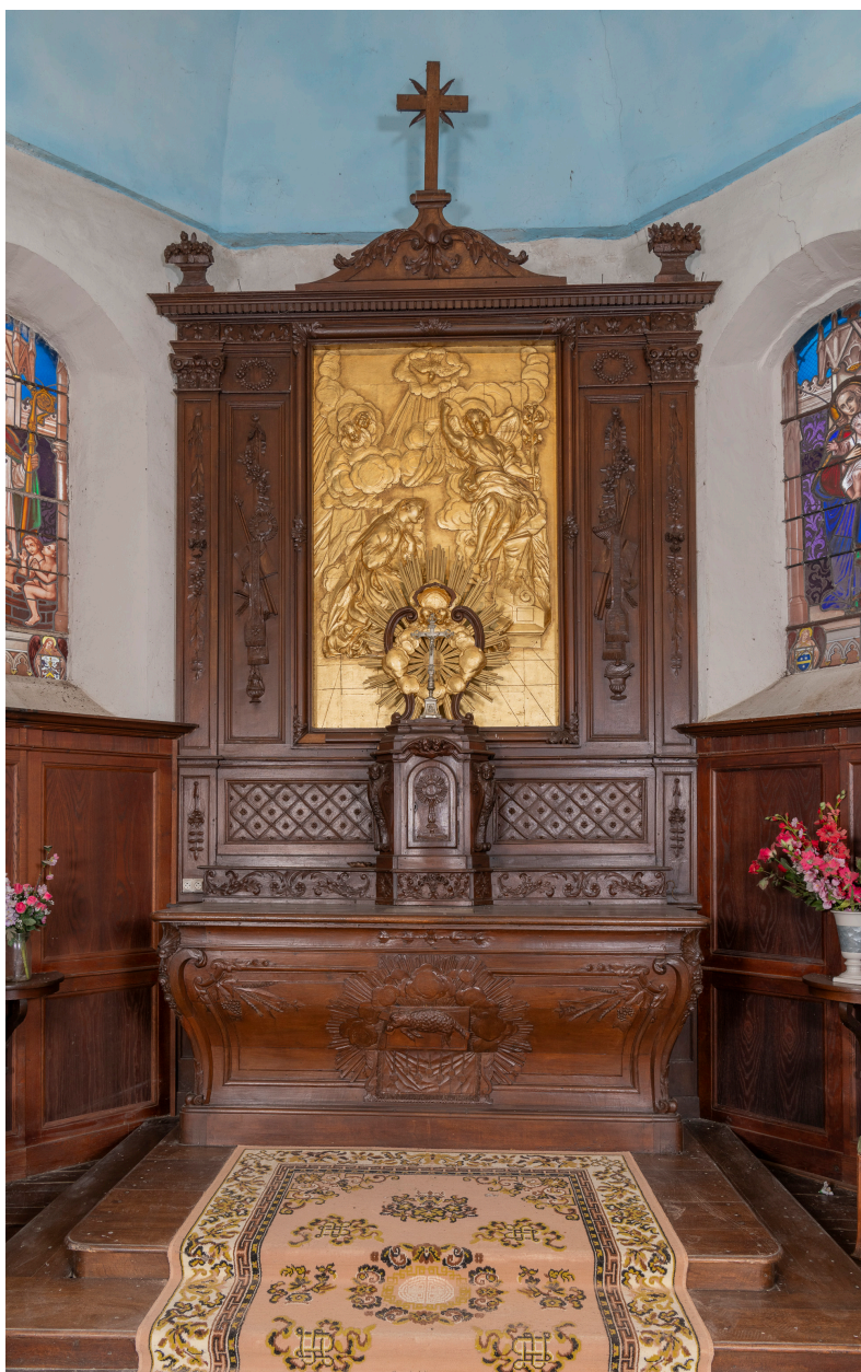
Vue générale de l'ensemble du maître-autel.