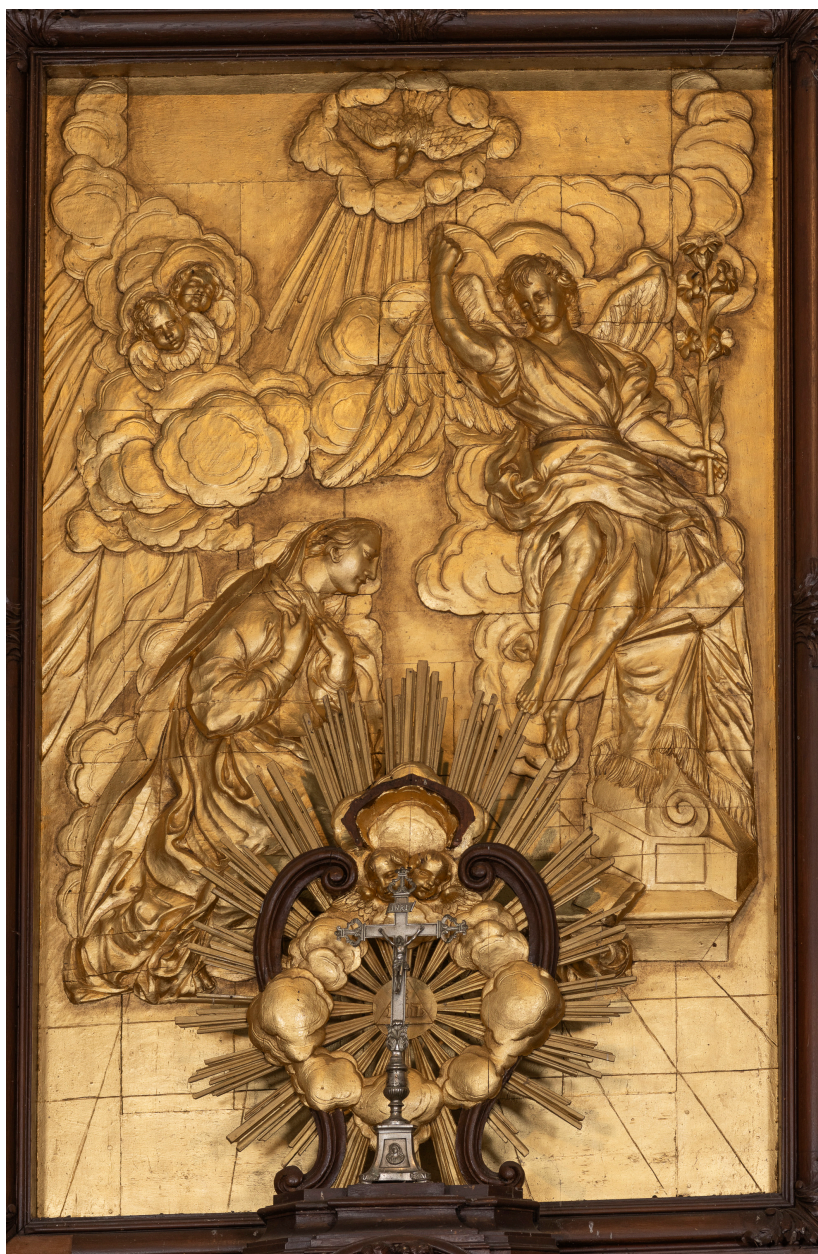
Tableau d'autel : L'Annonciation, bois doré, seconde moitié du XVIIIe siècle.