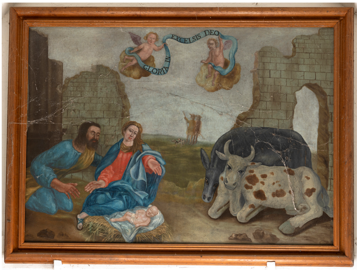
Tableau : Nativité, huile sur toile, XXe siècle.