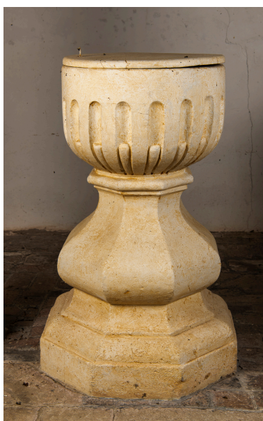
Fonts baptismaux, pierre, XVII e siècle (?).