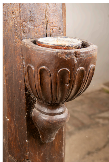
Bénitier, bois, XVII e siècle (?). IVR32_20246001322NUCA