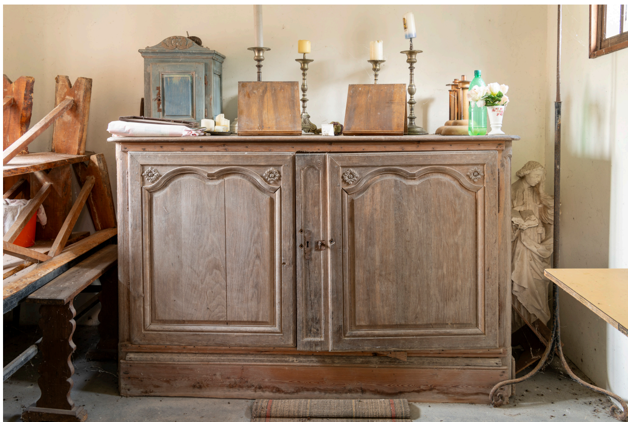
Chassublier, bois, limite des XVIIIe et XIXe siècles (?).