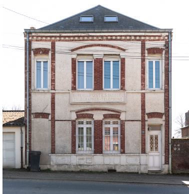
Ancien bureau de poste, n°12 de la rue de Montdidier, vue depuis le nord. IVR32_20256000077NUCA