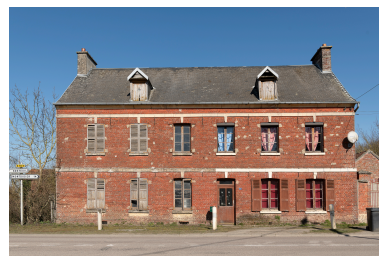
Ancienne laiterie, n°17 de la rue de Montdidier, vue depuis le sud.