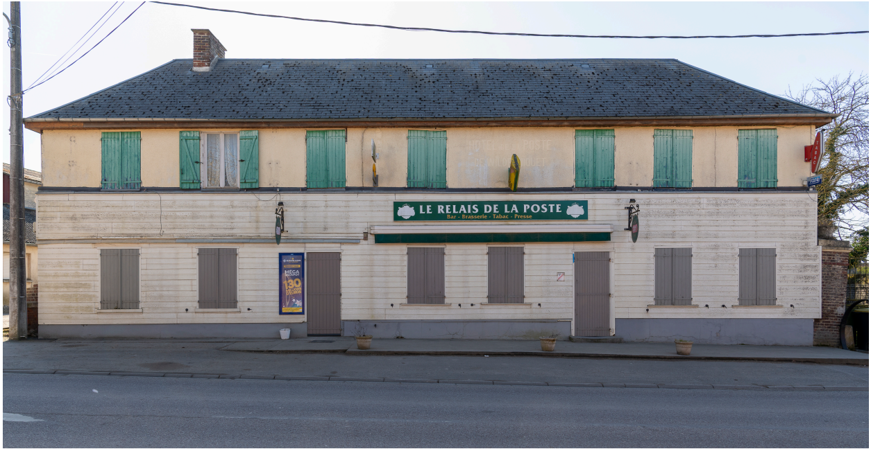
Ancien hôtel de la Poste, aujourd'hui bar-tabac, n° 18 de la rue de Montdidier, vue depuis le nord.