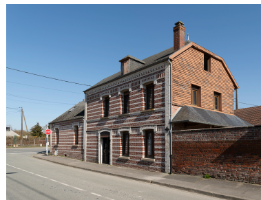
Logis, n°1 de la rue d'Amiens, vue depuis le sud-ouest. IVR32_20256000078NUCA