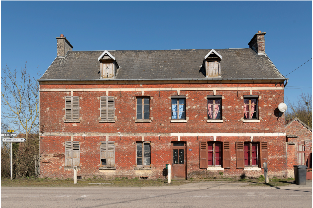
Ancienne laiterie, n°17 de la rue de Montdidier, vue depuis le sud.