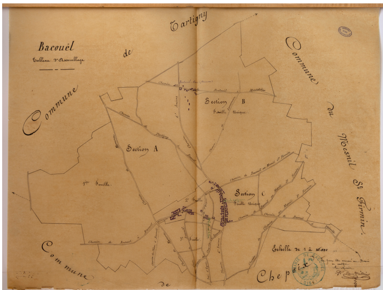
Bacouël. Copie du tableau d'assemblage du cadastre avec localisation des écoles [vers 1881].