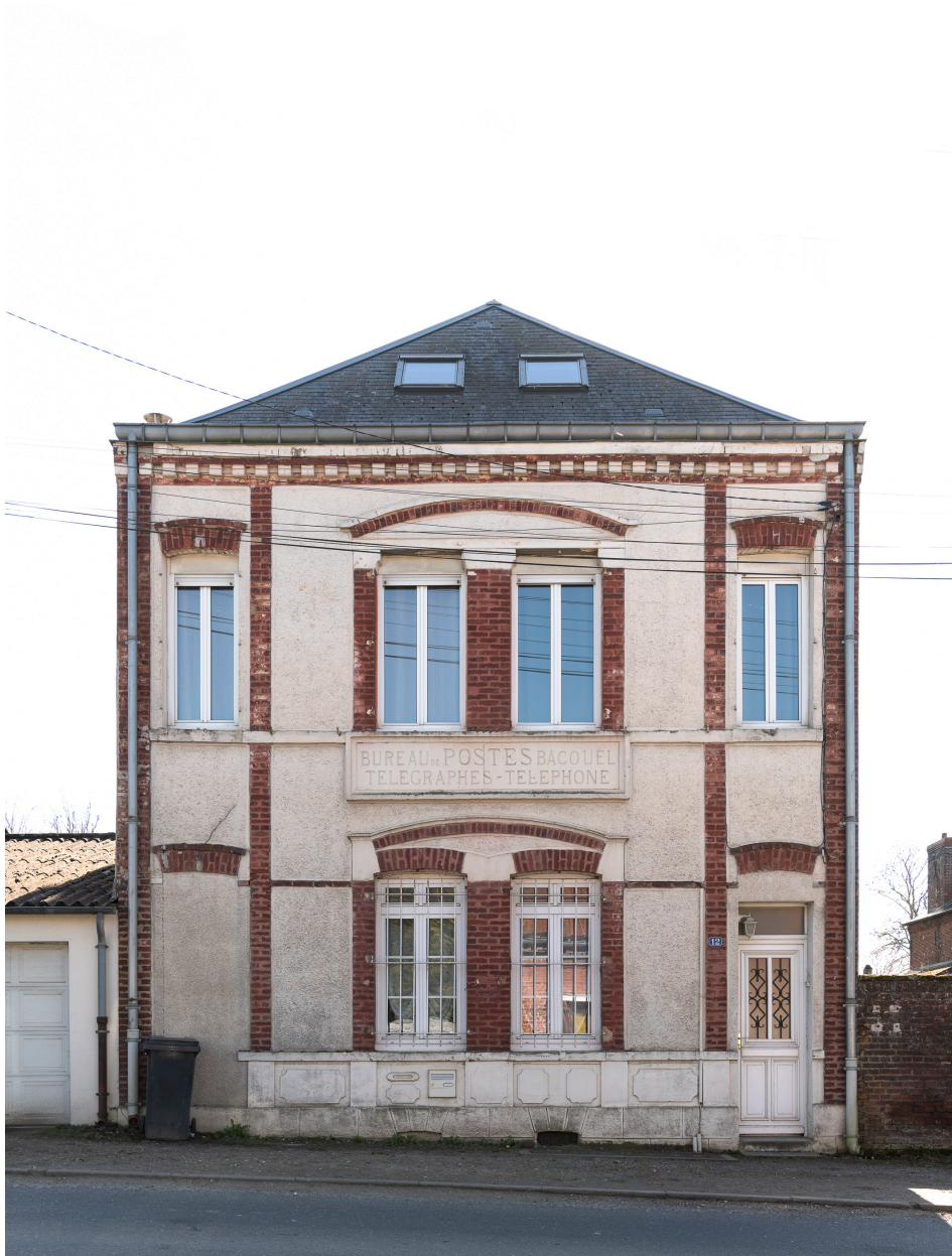
Ancien bureau de poste, n°12 de la rue de Montdidier, vue depuis le nord.