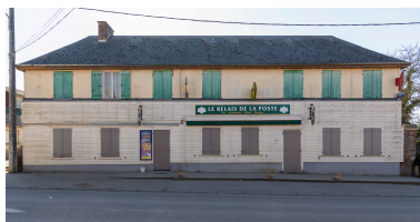
Ancien hôtel de la Poste, aujourd'hui bar-tabac, n°18 de la rue de Montdidier, vue depuis le nord.