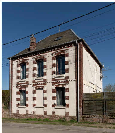
Ancien hôtel de la Gare Pottiez (?), n°30 de la rue de la Gare, vue depuis l'ouest. IVR32_20256000075NUCA