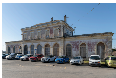
Gare de Breteuil-Embranchement, vue depuis le nord-est. IVR32_20256000061NUCA