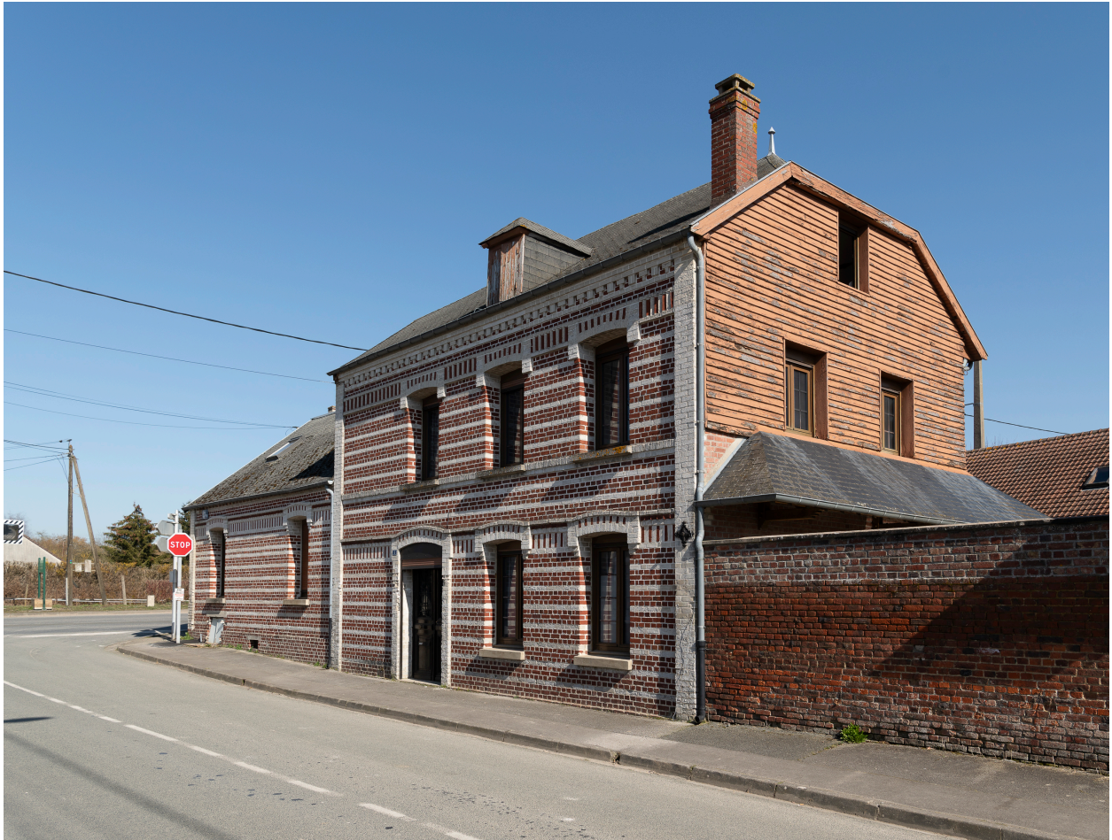
Logis, n°1 de la rue d'Amiens, vue depuis le sud-ouest.