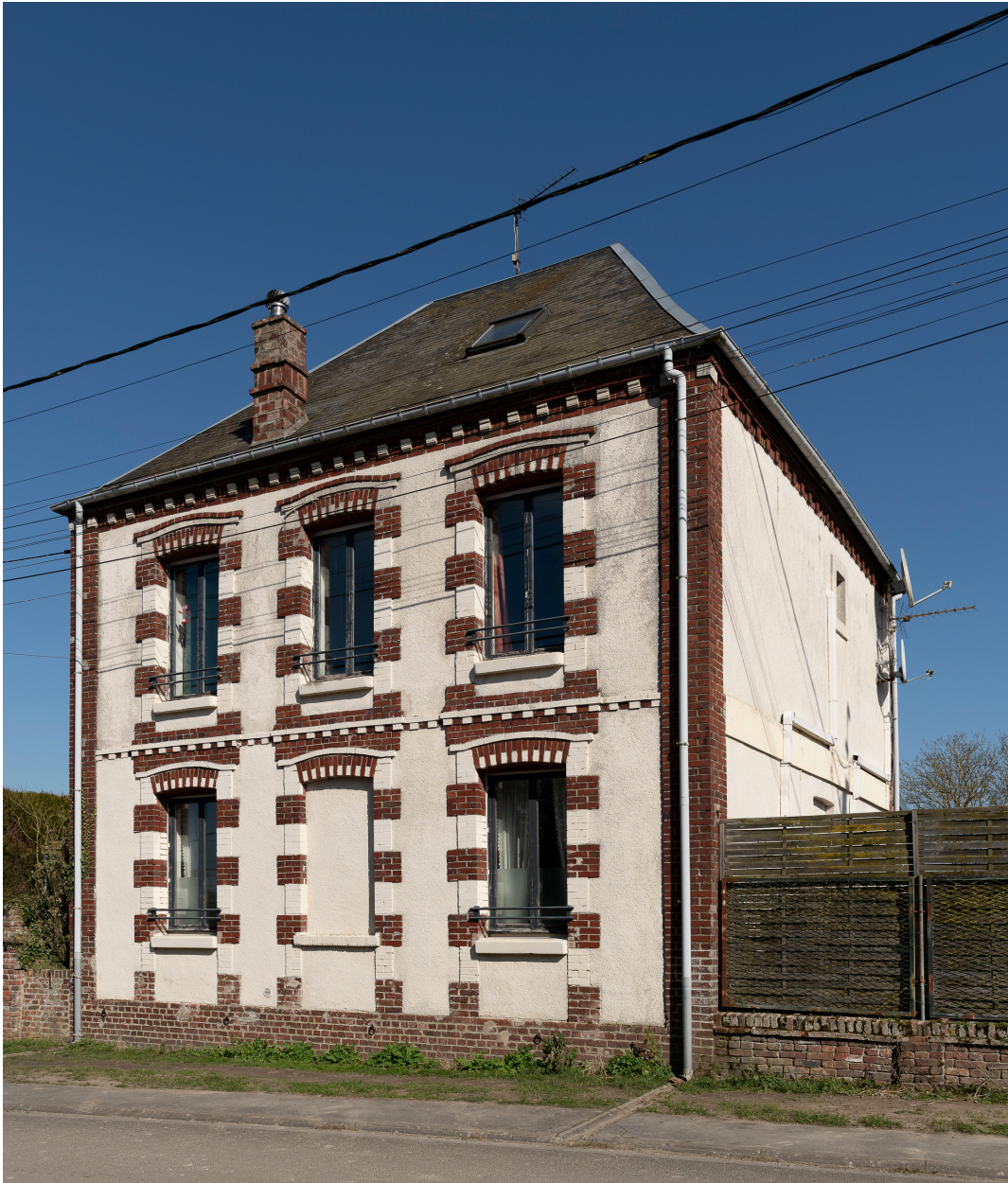
Ancien hôtel de la Gare Pottiez (?), n°30 de la rue de la Gare, vue depuis l'ouest.