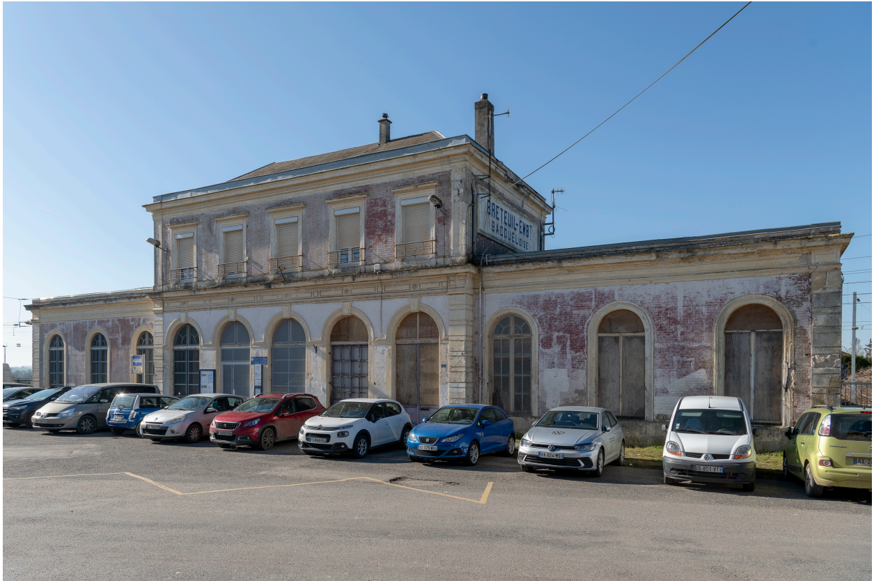
Gare de Breteuil-Embranchement, vue depuis le nord-est.