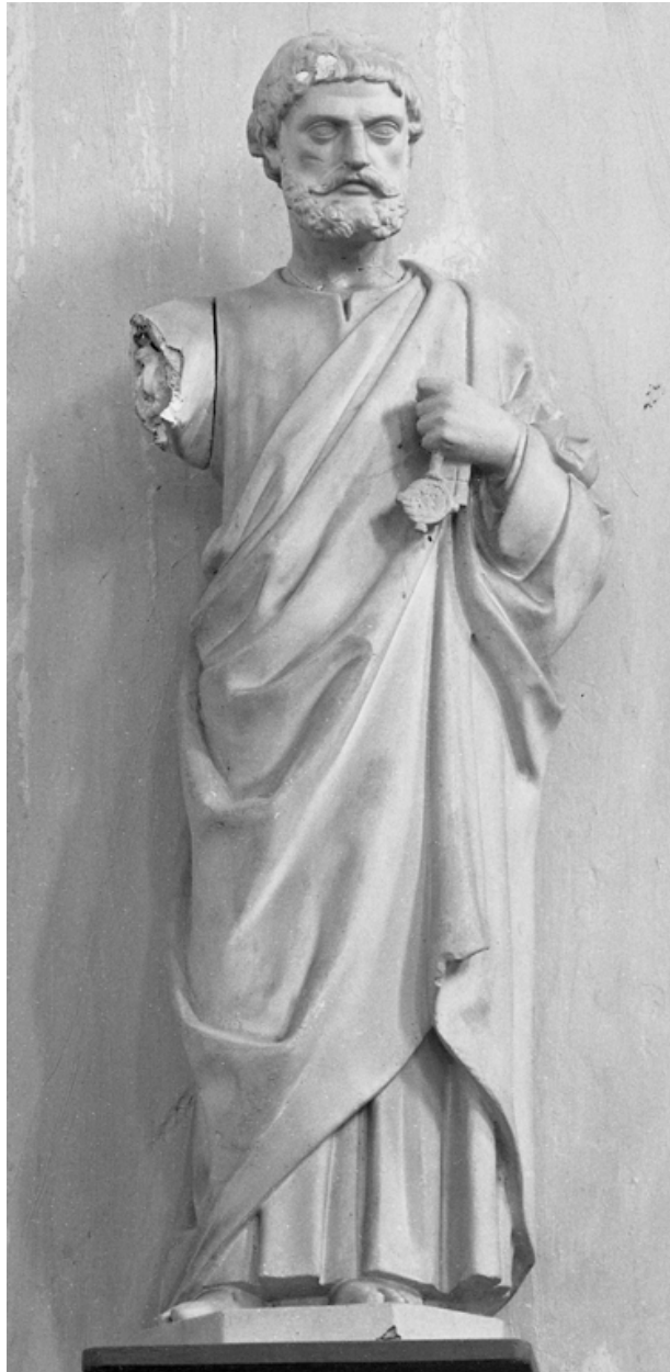
Statue de saint Pierre.