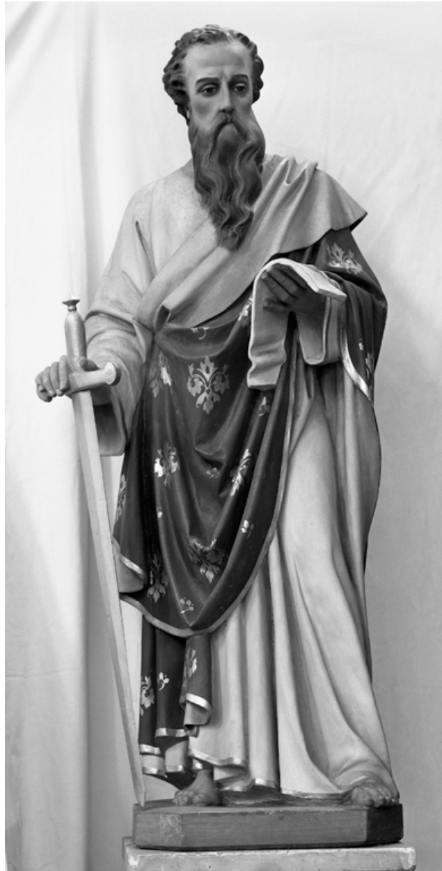
Statue de saint Paul.