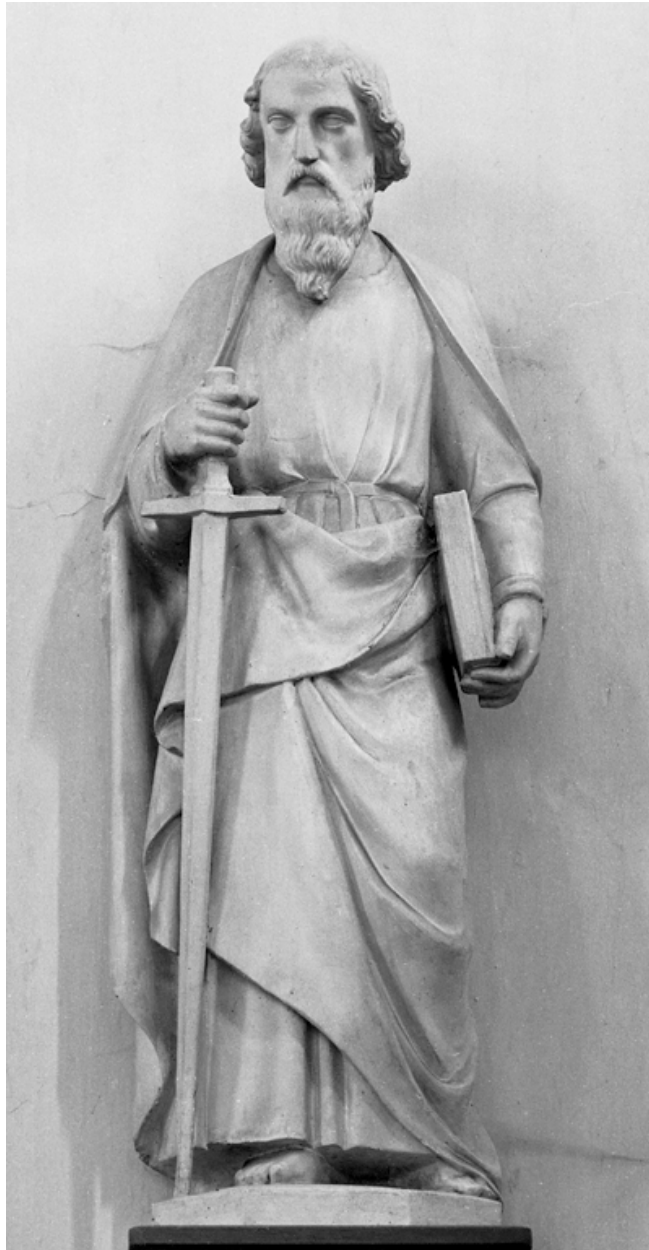
Statue de saint Paul.