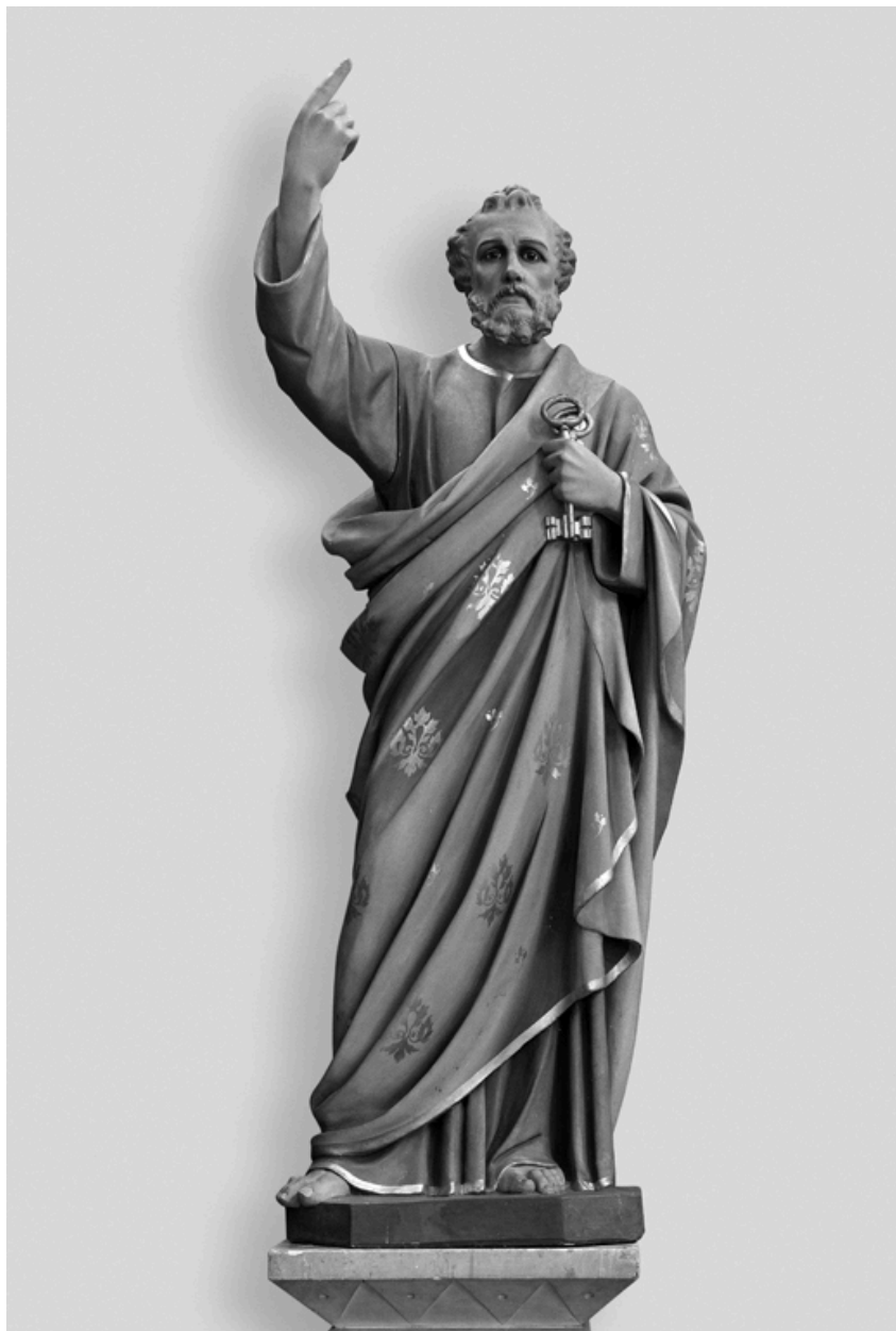
Statue de saint Pierre.