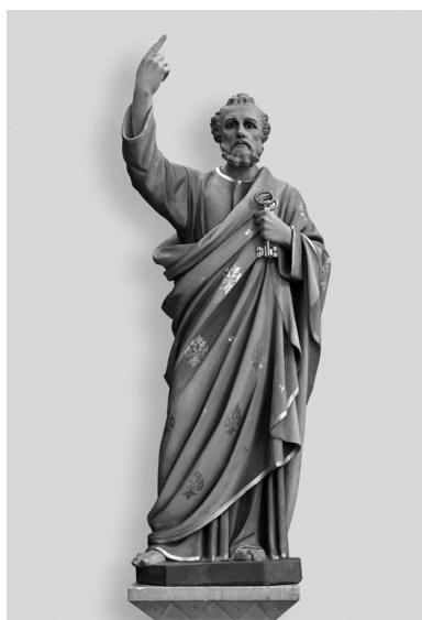
Statue de saint Pierre.