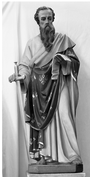
Statue de saint Paul. IVR22_19910201071X