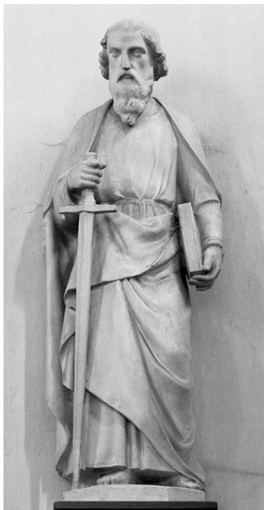
Statue de saint Paul. IVR22_19910201052X