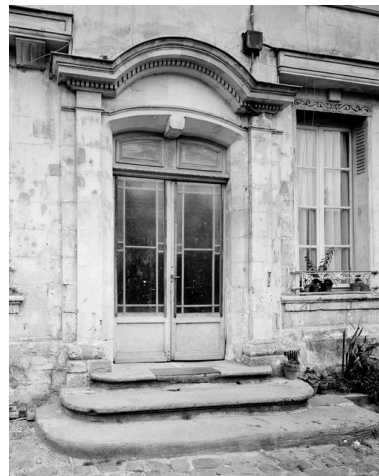
Détail de la porte.