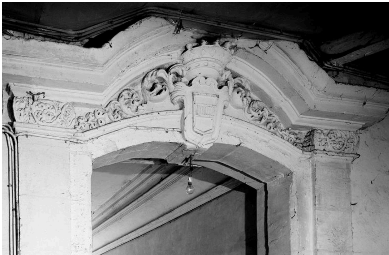
Elévation postérieure : détail du couronnement de l'arc ouvrant sur le couloir.