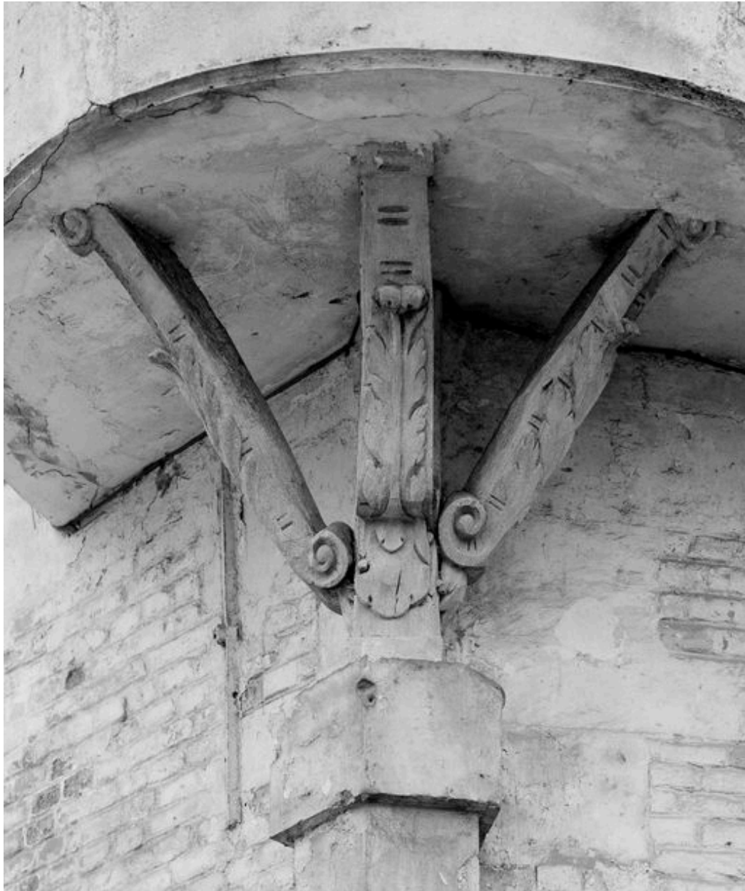
Détail des consoles de l'échauguette.