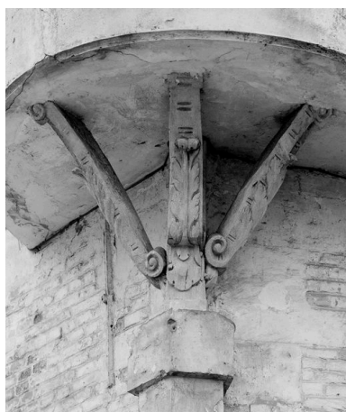
Détail des consoles de l'échauguette.