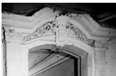
Elévation postérieure : détail du couronnement de l'arc ouvrant sur le couloir. IVR22_19856001386X