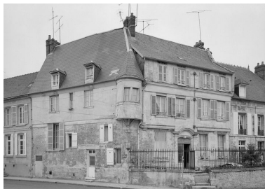
Elévation antérieure. IVR22_19856001388X