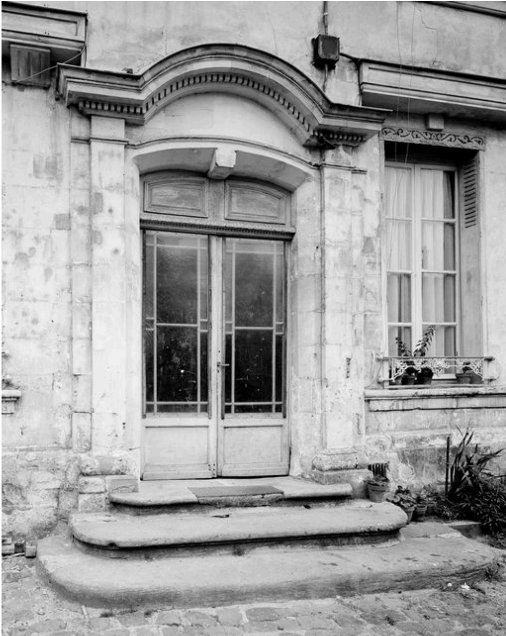
Détail de la porte.