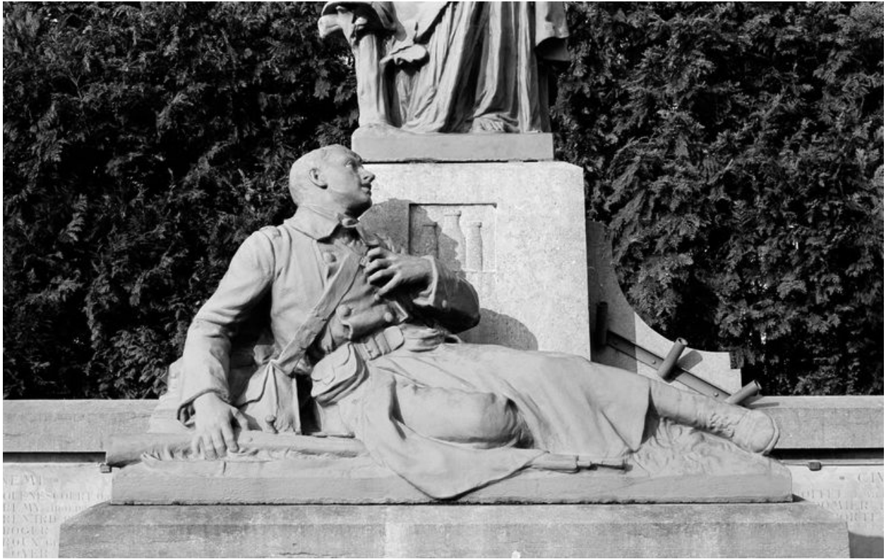
Détail de la statue du soldat mourant.