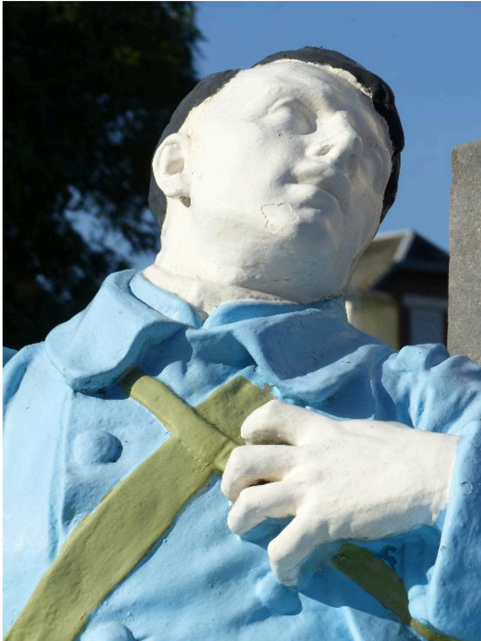
Vue de détail sur le visage du soldat.