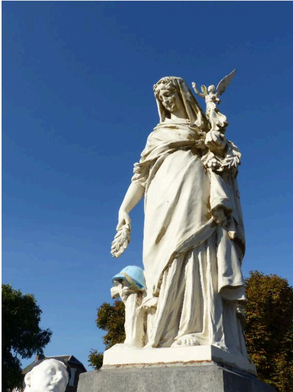
Vue de détail sur l'allégorie féminine de la Patrie.