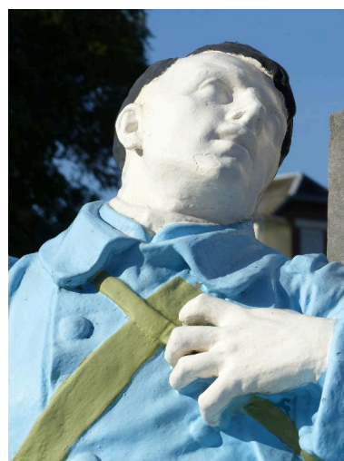
Vue de détail sur le visage du soldat. IVR32_20168006254NUCA