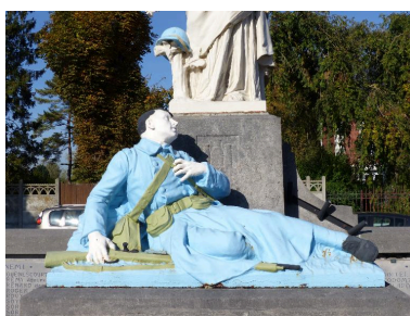
Vue de détail sur le soldat. IVR32_20168006253NUCA