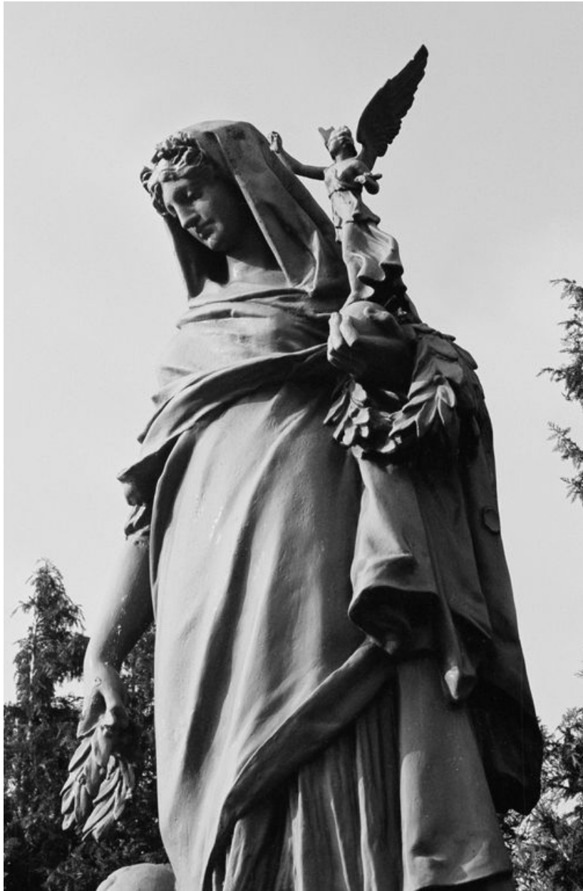
Vue à mi-corps de la statue de la Patrie victorieuse.