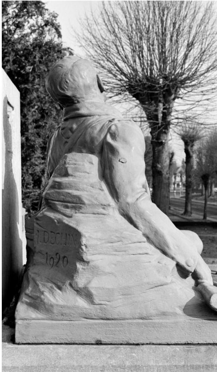
Vue du revers du soldat mourant avec la signature.