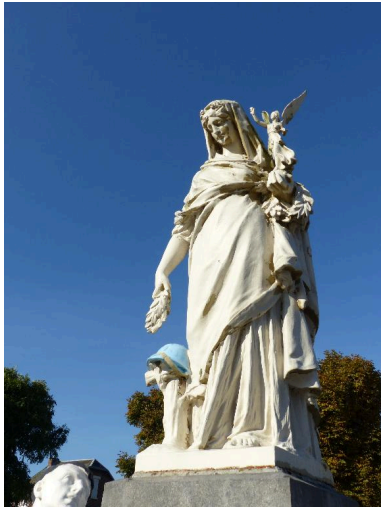
Vue de détail sur l'allégorie féminine de la Patrie.