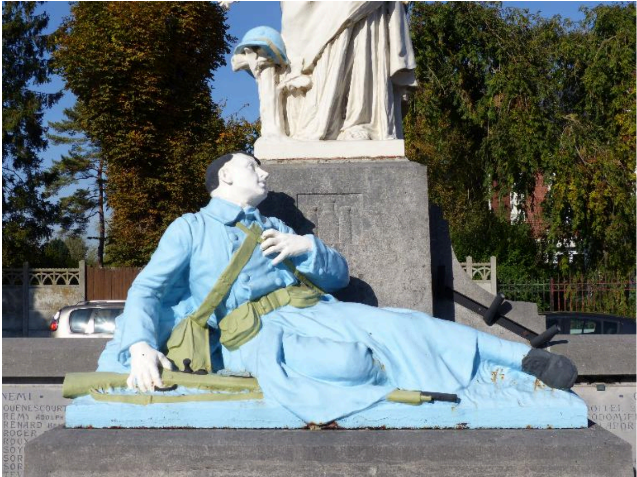
Vue de détail sur le soldat.