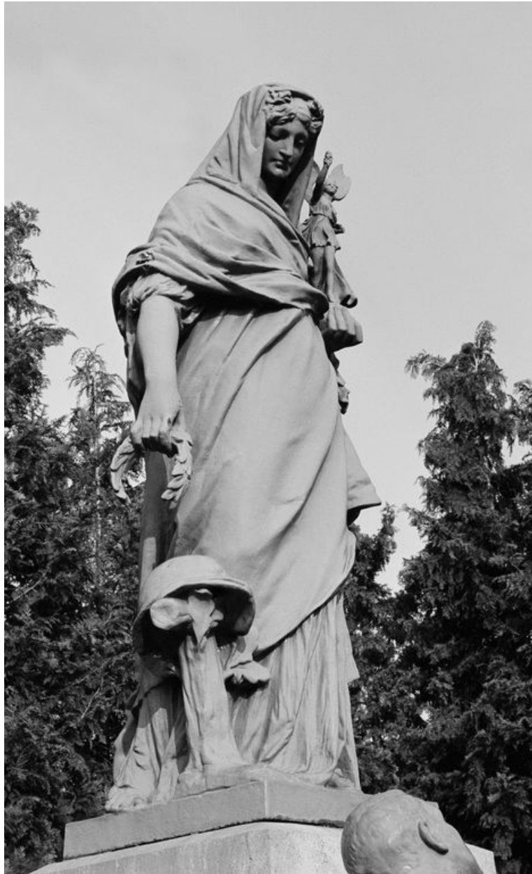
Détail de la Patrie.