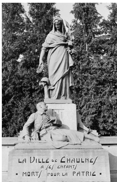
Vue générale. IVR22_19968000050Z