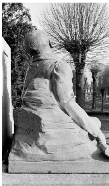
Vue du revers du soldat mourant avec la signature. IVR22_19968000055Z