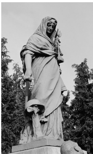
Détail de la Patrie.