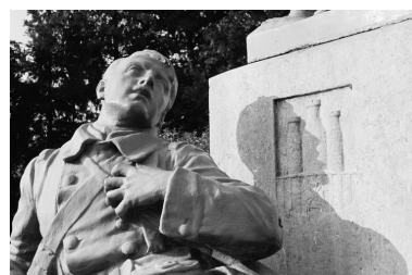
Détail de la statue du soldat mourant.