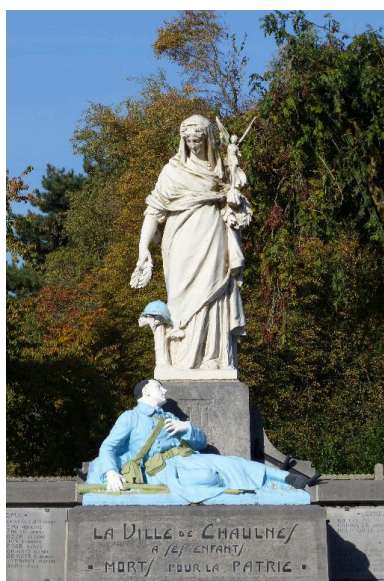
Vue générale. IVR32_20168006252NUCA