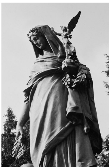
Vue à mi-corps de la statue de la Patrie victorieuse. IVR22_19968000052Z