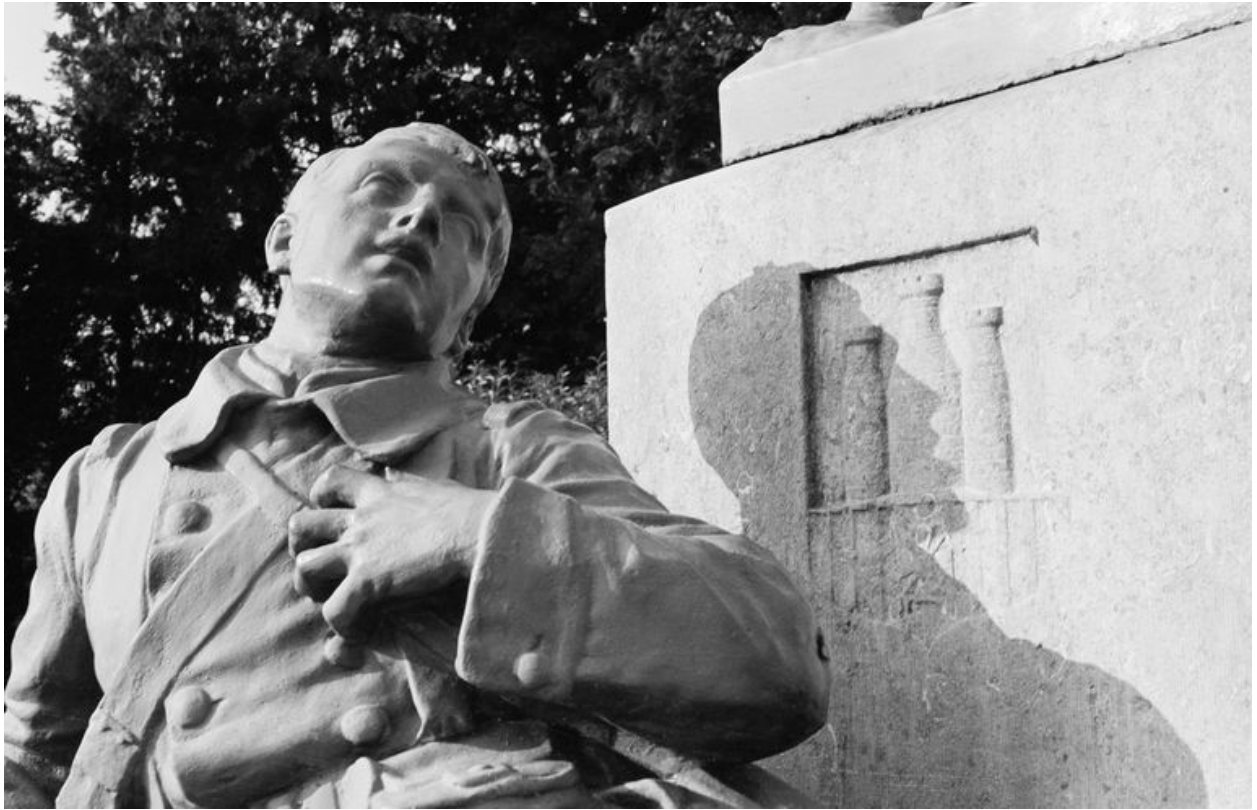
Détail de la statue du soldat mourant.