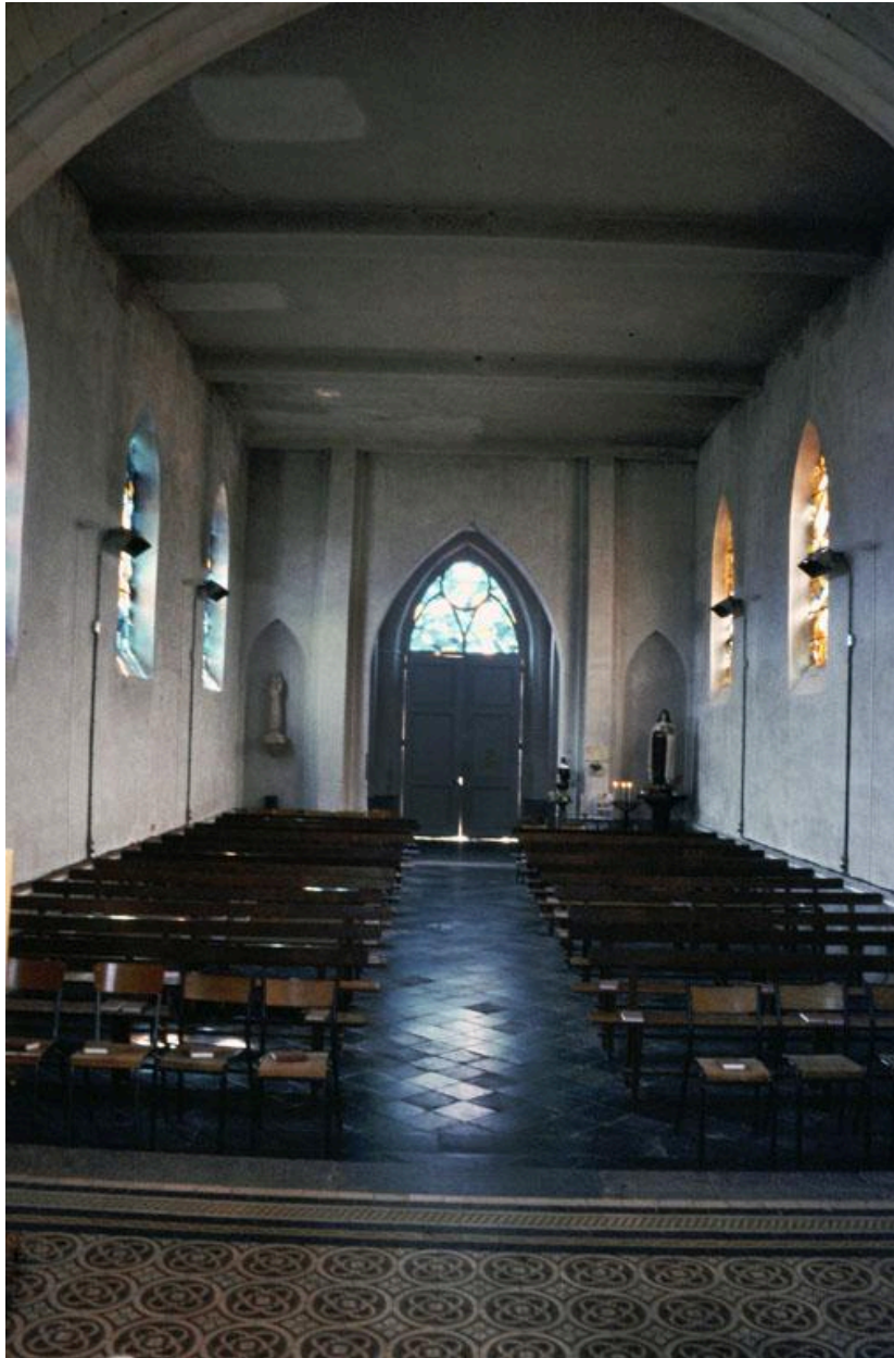
Vue de la nef et de la porte d'entrée depuis le chœur.