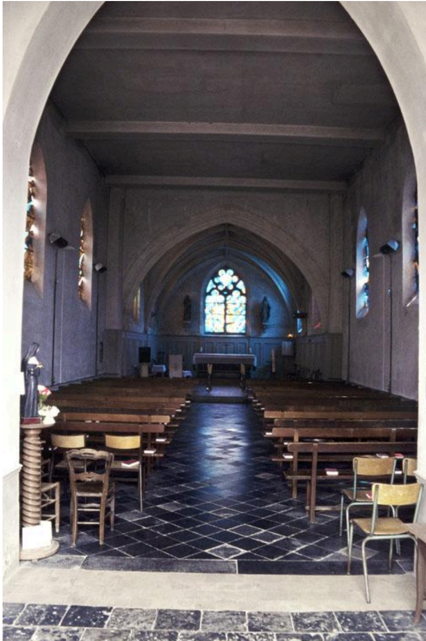
Vue intérieure de la nef et du chœur.