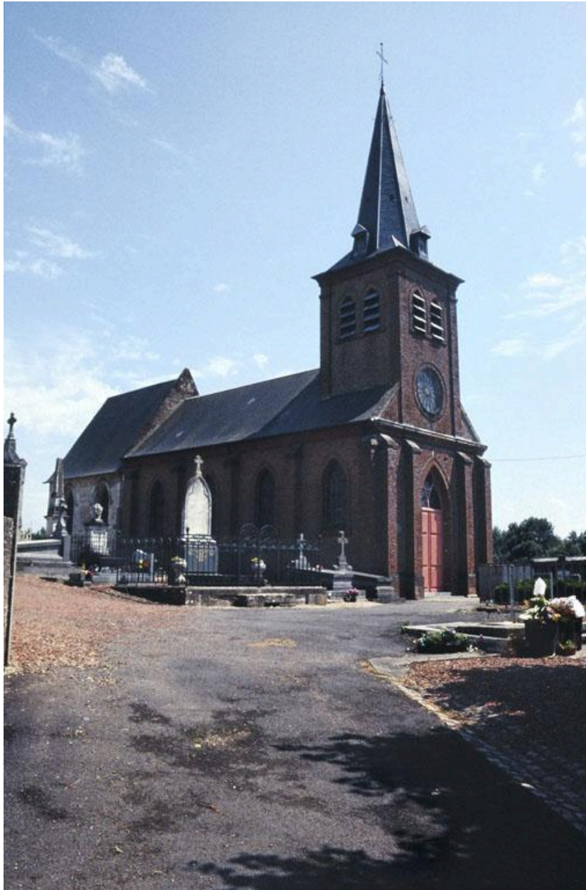
Vue de la façade occidentale et du flanc nord.