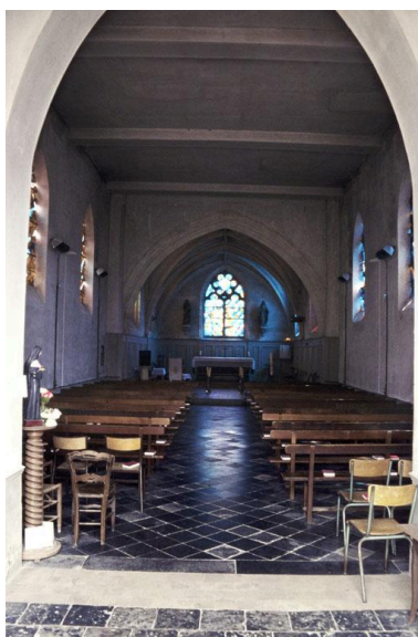
Vue intérieure de la nef et du chœur.

IVR22_20030200781ZA