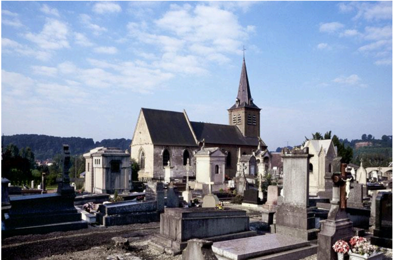
Vue générale de l'église et de son cimetière, prise depuis le nord-est.