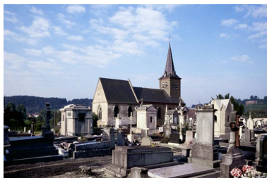
Vue générale de l'église et de son cimetière, prise depuis le nord-est. IVR22_20000202568ZA

IVR22_19990203460ZA