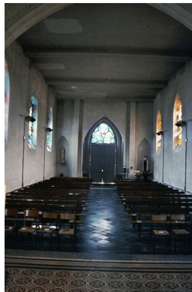
Vue de la nef et de la porte d'entrée depuis le chœur.

IVR22_20030200780ZA