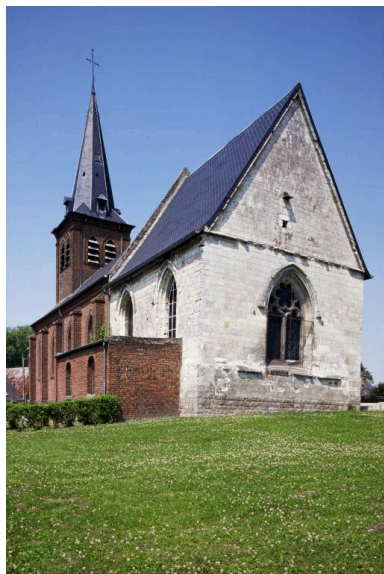
Vue du chevet et du flanc sud de l'église.

Phot. Christiane Riboulleau IVR22_19990203460ZA