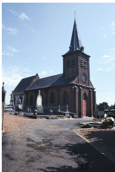
Vue de la façade occidentale et du flanc nord.

IVR22_20030200780ZA