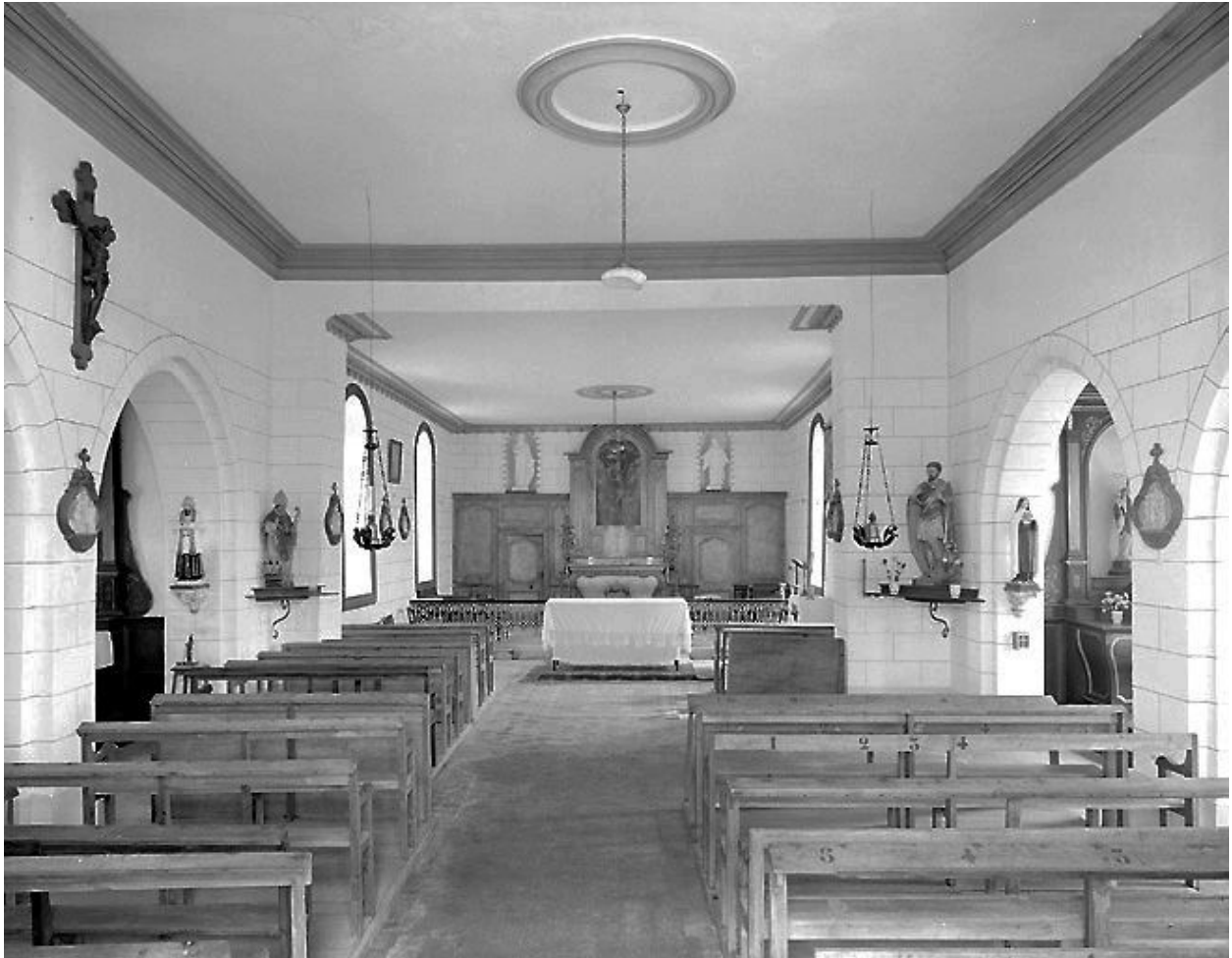
Vue intérieure de l'église.