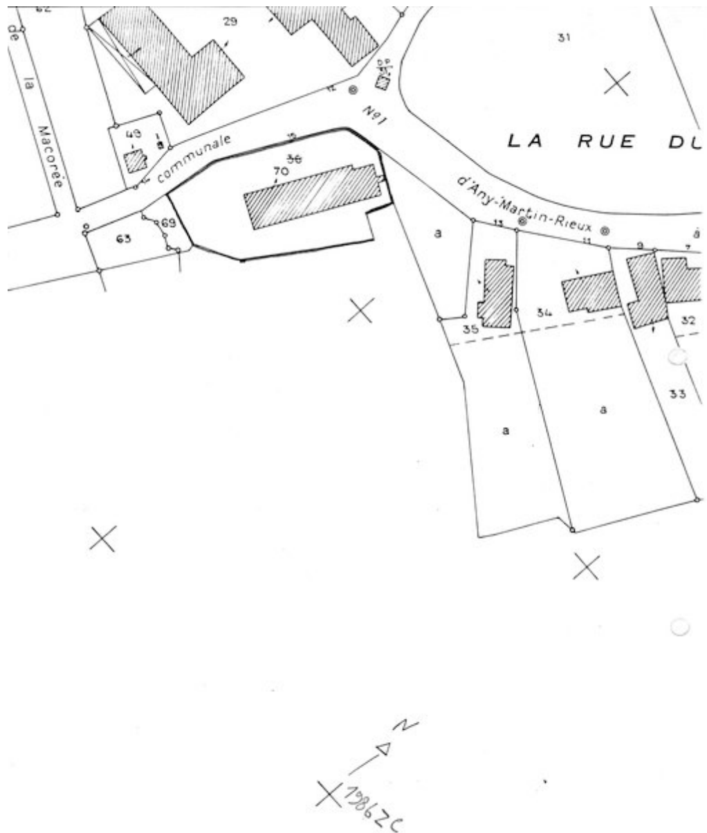
Plan de situation. Extrait du plan cadastral de 1986, section ZC.