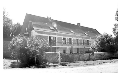
Elévation postérieure.