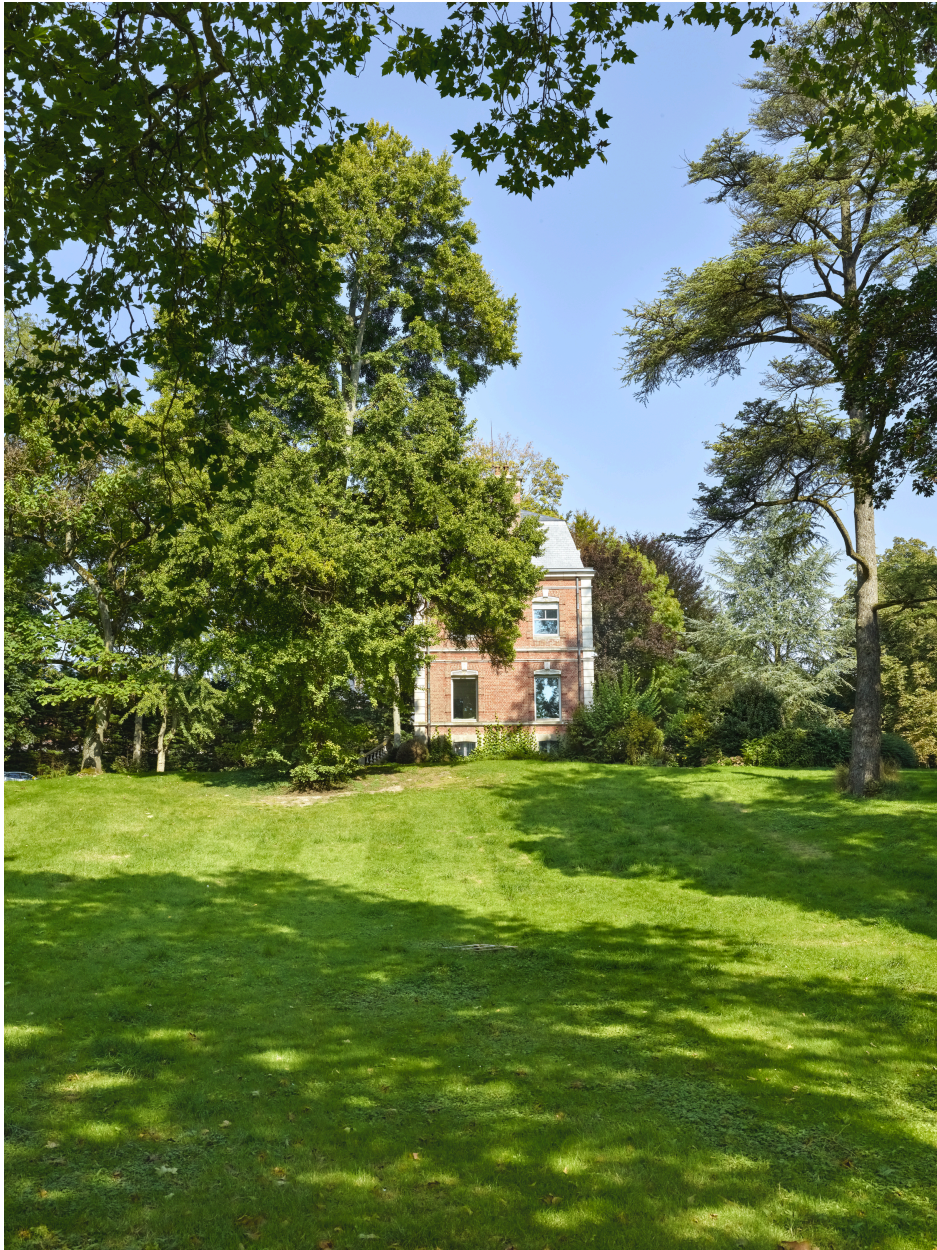
Vue de la demeure et du parc, depuis le sud.