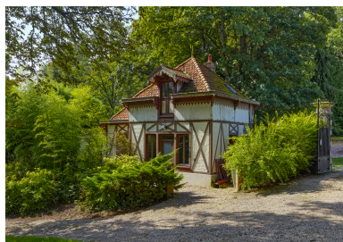
Vue de la maison du gardien, depuis l'est.