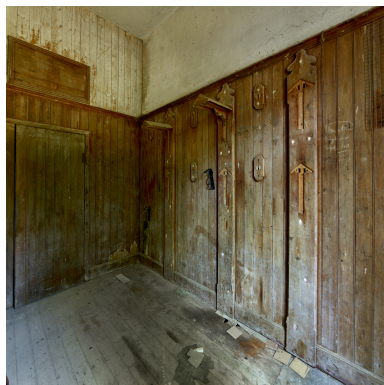
La sellerie, intérieur. IVR32_20248001426NUCA