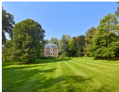
Vue de la demeure et du parc, depuis l'est. IVR32_20248001415NUCA