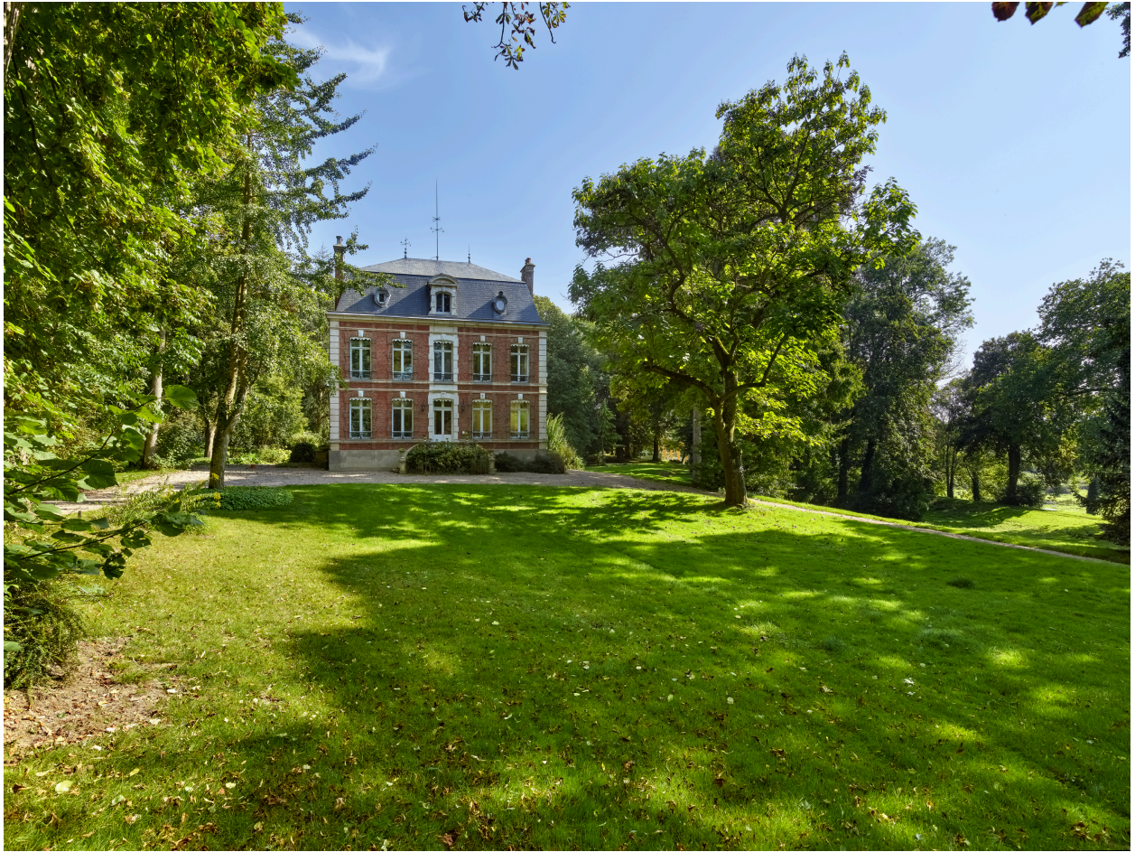
Vue de la demeure et du parc, depuis l'ouest.