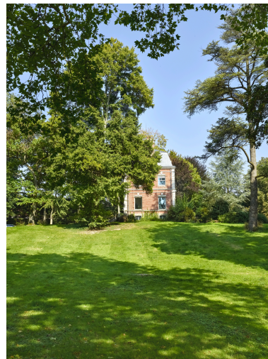
Vue de la demeure et du parc, depuis le sud. IVR32_20248001417NUCA