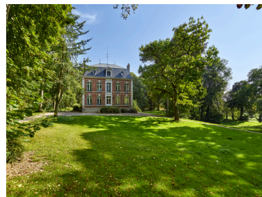
Vue de la demeure et du parc, depuis l'ouest.