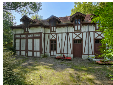
Vue des anciennes écuries et de la charreterie, depuis l'est. IVR32_20248001425NUCA