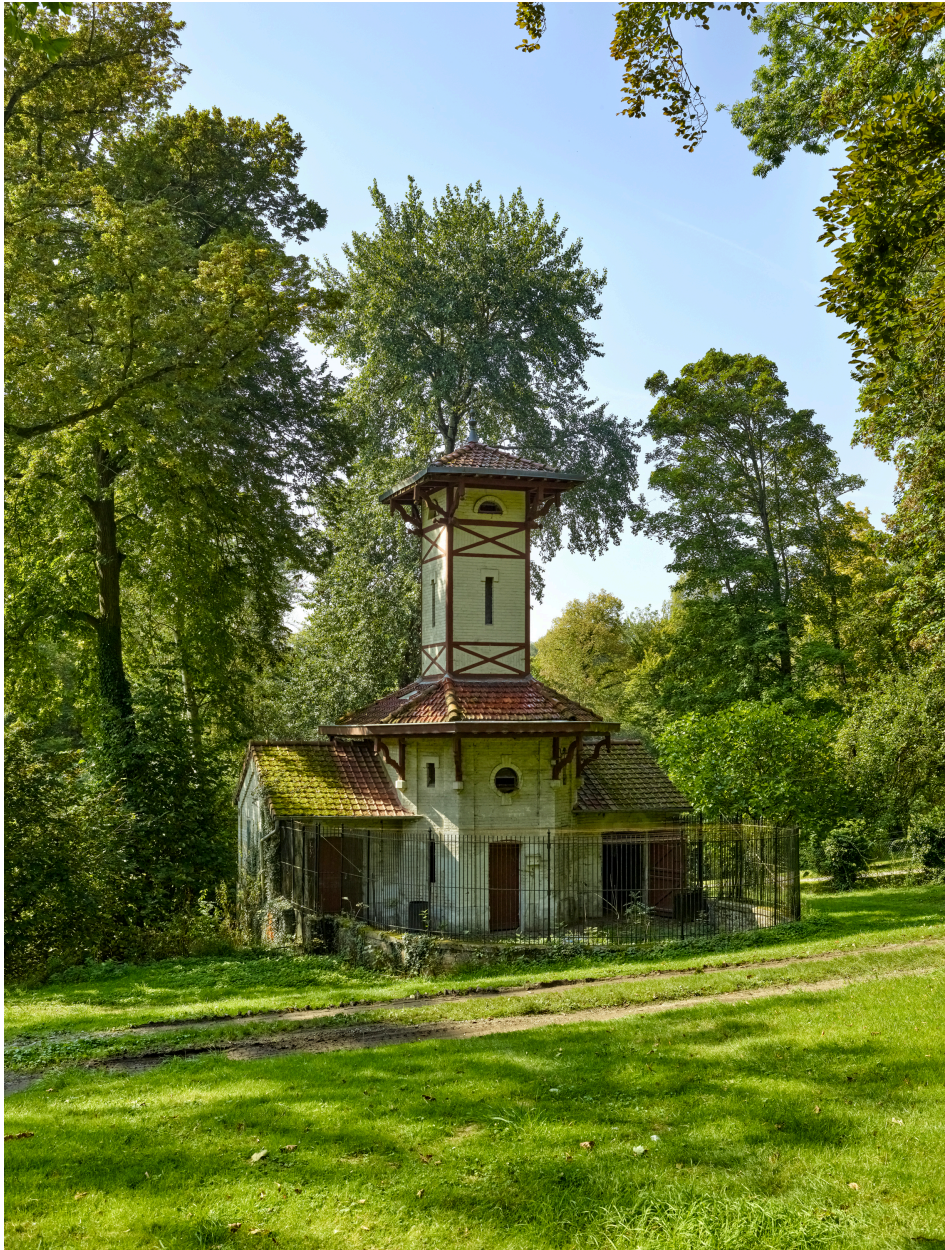
Vue du pigeonnier.