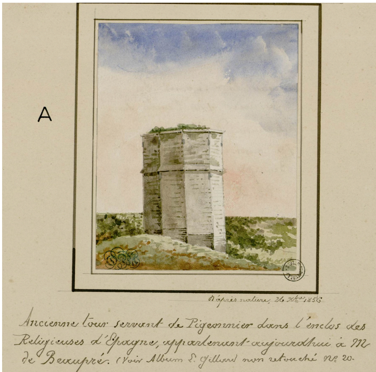
Ancienne tour servant de Pigeonnier, Oswald Macqueron, d'après nature, 26 novembre 1856 (Archives et Bibliothèque patrimoniale d'Abbeville ; Ab.M33).