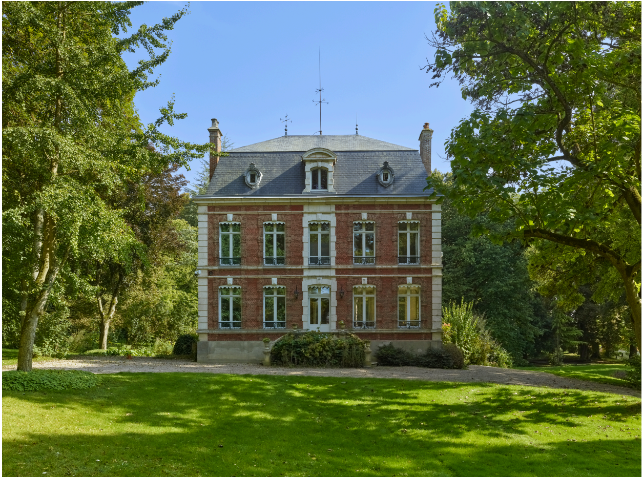
Vue de la demeure, depuis l'ouest.