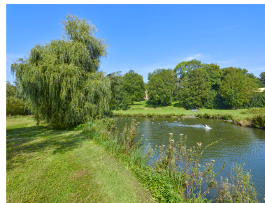
Vue du parc et de l'étang, depuis le sud.