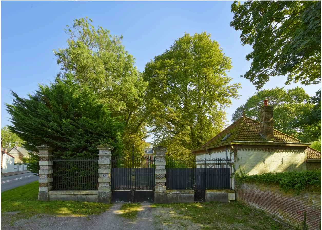
Entrée du domaine, depuis l'ouest.