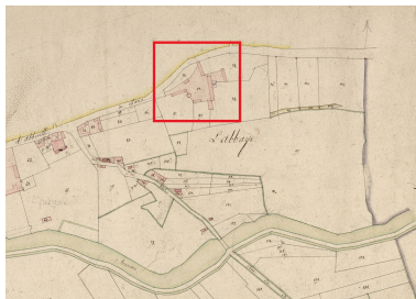
Plan masse de l'ancienne Abbaye, extrait du plan parcellaire de la commune d'Épagne-Épagnette, dit cadastre napoléonien Section A, 1820 (AD Somme ; 3 P 1339/2).