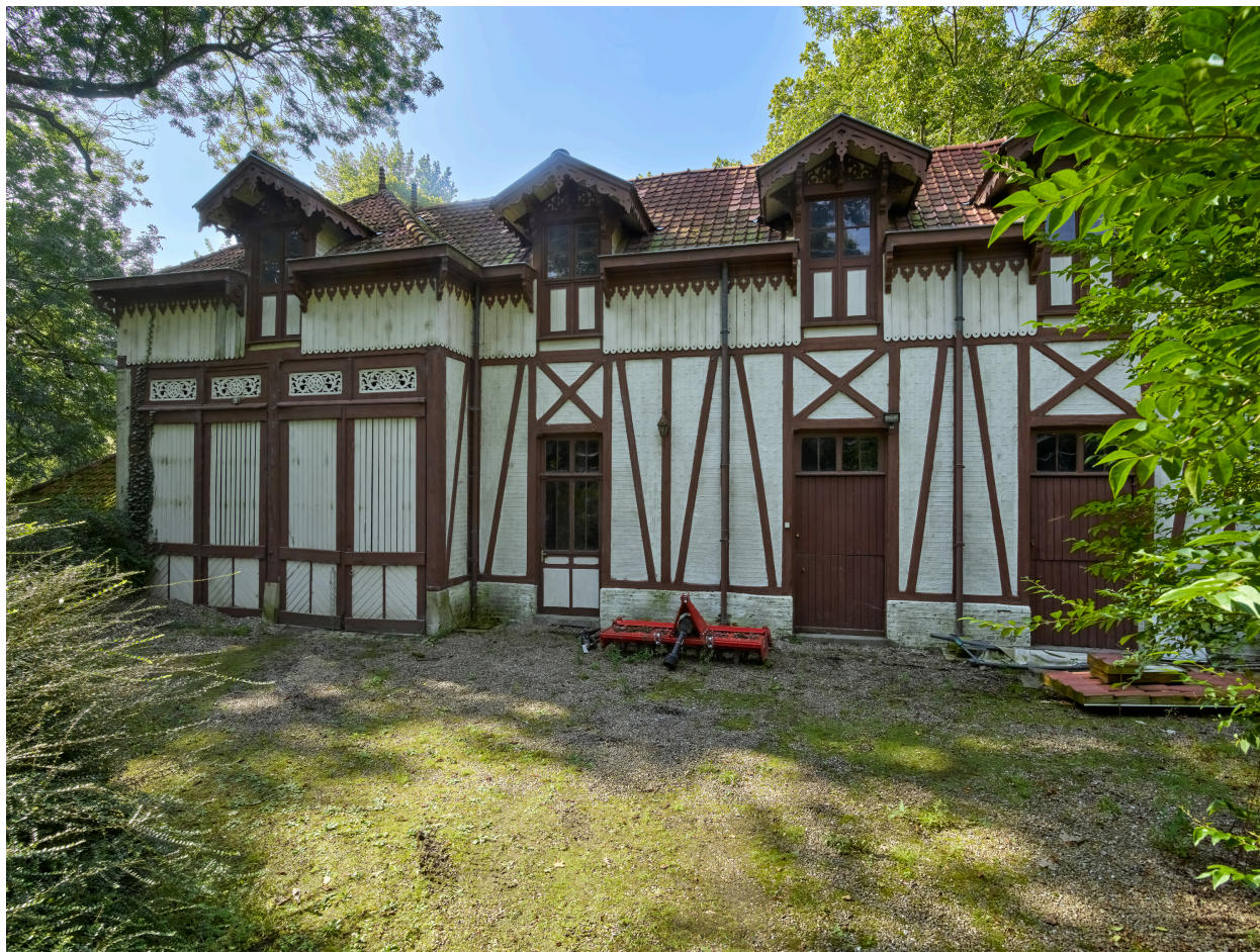
Vue des anciennes écuries et de la charreterie, depuis l'est.