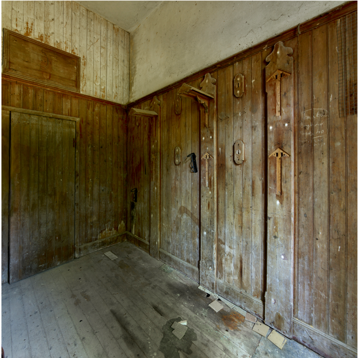
La sellerie, intérieur.