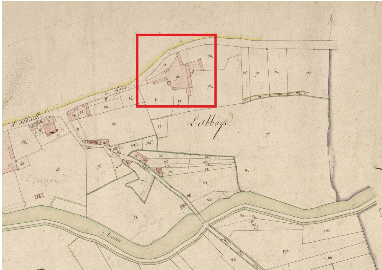
Plan masse de l'ancienne Abbaye, extrait du plan parcellaire de la commune d'Épagne-Épagnette, dit cadastre napoléonien Section A, 1820 (AD Somme ; 3 P 1339/2).