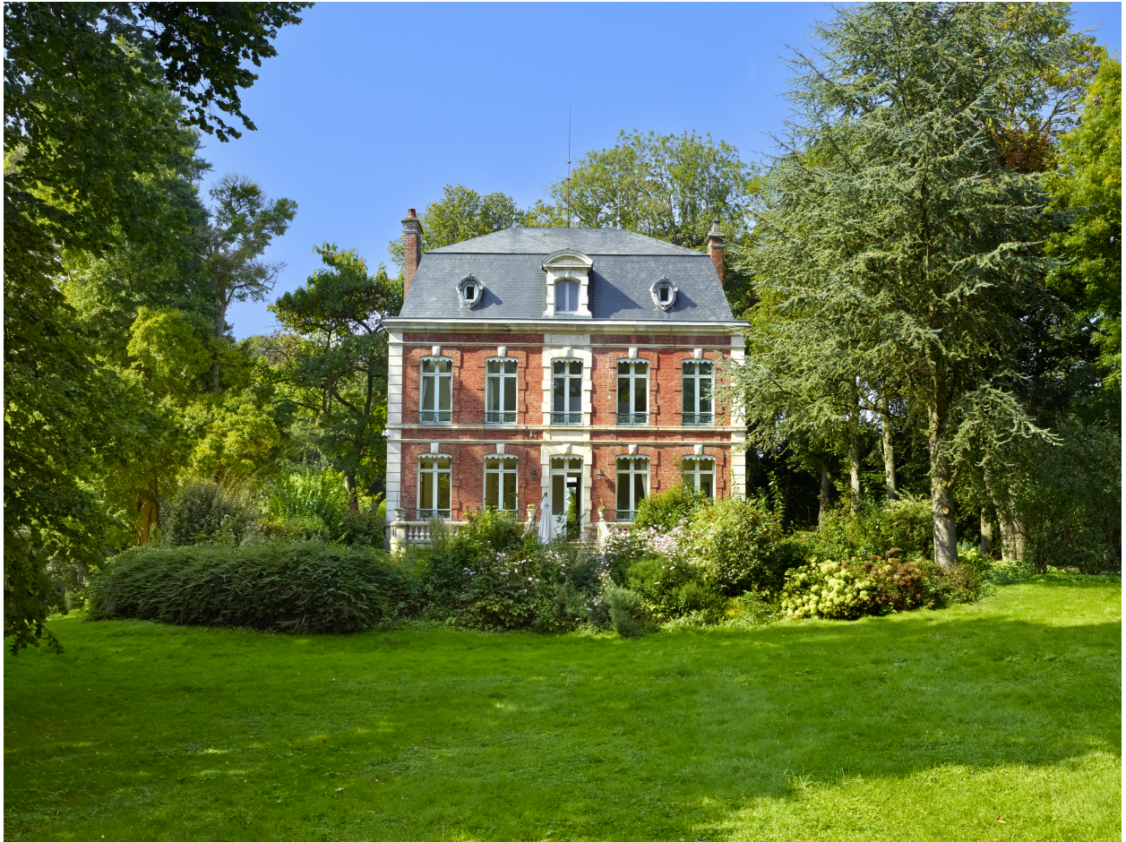
Vue de la demeure, depuis l'est.