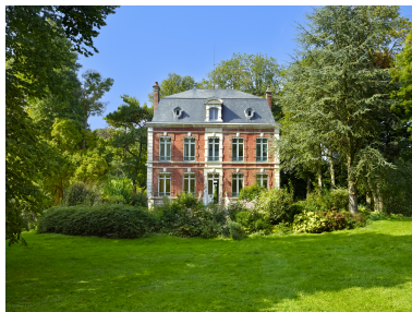
Vue de la demeure, depuis l'est. IVR32_20248001416NUCA