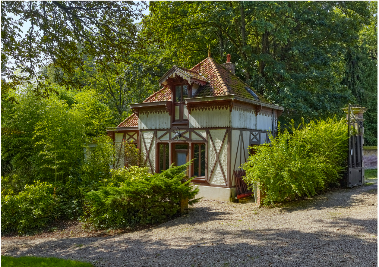
Vue de la maison du gardien, depuis l'est.