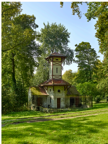
Vue du pigeonnier.