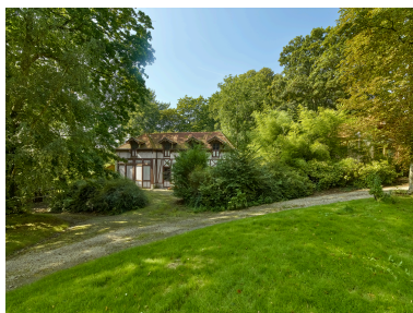
Vue des anciennes écuries et du parc, depuis l'est. IVR32_20248001424NUCA