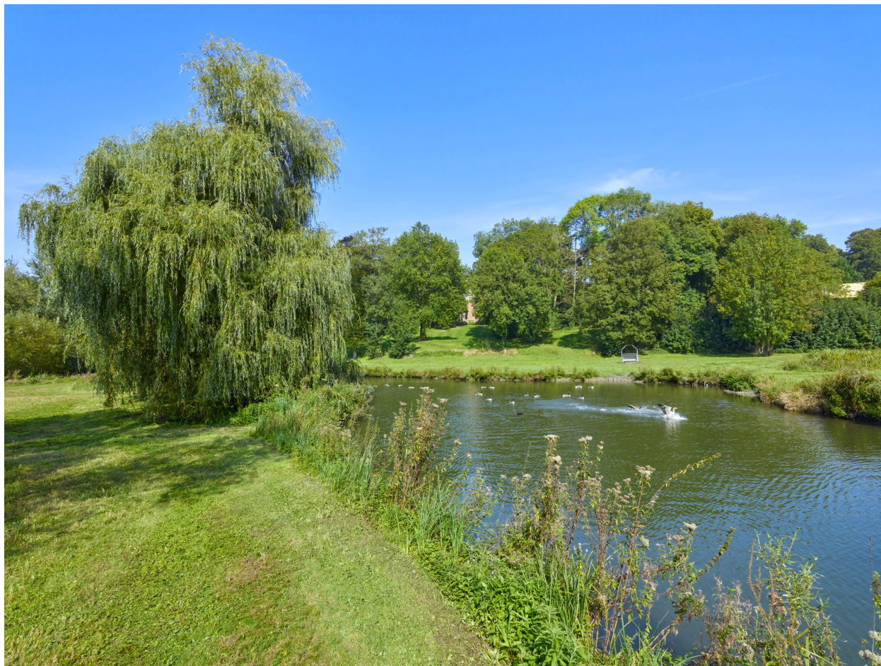
Vue du parc et de l'étang, depuis le sud.