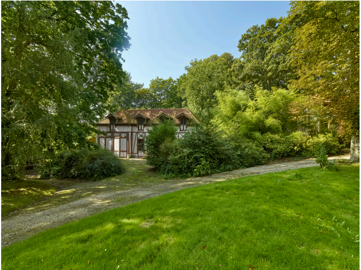
Vue des anciennes écuries et du parc, depuis l'est.