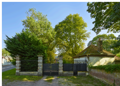
Entrée du domaine, depuis l'ouest.