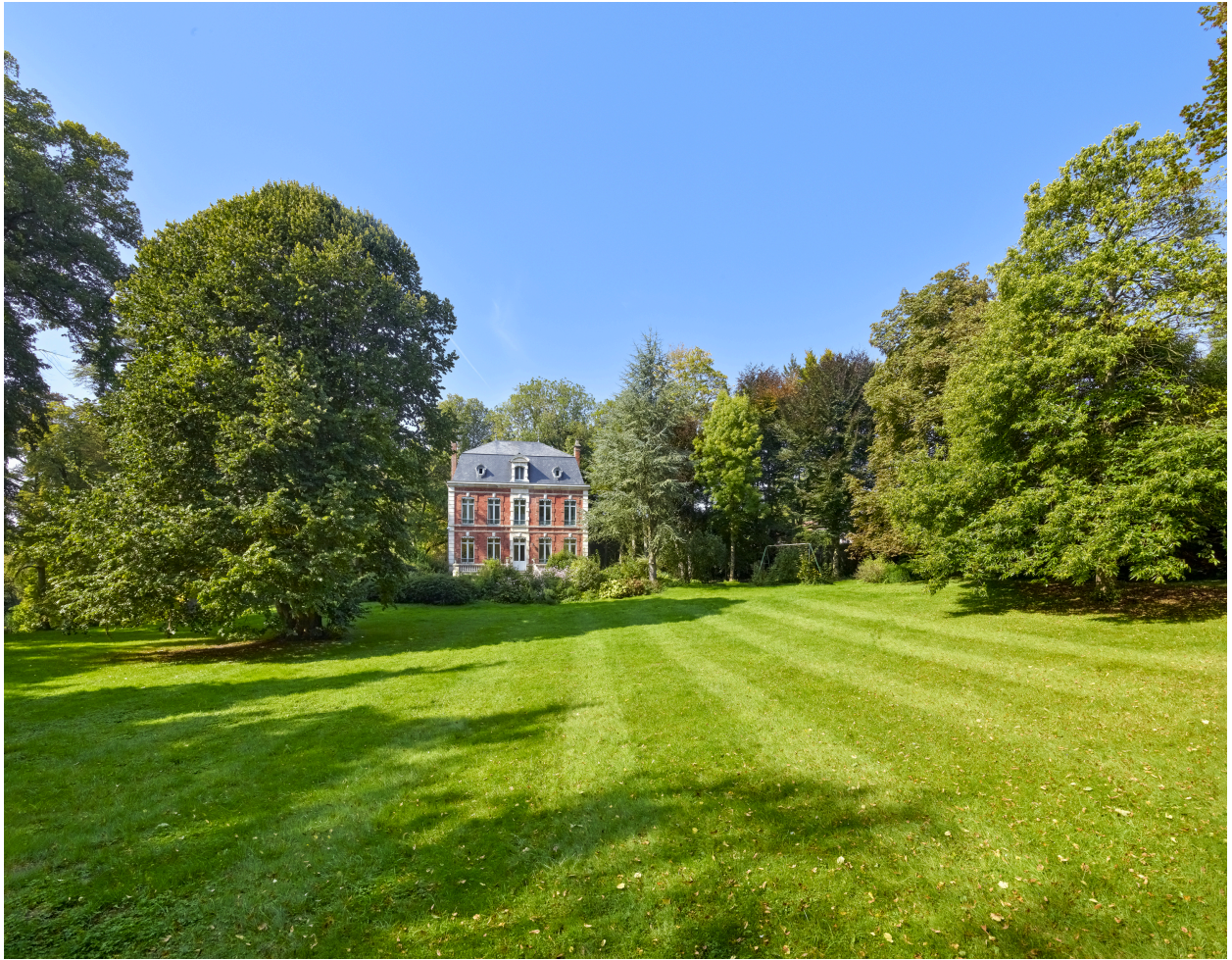
Vue de la demeure et du parc, depuis l'est.