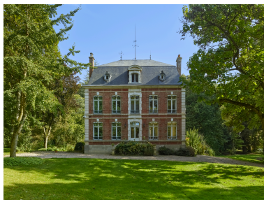
Vue de la demeure, depuis l'ouest. IVR32_20248001412NUCA