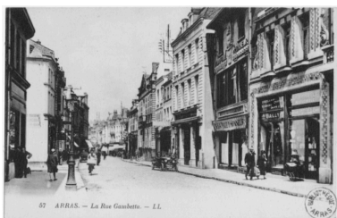
Vue des immeubles du 56 et du 60-62 rue Gambetta. IVR31_20096200319NUCB