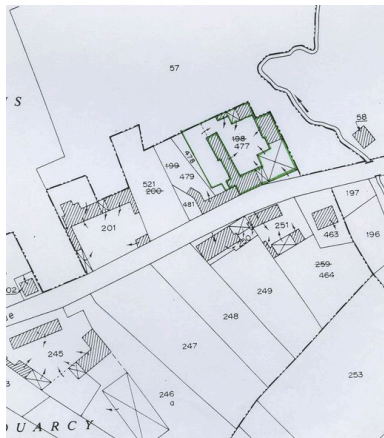
Plan de situation. Extrait du plan cadastral de 1982, section CI 477.