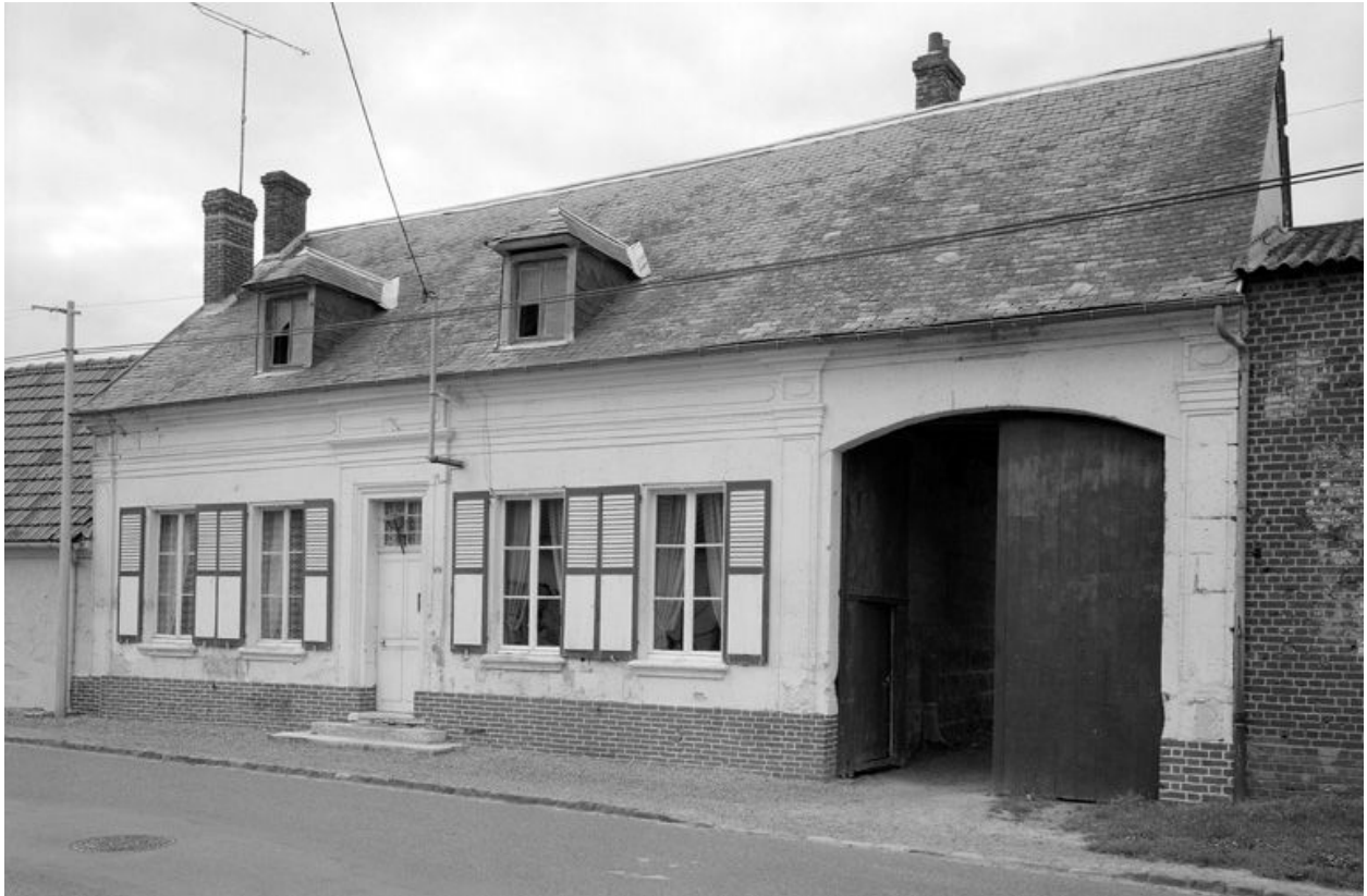
Logis. Elévation sur rue.