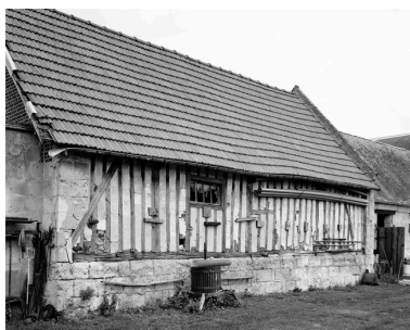
Etable. Elévation postérieure.