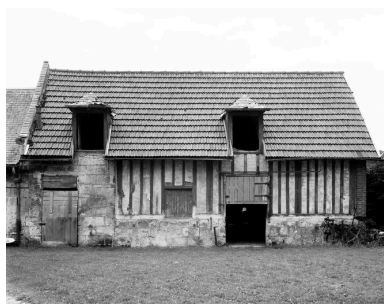
Etable. Elévation antérieure. IVR22_19846001167V