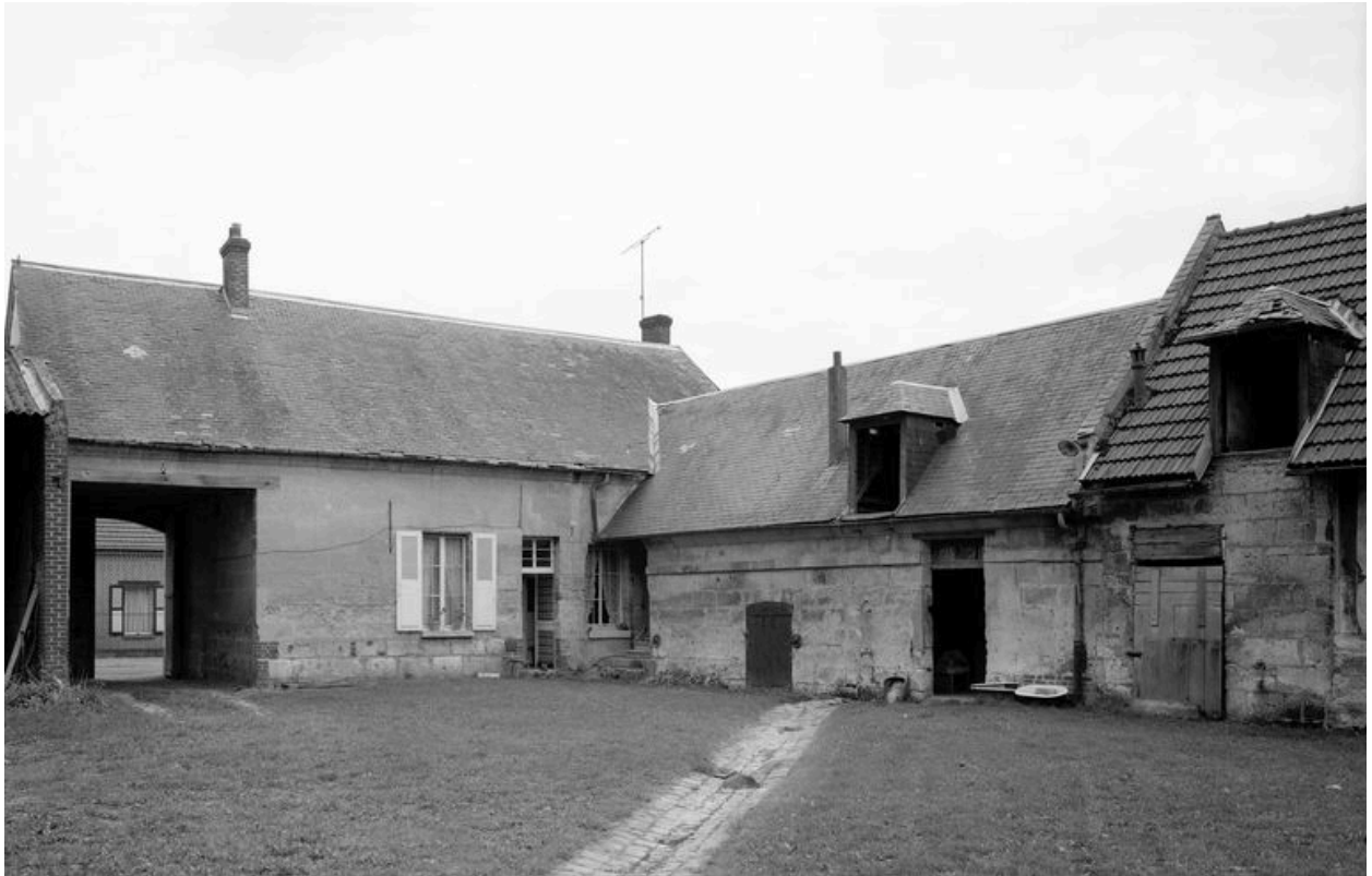
Vue partielle des bâtiments sur cour.