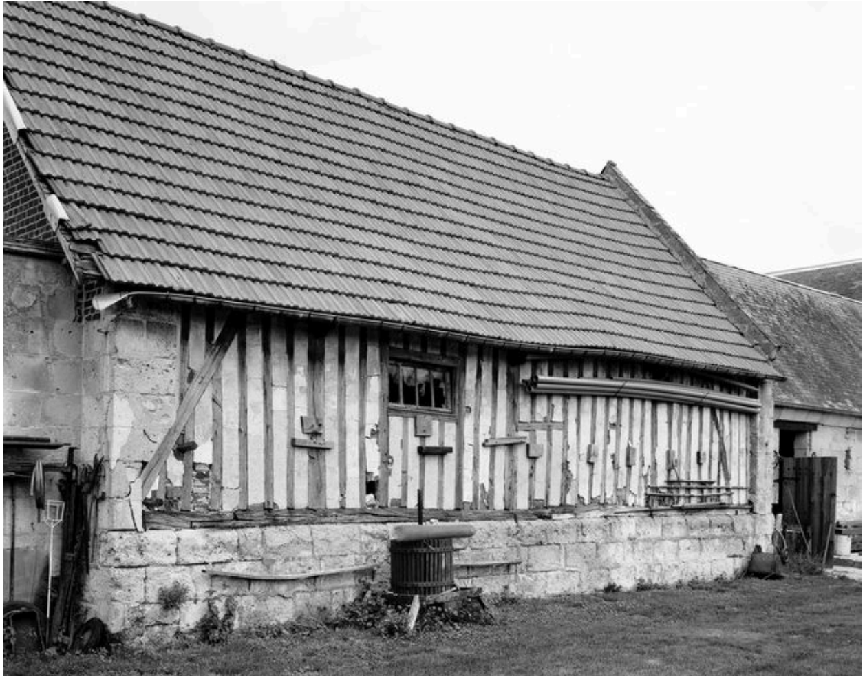
Etable. Elévation postérieure.