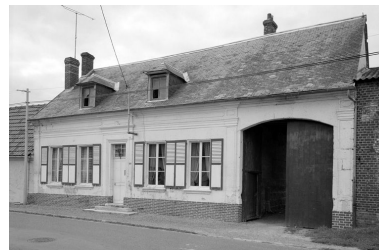
Logis. Elévation sur rue. IVR22_19846001139X