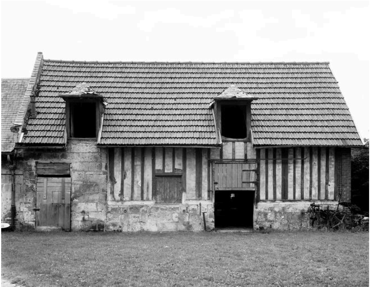
Etable. Elévation antérieure.