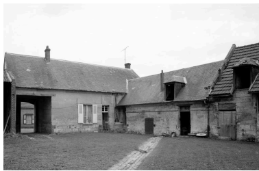
Vue partielle des bâtiments sur cour. IVR22_19846001138X