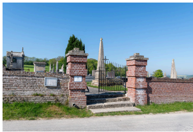
Vue générale de l'entrée du cimetière. IVR32_20256000224NUCA