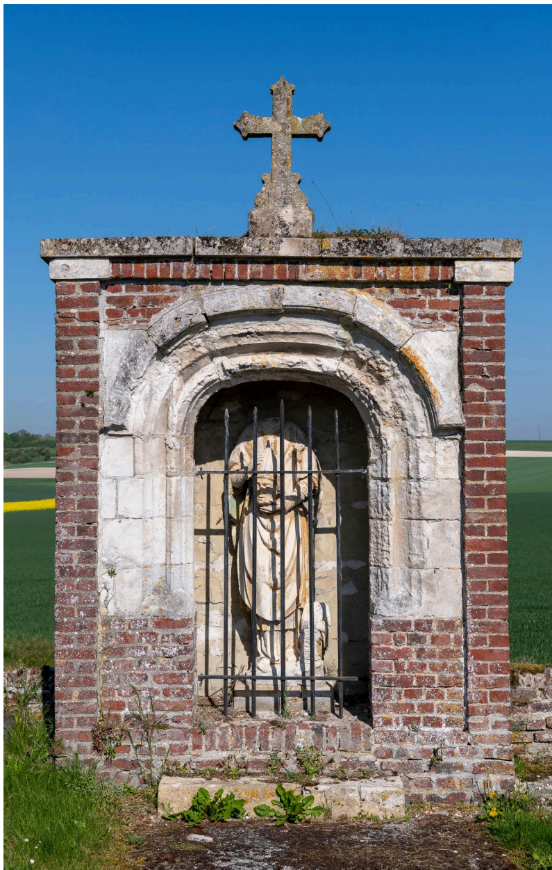
Vestiges d'une ancienne porte de l'église, XVIe siècle et statue de saint Denis, pierre, XVIe siècle.