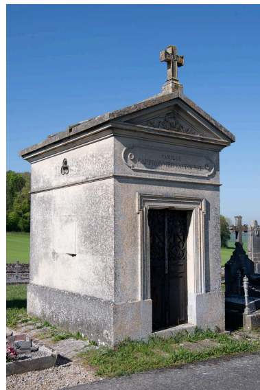
Chapelle funéraire de la famille Capronnier-Vaudremer, pierre, signé "Boussard" à Breteuil.

Phot. Marc Kérignard IVR32_20256000219NUCA