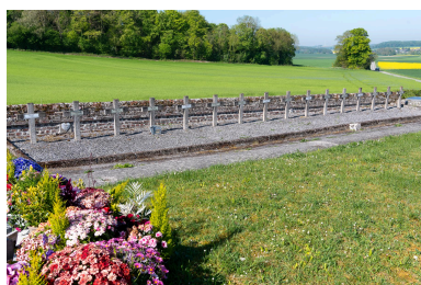
Carré militaire des soldats morts pendant la Première Guerre mondiale.

IVR32_20256000222NUCA