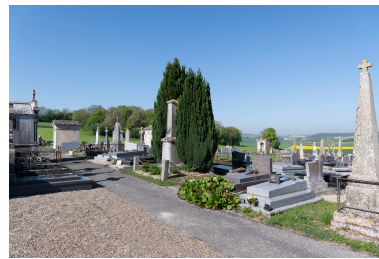
Vue générale depuis l'entrée. IVR32_20256000218NUCA