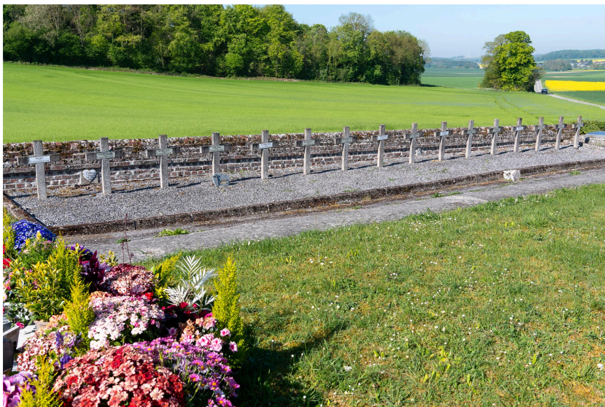
Carré militaire des soldats morts pendant la Première Guerre mondiale.