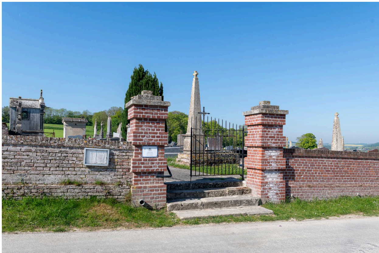
Vue générale de l'entrée du cimetière.