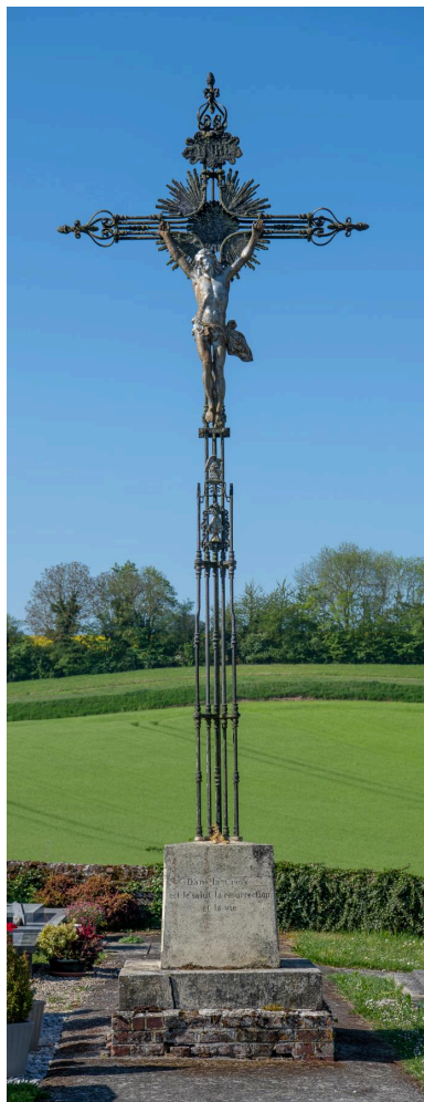
Croix du cimetière, fer et fonte, seconde moitié du XIXe siècle.

IVR32_20256000222NUCA