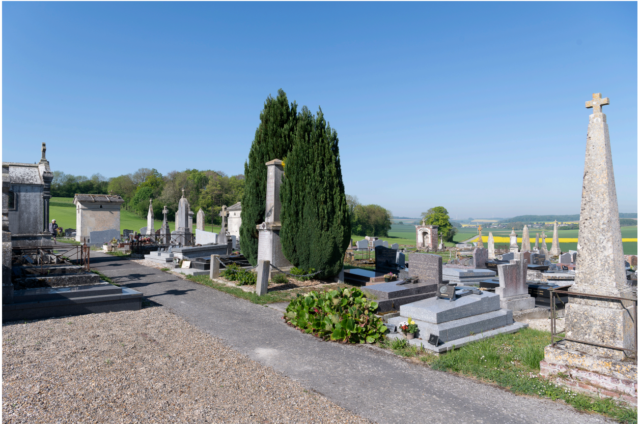
Vue générale depuis l'entrée.