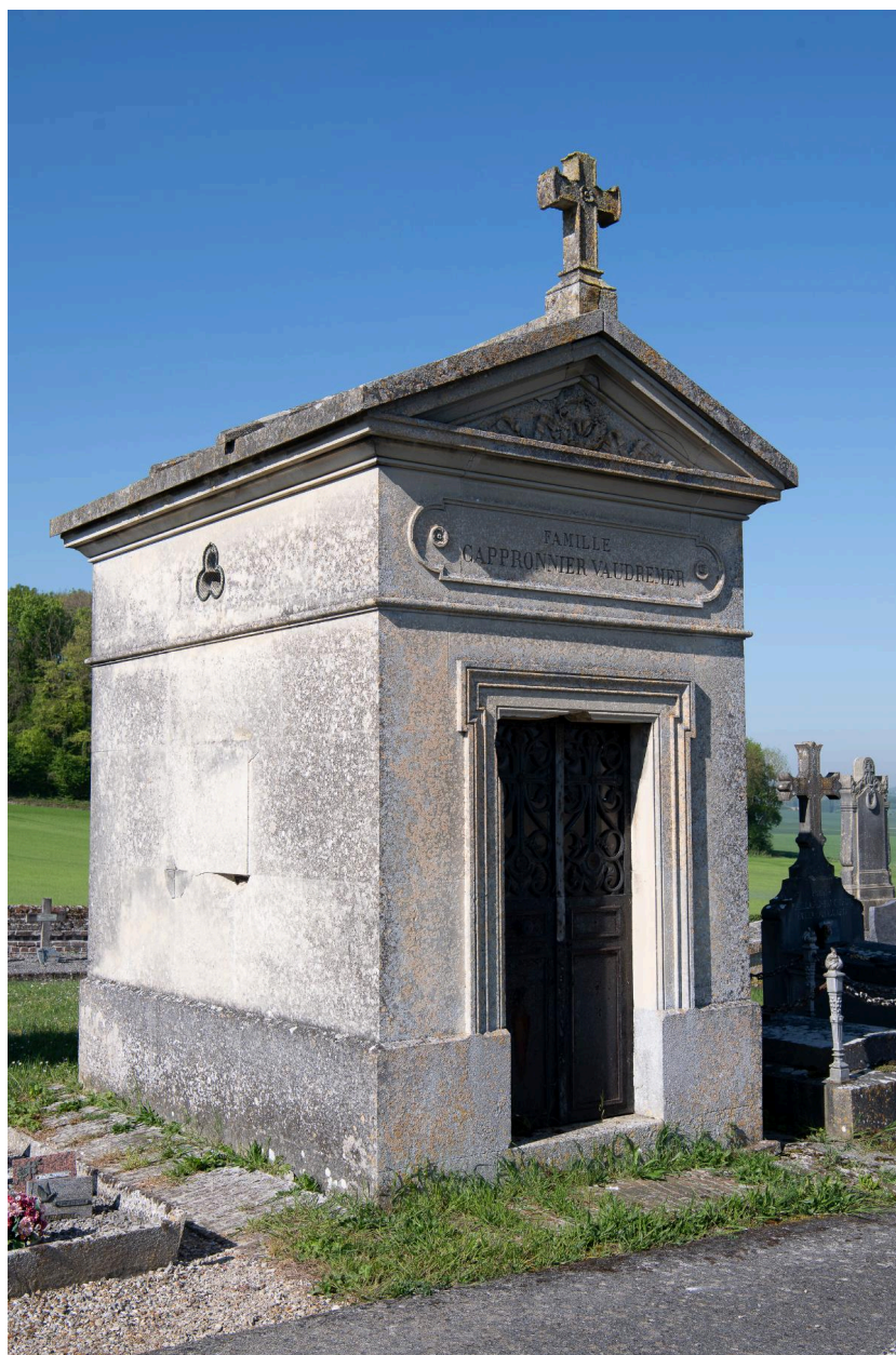
Chapelle funéraire de la famille Cappronier-Vaudremer, pierre, signé "Boussard" à Breteuil.