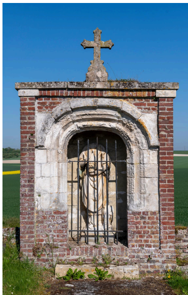
Vestiges d'une ancienne porte de l'église, XVIe siècle et statue de saint Denis, pierre, XVIe siècle.

IVR32_20256000223NUCA