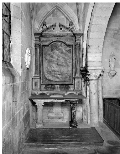
Vue d'ensemble de l'autel de Saint-Sébastien et de son décor, en 1993.

IVR22_19930200069V