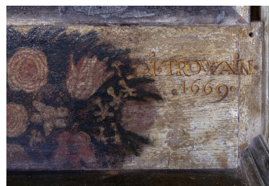
Détail de la signature et de la date de réalisation (avant restauration).

IVR22_20010202989X