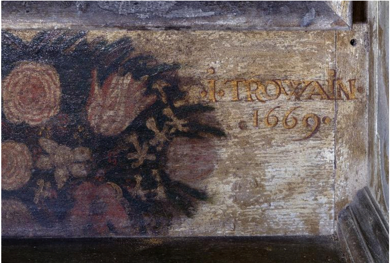
Détail de la signature et de la date de réalisation (avant restauration).