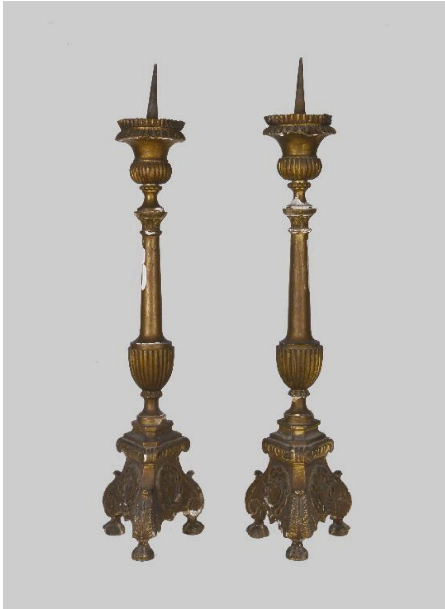
Vue des deux chandeliers d'autel.