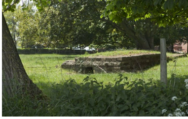
Vue générale, vers l'ouest IVR31_20145904095NUCA