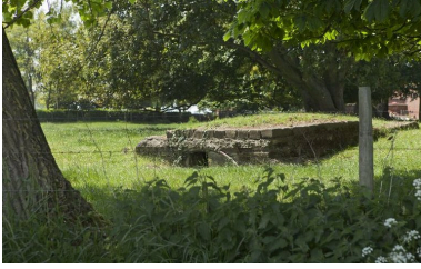
Vue générale, vers l'ouest IVR31_20145904095NUCA