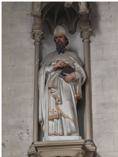
Chapelle, intérieur : vue générale de la statue du saint évêque. IVR31_20106202984NUCA