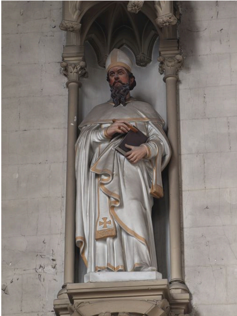
Chapelle, intérieur : vue générale de la statue du saint évêque.