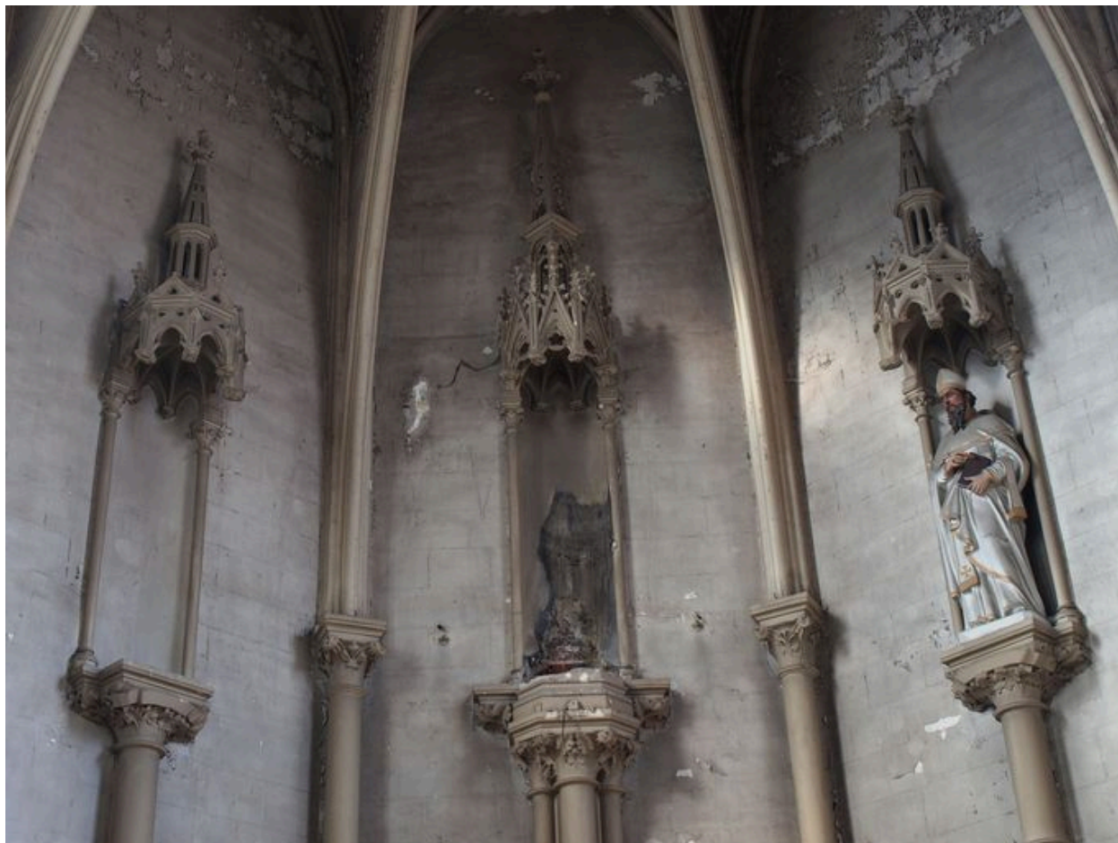
Chapelle, intérieur : emplacement des statues de l'abside ; saint évêque à droite sur l'image.