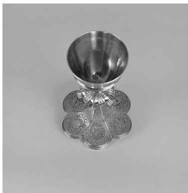
Pied, vue de dessus.