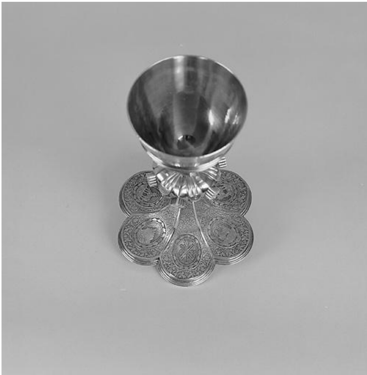
Pied, vue de dessus.