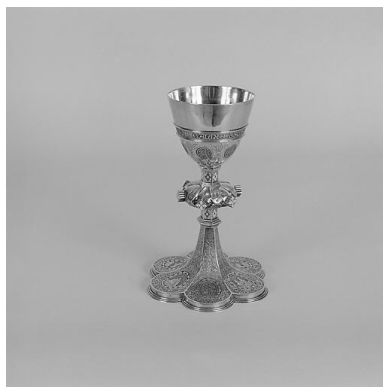
Vue générale. IVR31_19976200072X