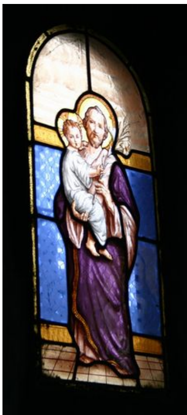
Vue générale du vitrail représentant saint Joseph et l'Enfant Jésus.