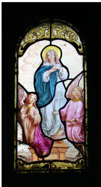
Vue générale du vitrail représentant l'Assomption.