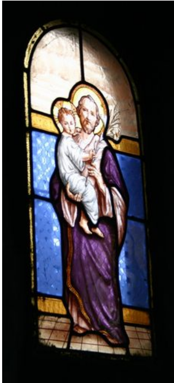
Vue générale du vitrail représentant saint Joseph et l'Enfant Jésus.