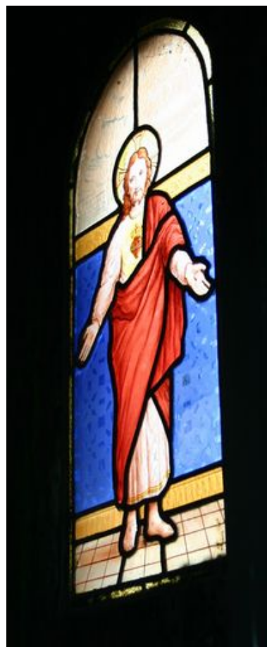
Vue générale du vitrail représentant le Christ du Sacré Coeur.