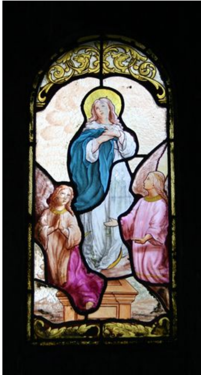
Vue générale du vitrail représentant l'Assomption.