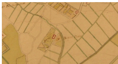
Extrait d'une carte du 18e siècle présentant le plan et les terres de la ferme.