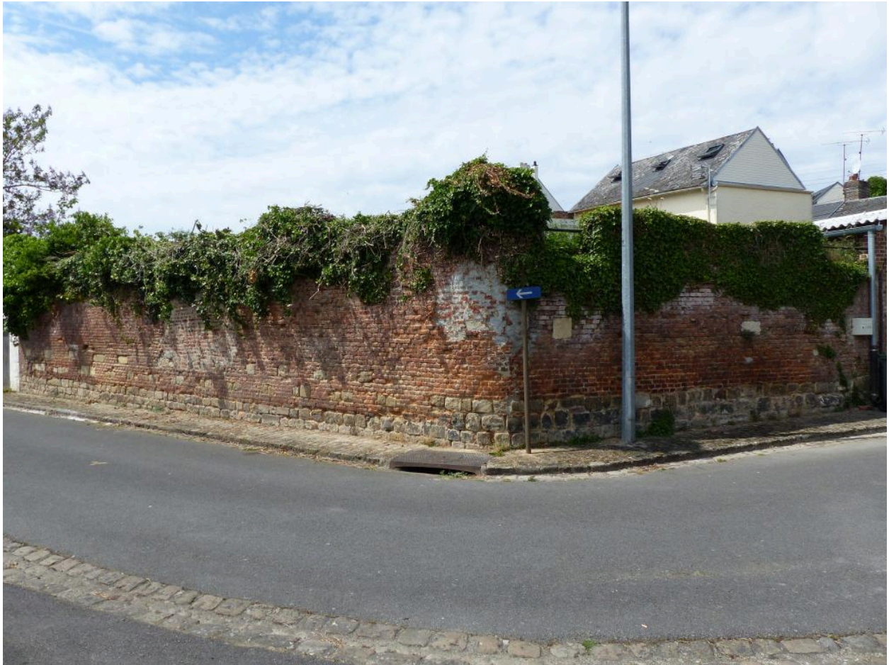
Rue de la Fontaine. Vestiges du mur de soutènement de l'ancien cimetière de l'église.