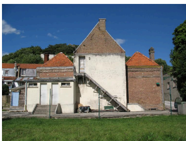
Vue d'ensemble de la façade postérieure. IVR22_20128005089NUCA