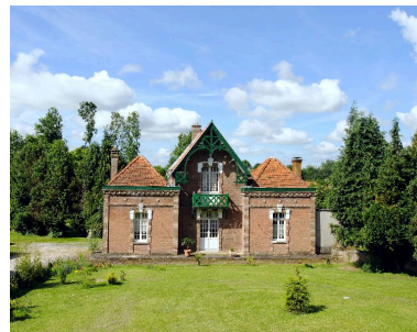
Ensemble sur rue, vue de face. IVR22_20128000302NUC2A