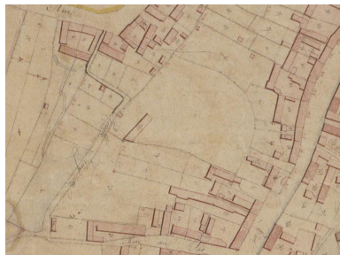
Extrait du cadastre napoléonien de 1833 (AD Somme ; 3 P 1613/7). IVR22_20138016174NUC2A