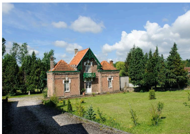
Vue d'ensemble sur rue. IVR22_20128000300NUC2A