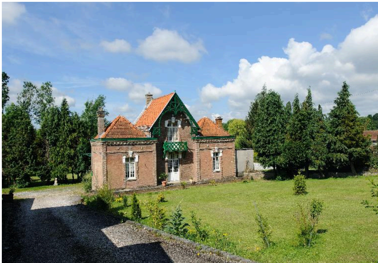
Vue d'ensemble sur rue.