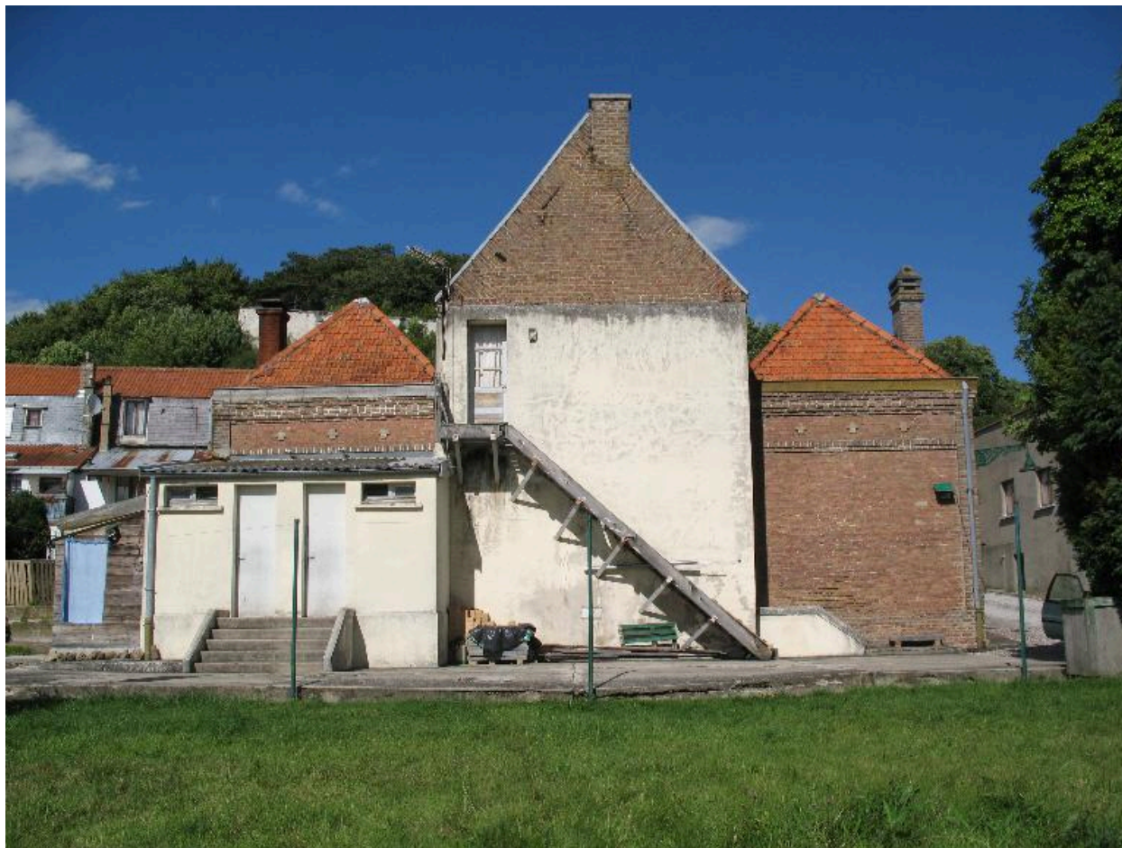
Vue d'ensemble de la façade postérieure.