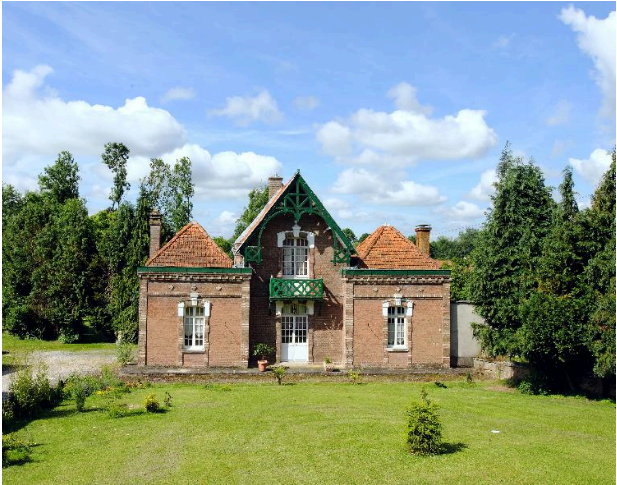
Ensemble sur rue, vue de face.

IVR22_20128000302NUC2A Auteur de l'illustration : Thierry Lefébure (c) Région Hauts-de-France - Inventaire général reproduction soumise à autorisation du titulaire des droits d'exploitation