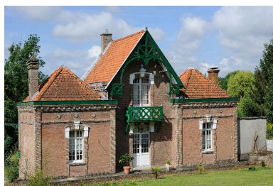
Façade sur rue, vue de trois-quarts. IVR22_20128000301NUC2A