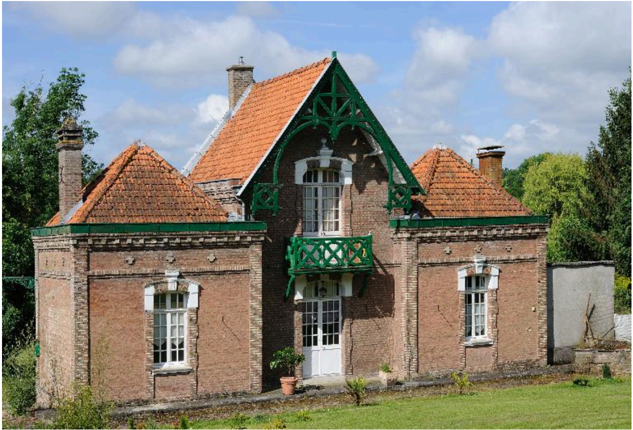
Façade sur rue, vue de trois-quarts.