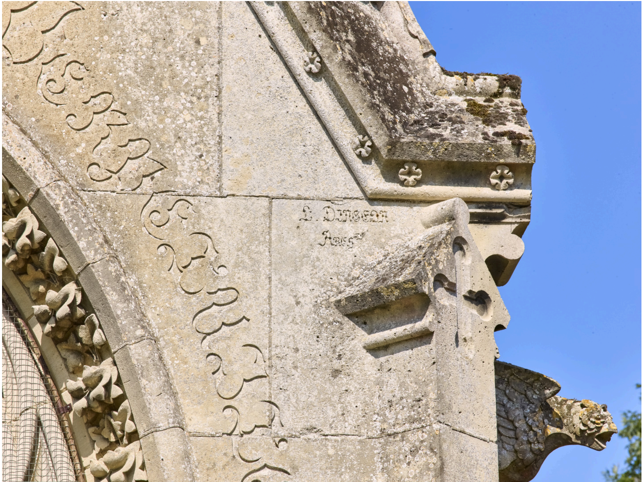
Signature de l'architecte de la chapelle funéraire, L. Dingeon.