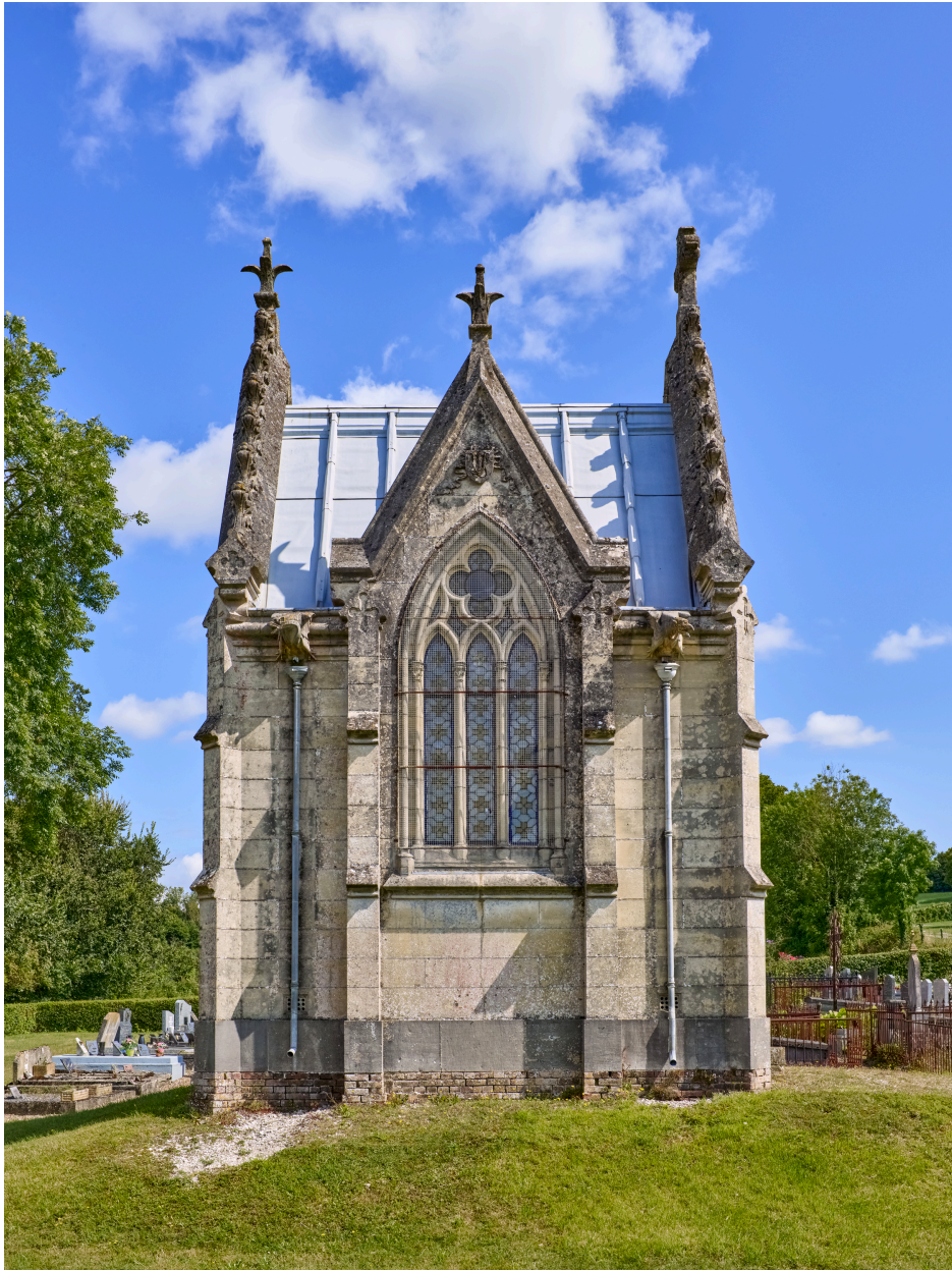
Élévation sud de la chapelle funéraire.