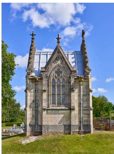
Élévation sud de la chapelle funéraire.