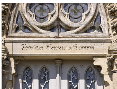
Détail de l'inscription sur le linteau, "famille Wignier de Beauré".