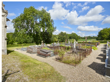
Partie nord du cimetière, depuis l'est.