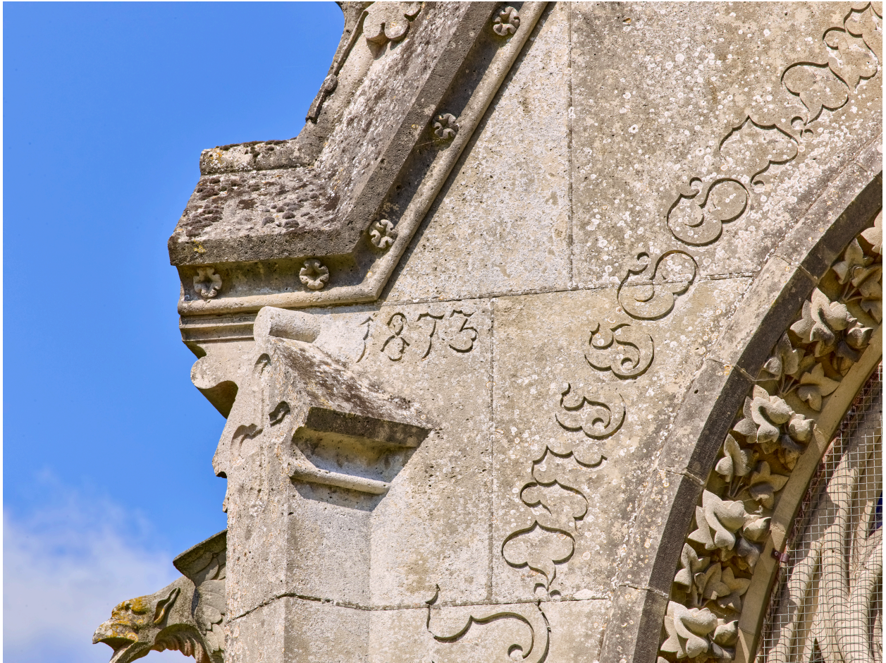
Date portée sur le chapelle funéraire, 1873.