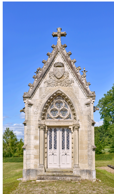
Élévation est de la chapelle funéraire. IVR32_20248001251NUCA