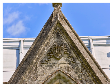
Détail des initiales sur le gable de la baie sud. IVR32_20248001270NUCA