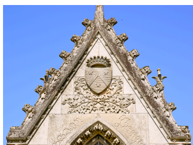
Détail de l'ornementation de l'élévation est.