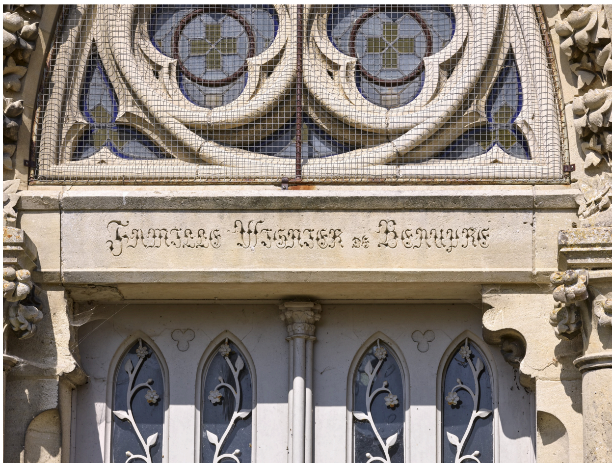
Détail de l'inscription sur le linteau, "famille Wignier de Beaupré".