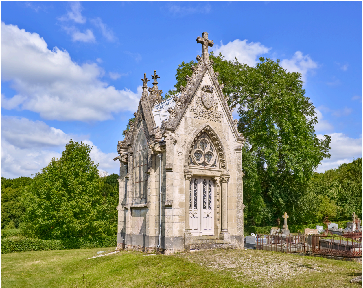
Vue de la chapelle funéraire sur son tertre, depuis le sud-est.