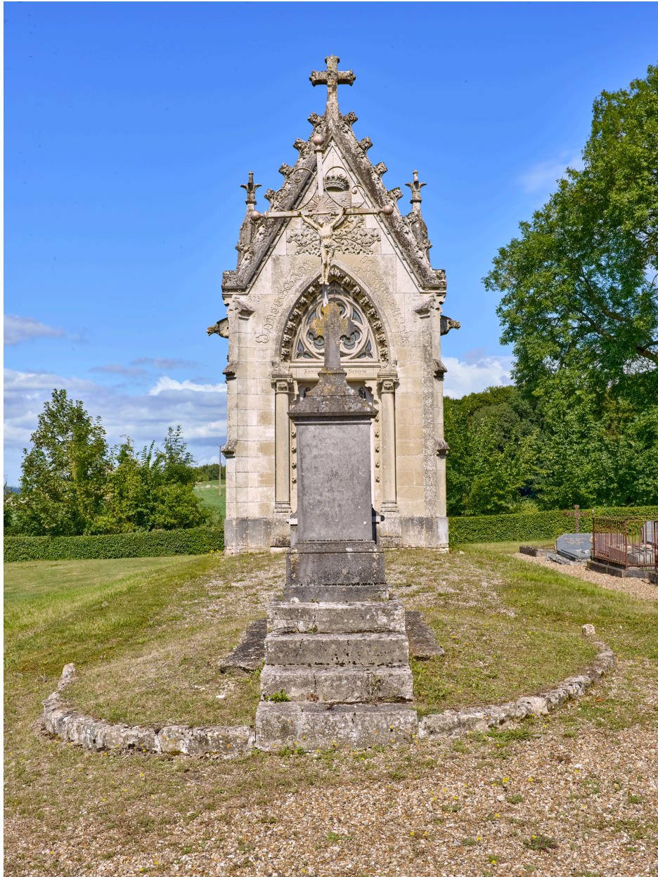
Tombe et croix de cimetière, depuis l'est. Chapelle en arrière-plan.