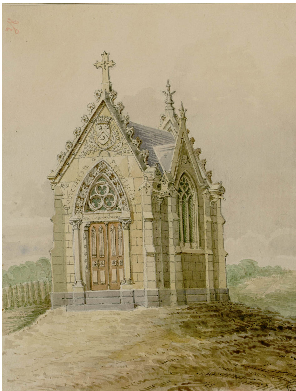
Chapelle sépulcrale de la famille Wignier de Beaupré dans le nouveau cimetière d'Épagne, par Oswald Macqueron, d'après nature, 13 avril 1875 (Archives et Bibliothèque patrimoniale d'Abbeville, Ab.M30).