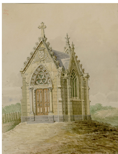
Chapelle sépulcrale de la famille Wignier de Beaupré dans le nouveau cimetière d'Épagne, par Oswald Macqueron, d'après nature, 13 avril 1875 (Archives et Bibliothèque patrimoniale d'Abbeville, Ab.M30).