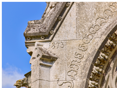
Date portée sur le chapelle funéraire, 1873. IVR32_20248001276NUCA