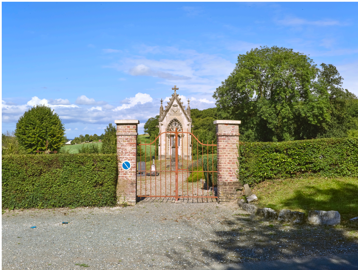
Entrée du cimetière, depuis l'est.