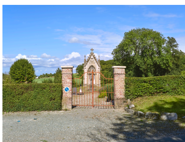
Entrée du cimetière, depuis l'est.