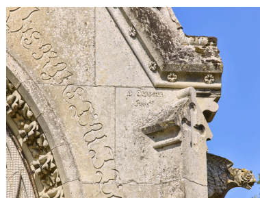
Signature de l'architecte de la chapelle funéraire, L. Digeon.