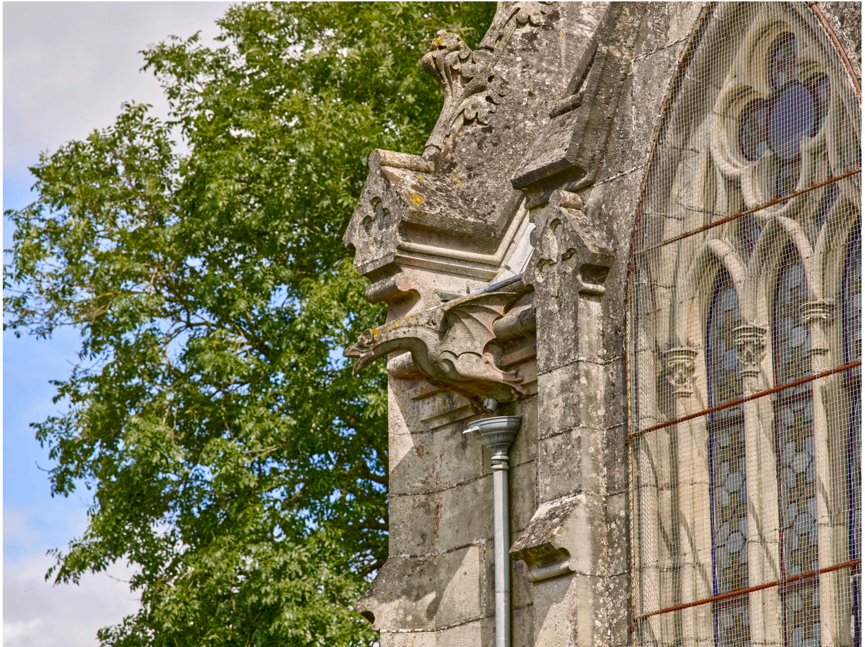
Détail d'une des gargouilles de la chapelle funéraire.