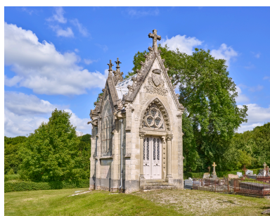
Vue de la chapelle funéraire sur son tertre, depuis le sud-est.