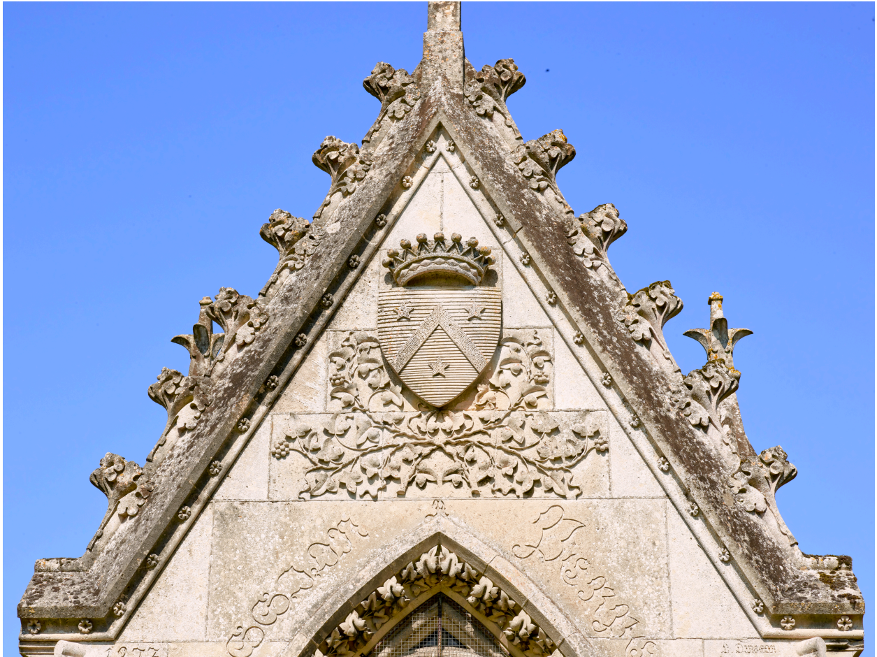
Détail de l'ornementation de l'élévation est.