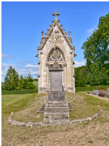
Tombe et croix de cimetière, depuis l'est. Chapelle en arrière-plan.