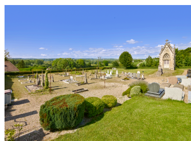
Vue de la partie sud du cimetière, depuis l'est. IVR32_20248001248NUCA