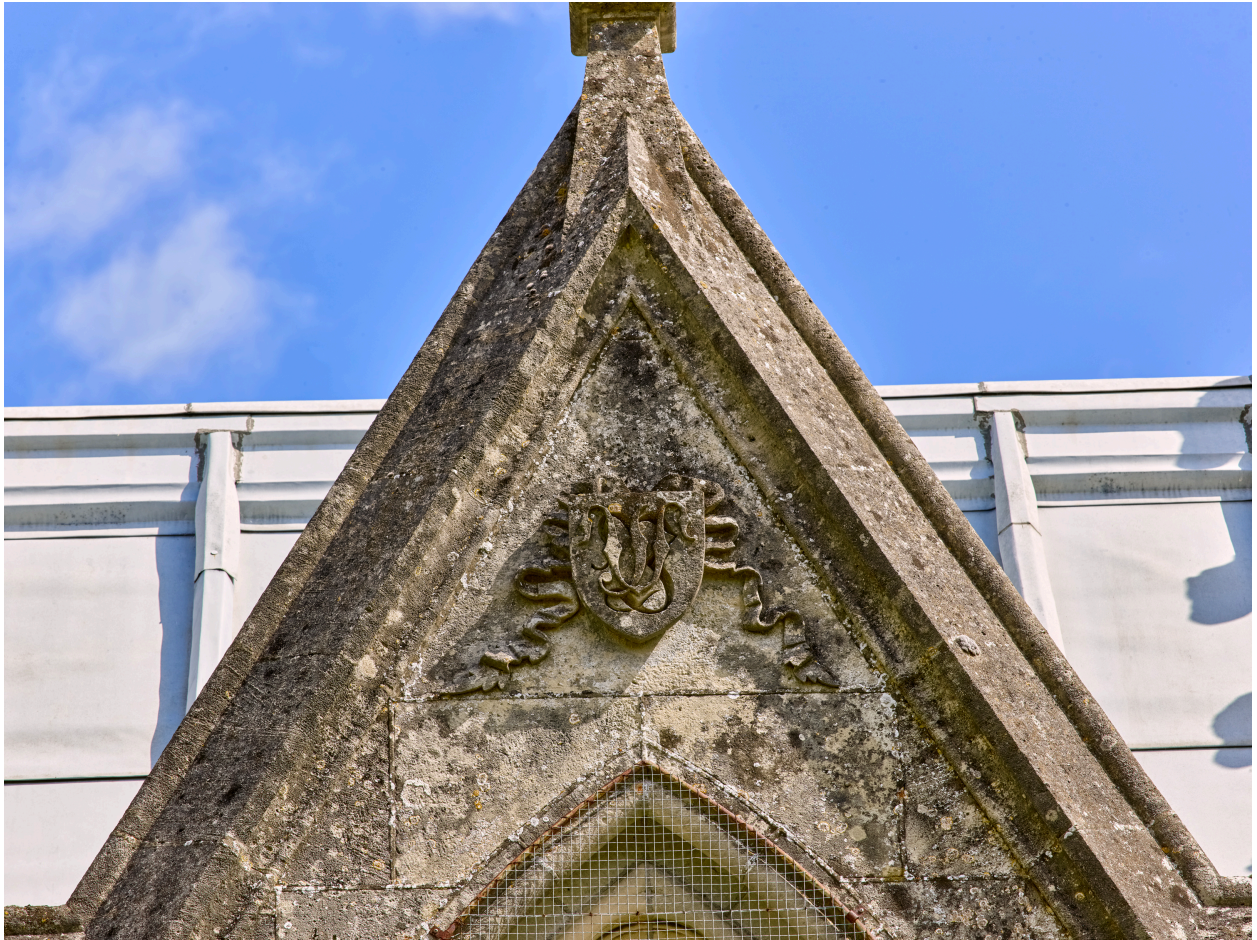
Détail des initiales sur le gable de la baie sud.