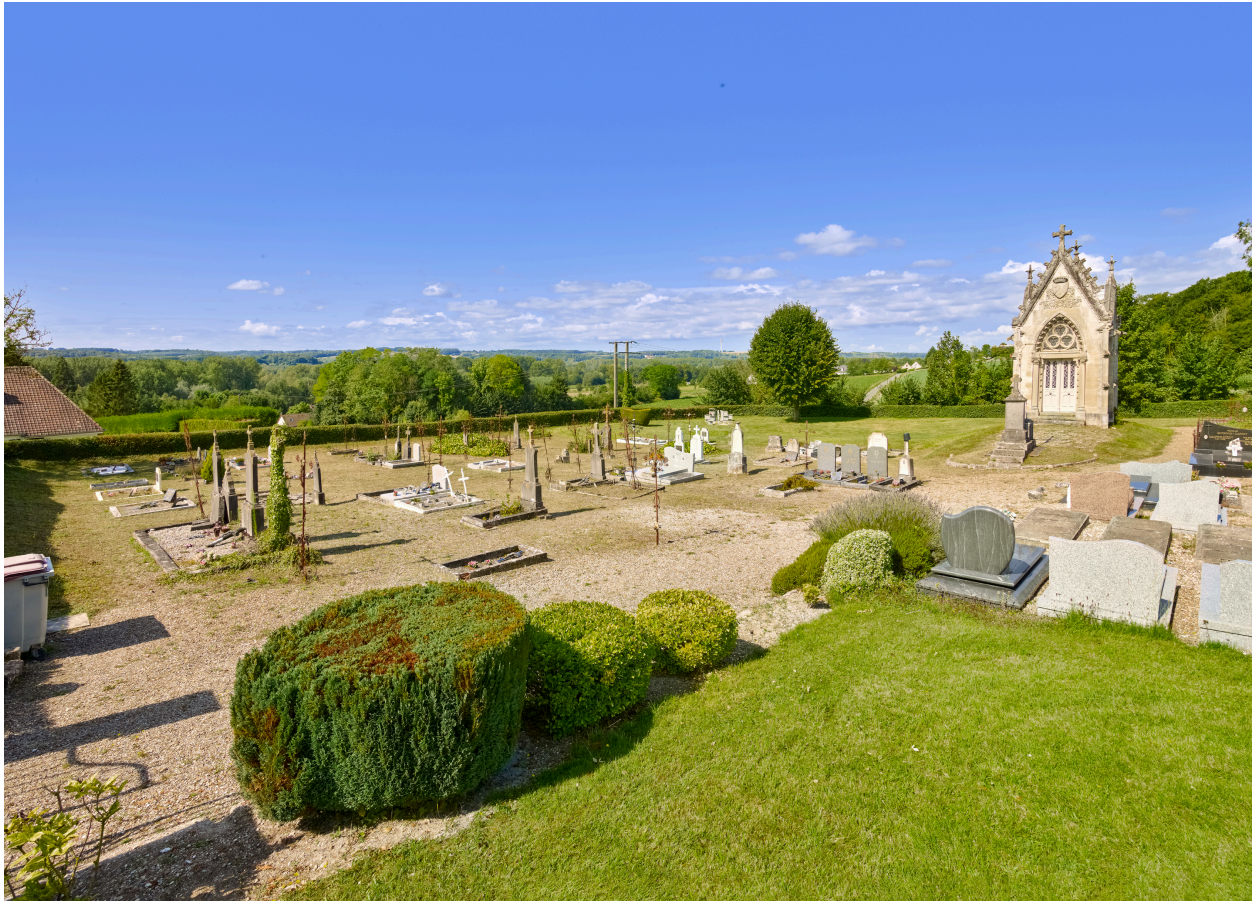
Vue de la partie sud du cimetière, depuis l'est.