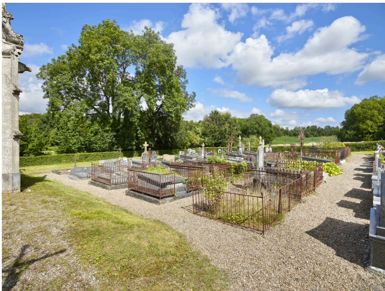
Partie nord du cimetière, depuis l'est.