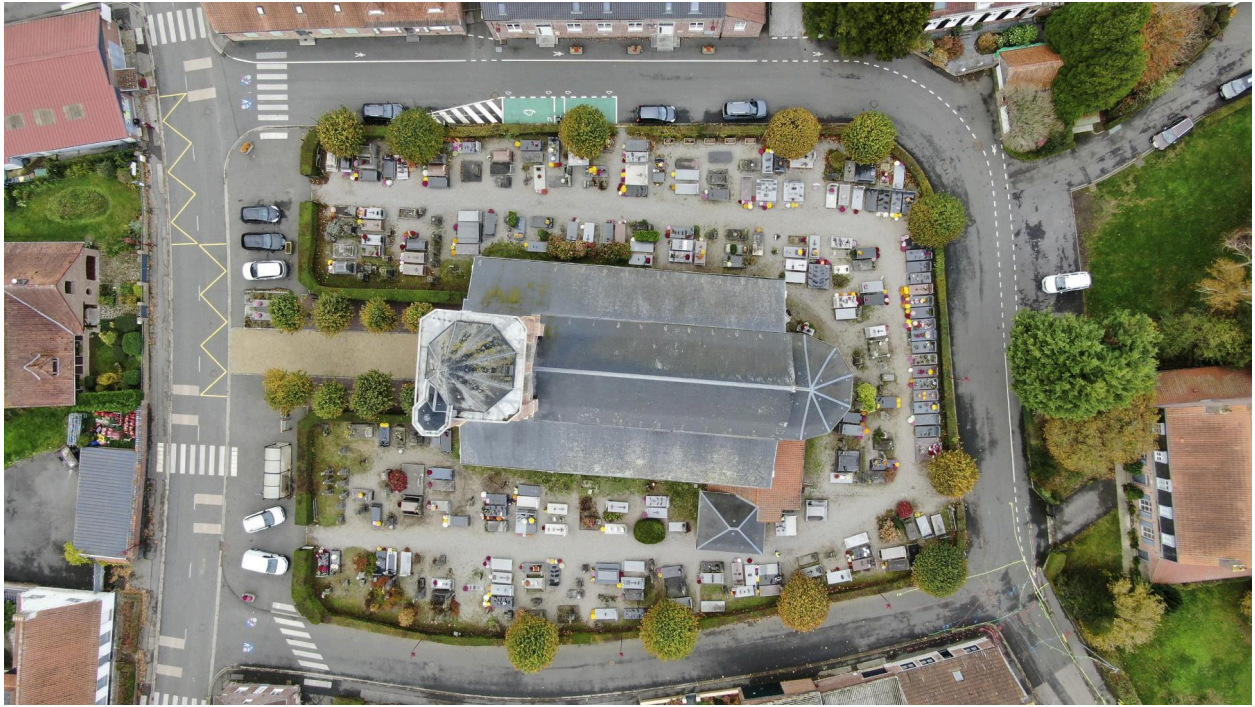
Vue zénithale du contour de l'église.