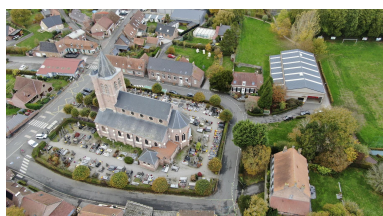
Vue aérienne du contour de l'église.