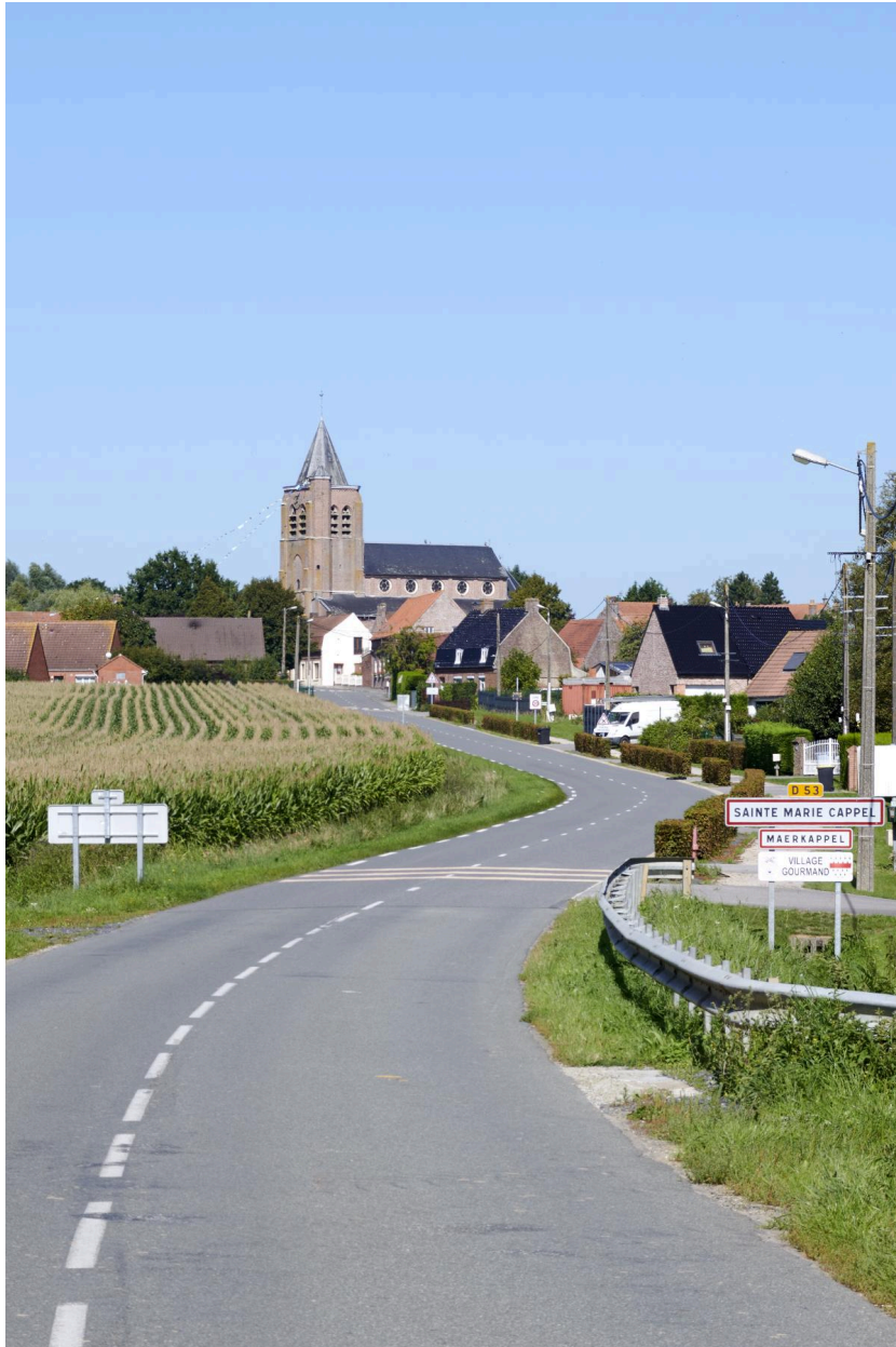
Église depuis le sud du village.