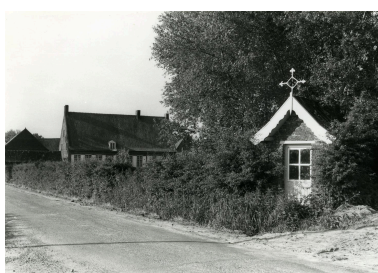
Ancienne chapelle de la patente, 1978.