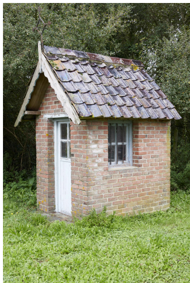
La nouvelle chapelle de la Patente.