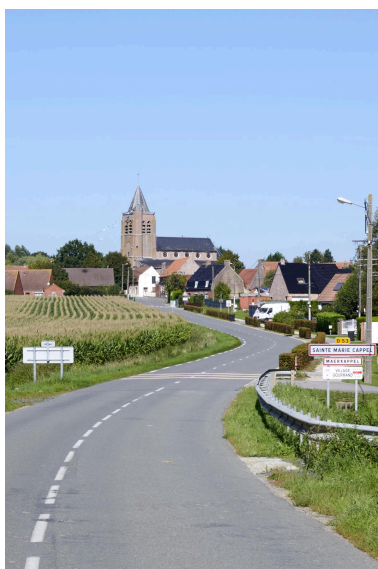
Église depuis le sud du village. IVR32_20235901246NUCA