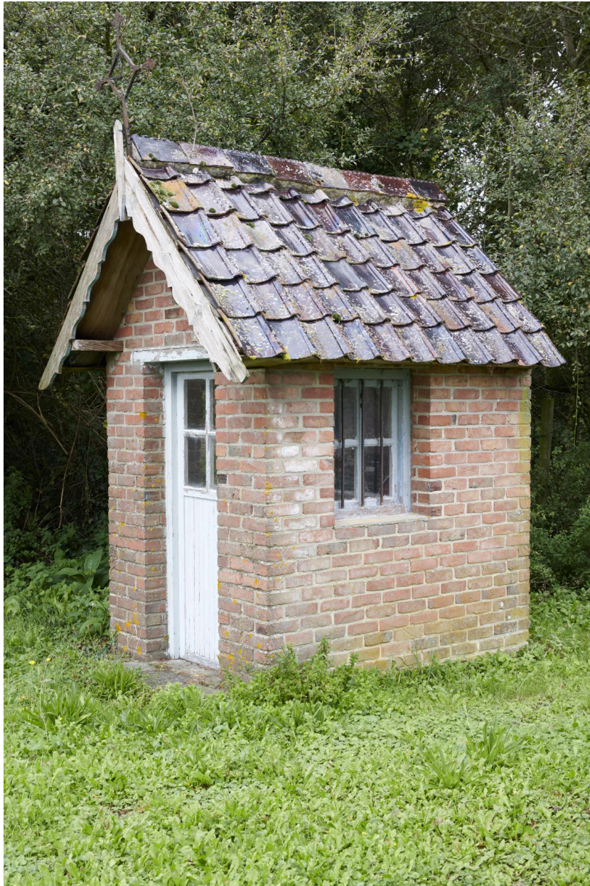
La nouvelle chapelle de la Patente.