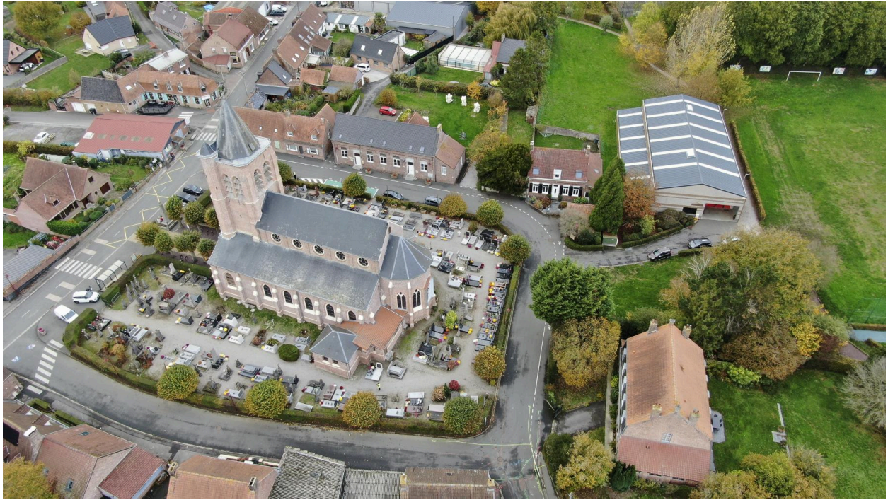
Vue aérienne du contour de l'église.