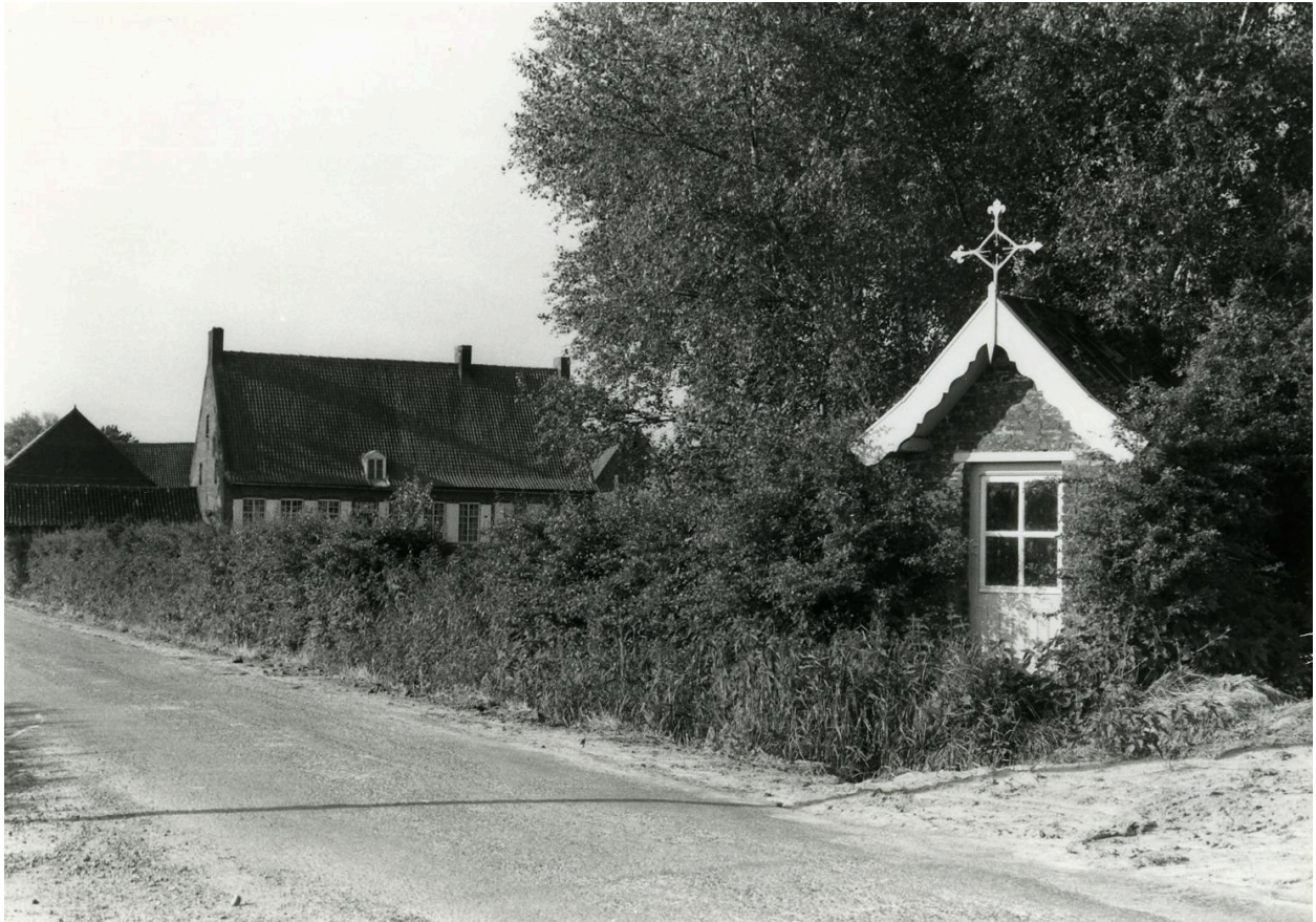
Ancienne chapelle de la patente, 1978 (coll. Comité flamand de France).