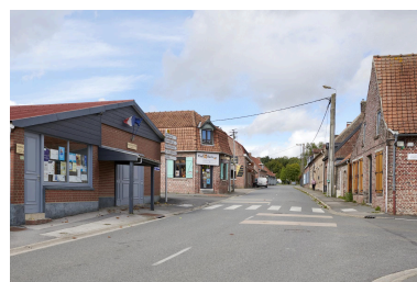
Depuis la place de l'église vers la route de Cassel au nord. IVR32_20245903297NUCA