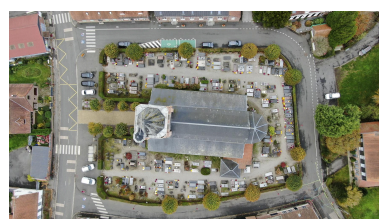
Vue zénithale du contour de l'église. IVR32_20245906704NUCA