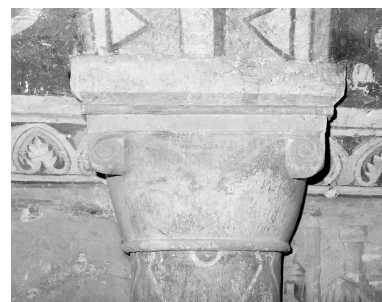
Chapiteau n° 10 du plan de situation.