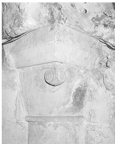
Chapiteau n° 3 du plan de situation.