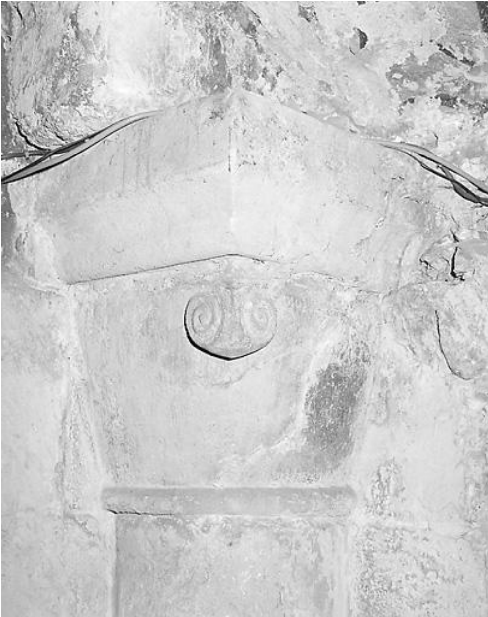
Chapiteau n° 3 du plan de situation.