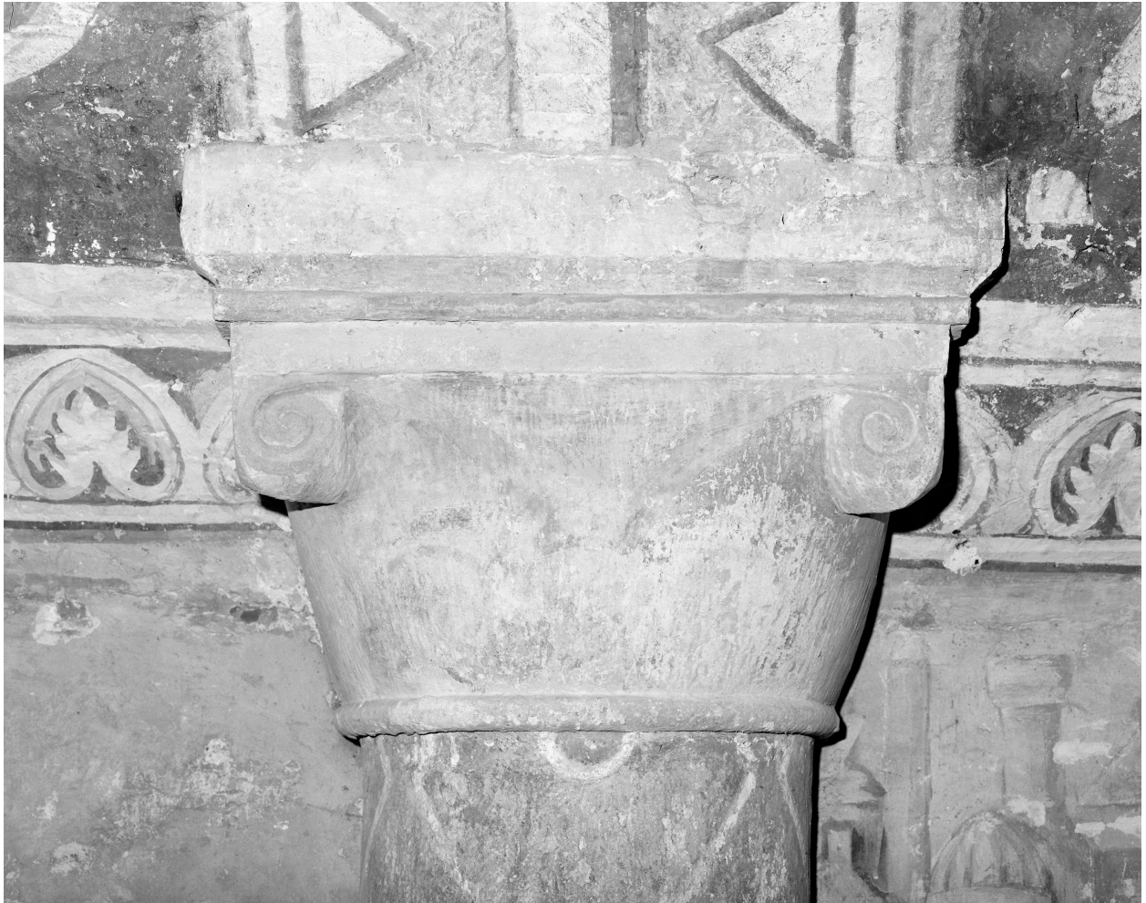
Chapiteau n° 10 du plan de situation.