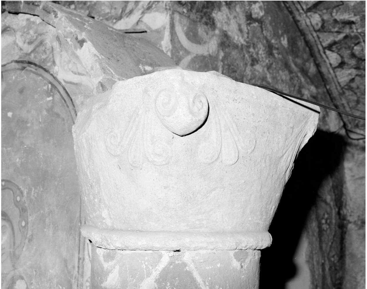
Chapiteau n° 13 du plan de situation.