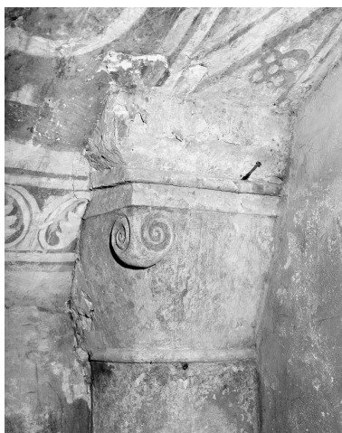
Chapiteau n° 9 du plan de situation.