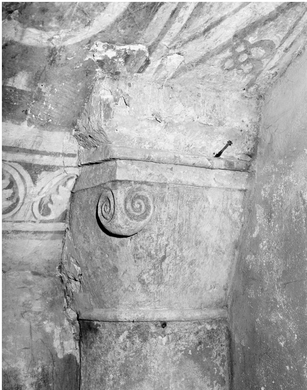
Chapiteau n° 9 du plan de situation.