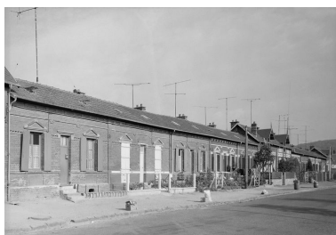
Vue générale. IVR22_19856001344X