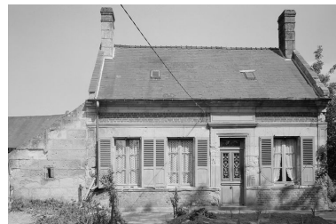
Logis. Elévation antérieure. IVR22_19856000893X