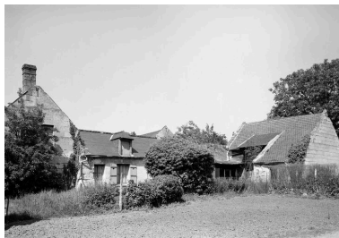
Vue générale. IVR22_19856000894X