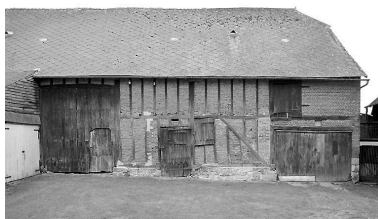
Grange.