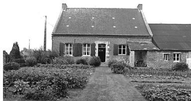
Elévation postérieure du logis, depuis l'est. IVR22_19980202434Z