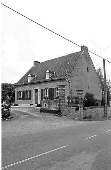
Logis depuis le nord-est. IVR22_19980202410Z

IVR22_20080290079NUCA