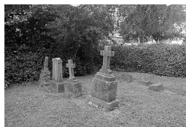
Cimetière irvingien.