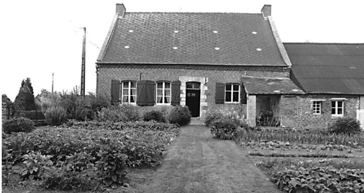
Elévation postérieure du logis, depuis l'est.