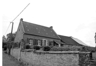
Élévation postérieure du logis depuis le nord-ouest. IVR22_19980202412Z