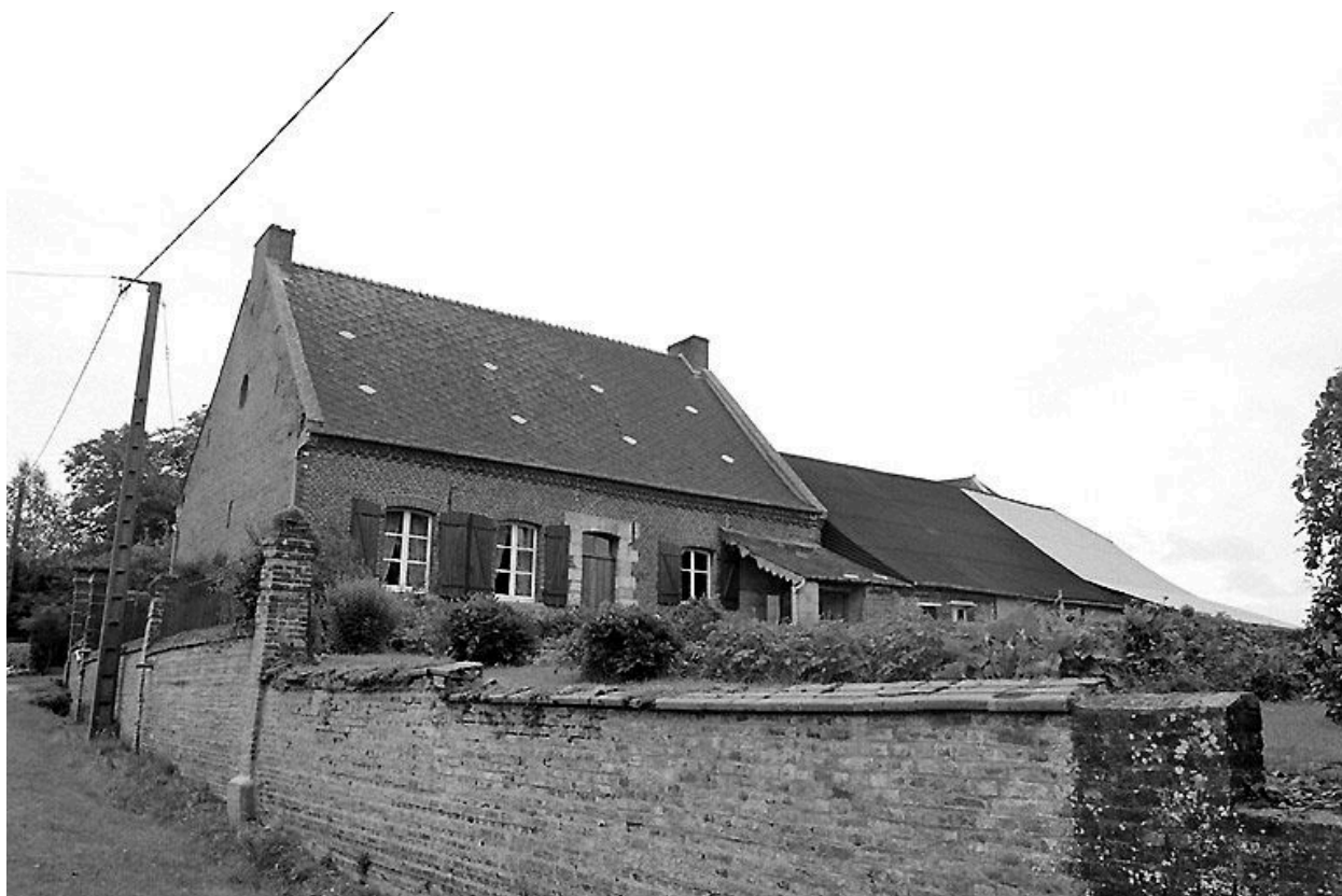
Elévation postérieure du logis depuis le nord-ouest.