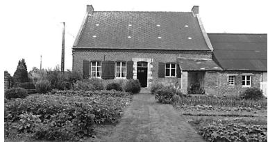
Elévation postérieure du logis, depuis l'est. IVR22_19980202434Z