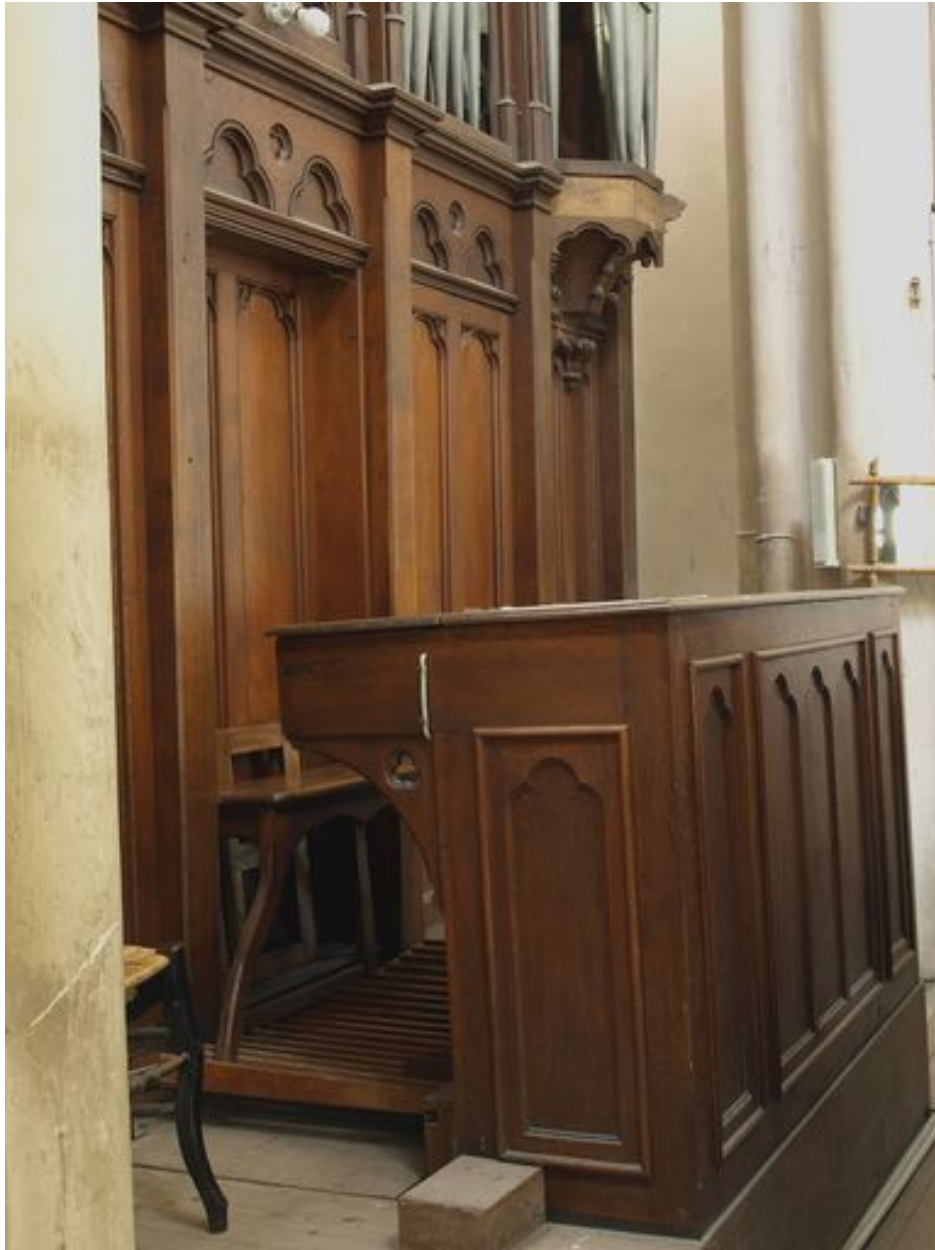
Console tournée vers le chœur