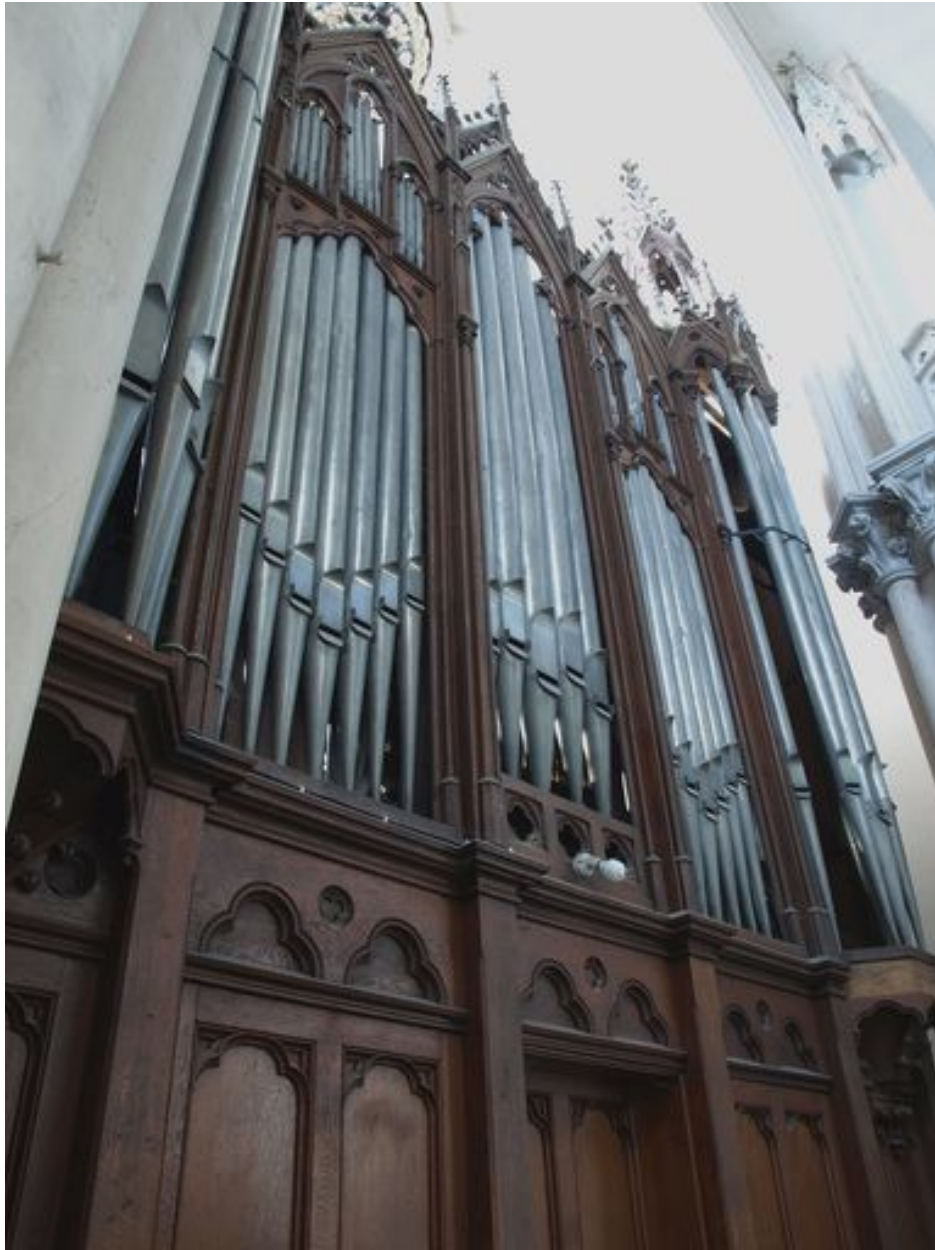
Vue générale à partir de la tribune