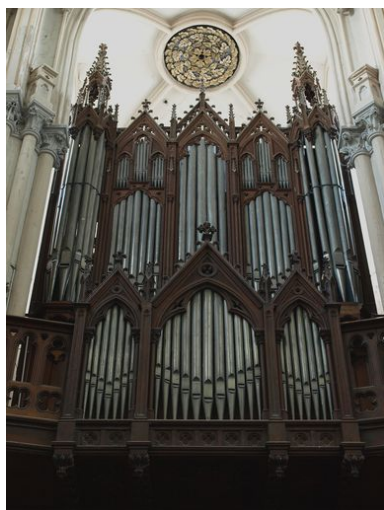
Vue générale IVR31_20106202643NUCA