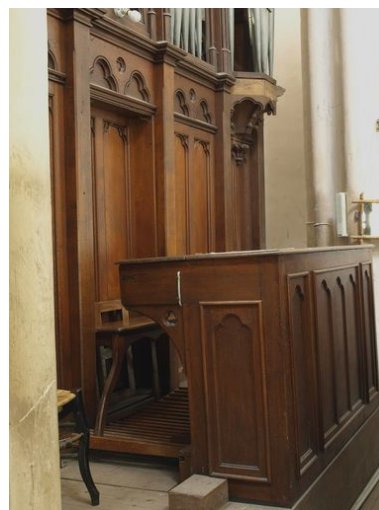
Console tournée vers le chœur IVR31_20106202645NUCA