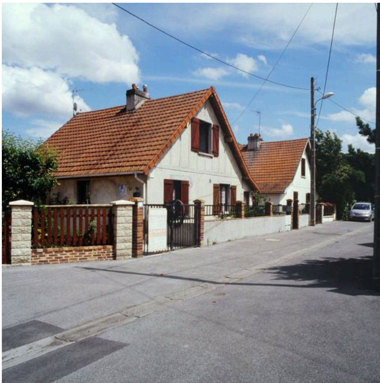
Maisons de la cité ouvrière.