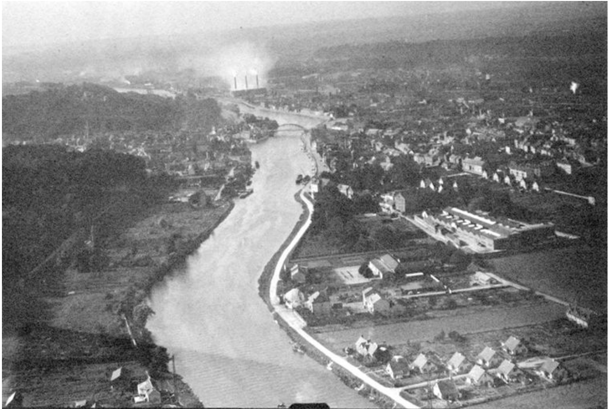
Vue aérienne de la cité de la Tonnellerie et des environs, entre 1923 et 1940.