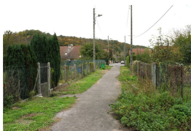
Chemin menant aux jardins ouvriers de la cité de la Tonnellerie et au fond les maisons de la cité.