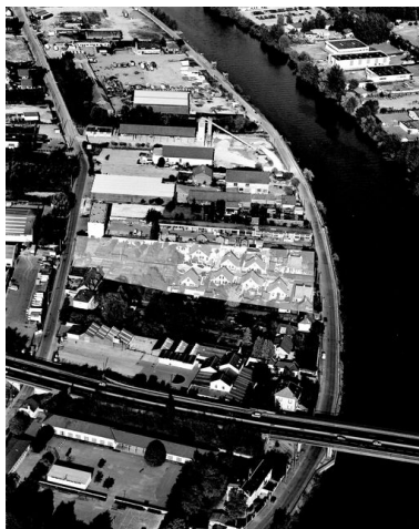
Vue aérienne de la cité de la Tonnellerie et de ses jardins en 1995.