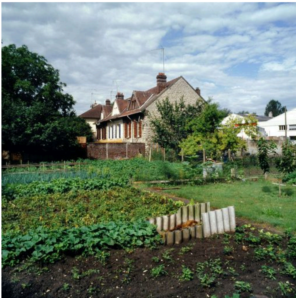
Jardins ouvriers de la cité.