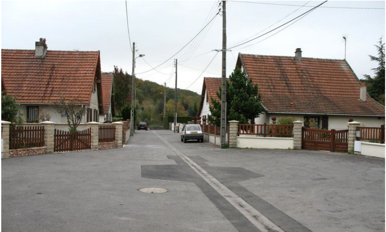
Cité de la Tonnellerie.