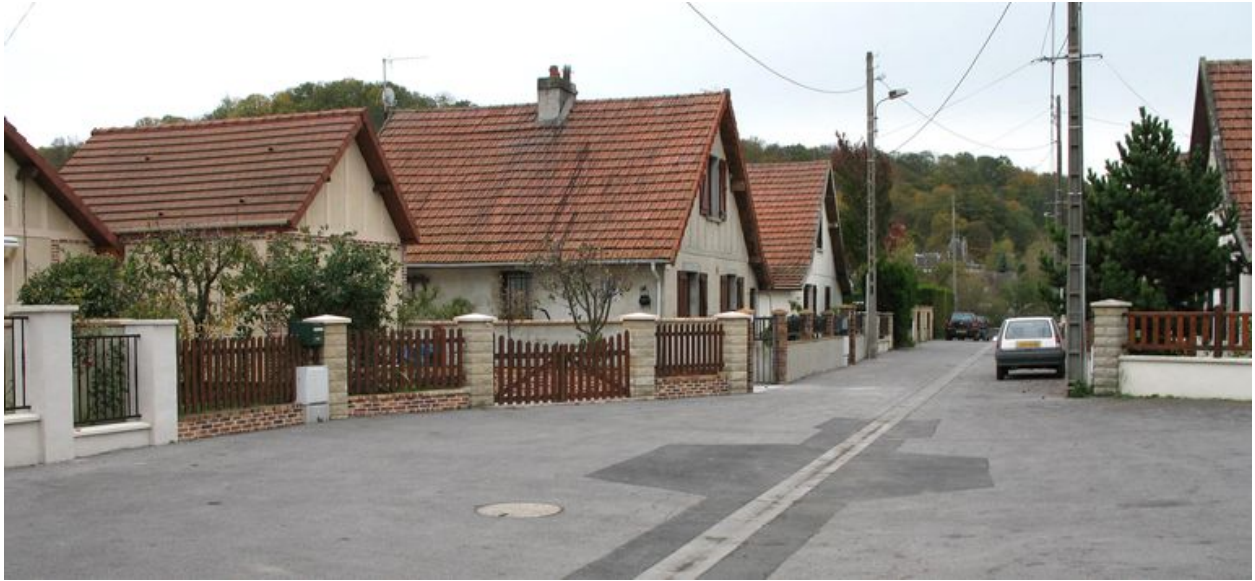
Cité de la Tonnellerie.