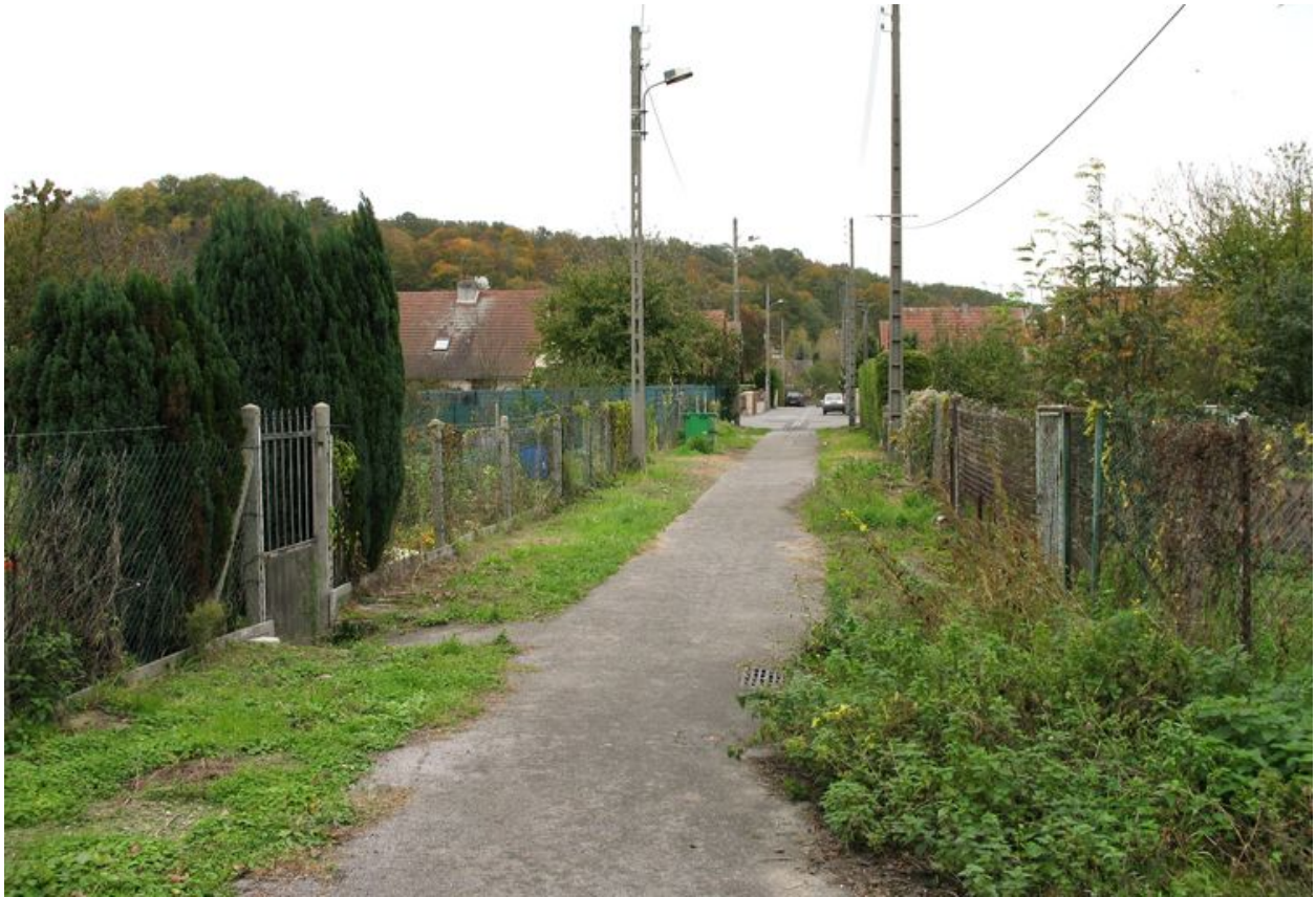
Chemin menant aux jardins ouvriers de la cité de la Tonnellerie et au fond les maisons de la cité.