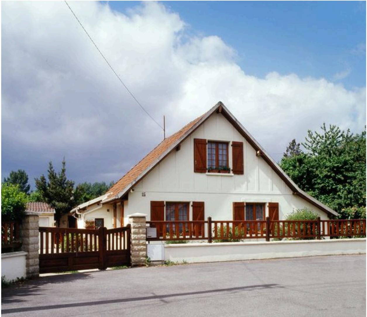
Maison de la cité de la Tonnellerie