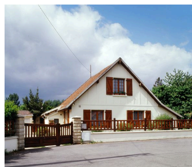
Maison de la cité de la Tonnellerie