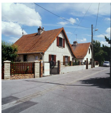
Maisons de la cité ouvrière. IVR22_20076000038XA