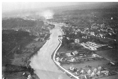
Vue aérienne de la cité de la Tonnellerie et des environs, entre 1923 et 1940 (archives d'entreprise). IVR22_20086005011NUCAB