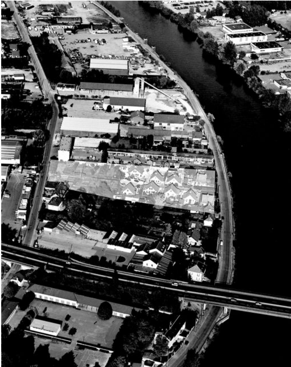
Vue aérienne de la cité de la Tonnellerie et de ses jardins en 1995.