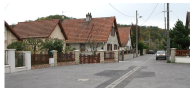
Cité de la Tonnellerie. IVR22_20076005011NUCA