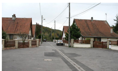
Cité de la Tonnellerie.