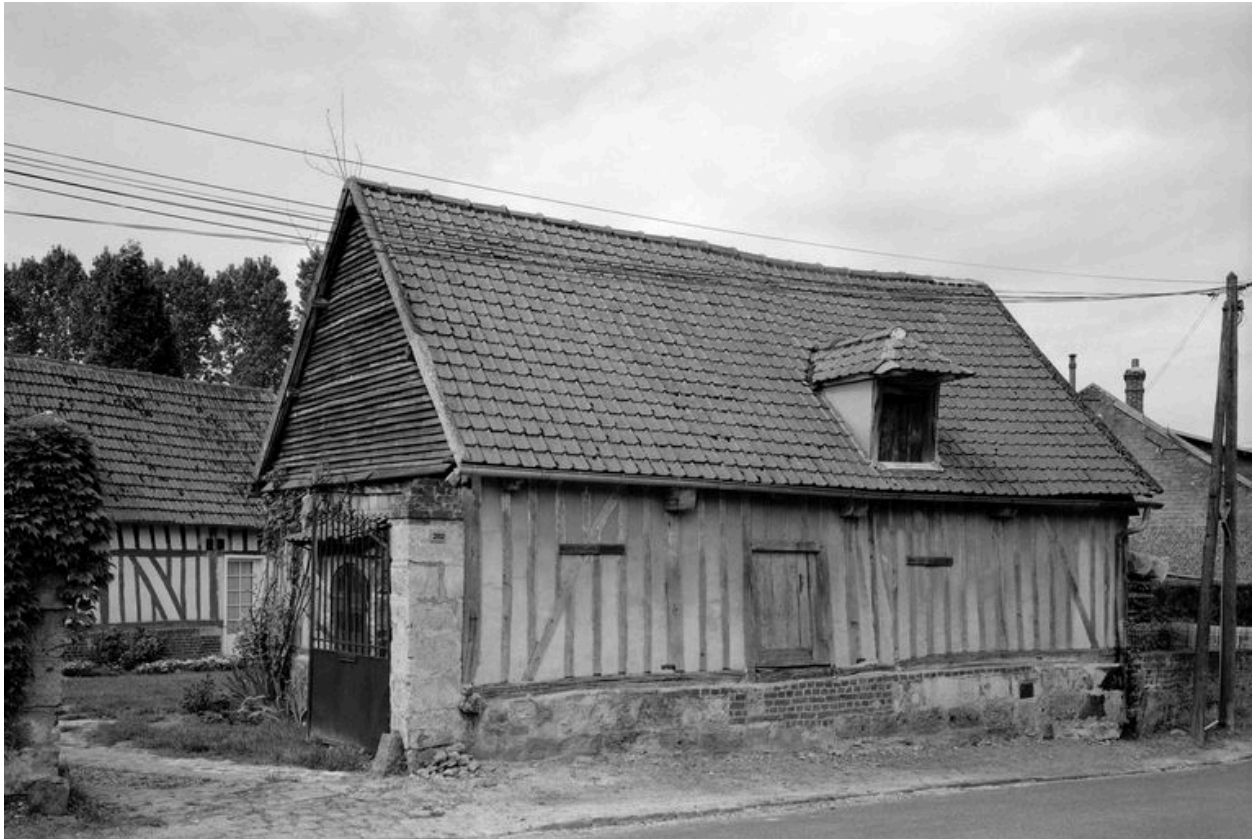
Grange. Elévation sur rue.