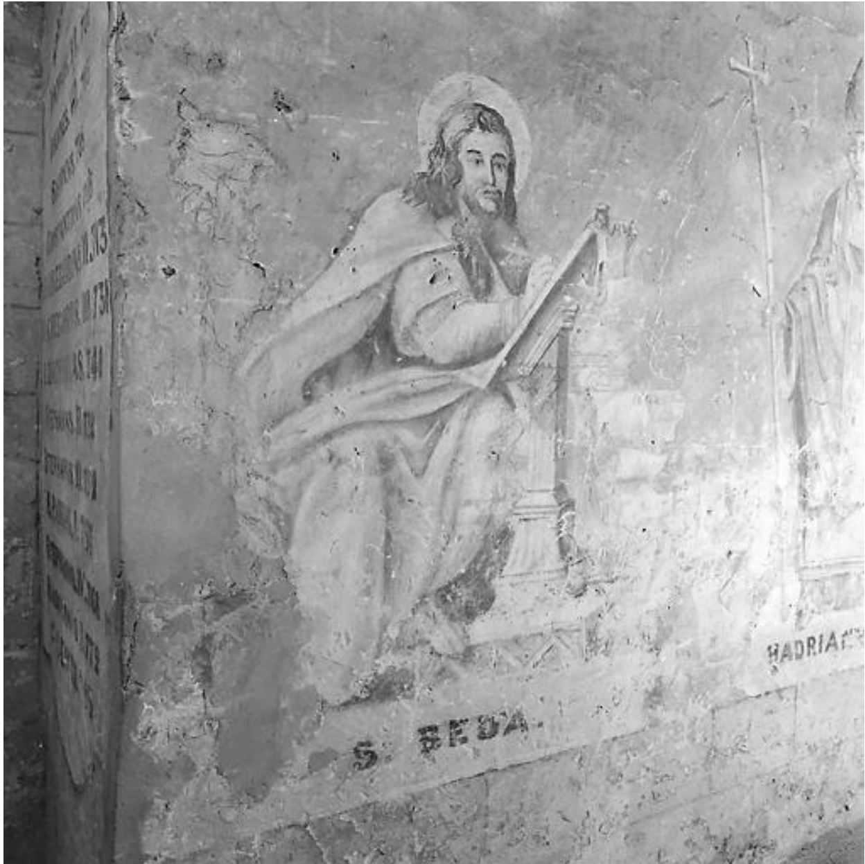
Bede le vénérable, vue générale.