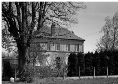
Elévation antérieure. IVR22_19856000572X