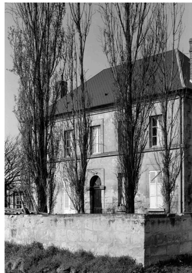
Elévation postérieure. IVR22_19856000573X