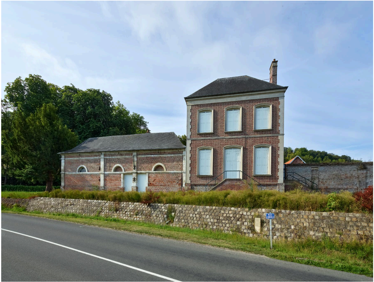
Élévation nord de la ferme jourdain.