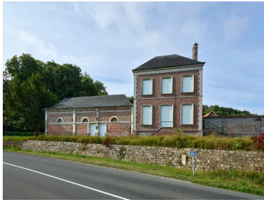
Élévation nord de la ferme jourdain.

Allée conduisant à la ferme, vue prise depuis l'est.