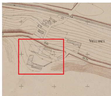
Destruction de la ferme Jourdain, fond de plan topographie, Fontaine-sur-Somme, Commissariat à la Reconstruction Immobilière, feuille 2, 1942 (AD Somme ; 70W CP 39 3, ZH323).