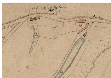
Plan de la ferme Jourdain, extrait du plan parcellaire cadastral, dit plan napoléonien, section C1, 1833 (AD Somme ; 3 P 13535).

Repro. Archives départementales de la Somme IVR32_20238005310NUCA