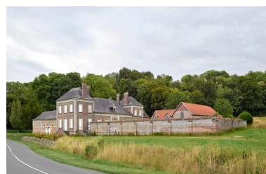
Vue générale de la ferme Jourdain, prise depuis le nord-ouest.