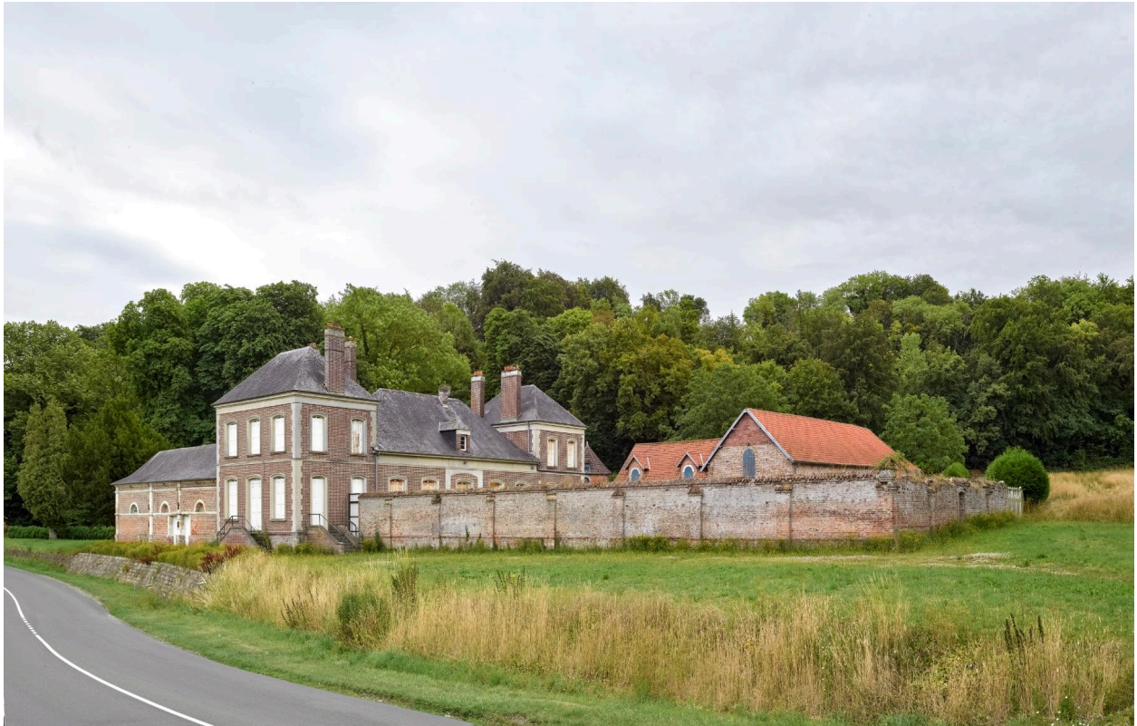
Vue générale de la ferme Jourdain, prise depuis le nord-ouest.