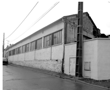
Façade nord de l'usine donnant sur la rue. IVR22_19986000110X