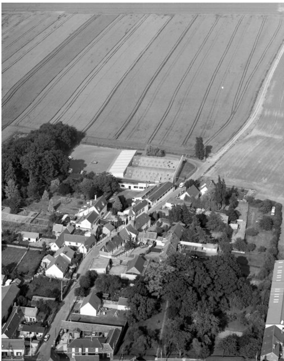
Vue aérienne de l'usine en 1994.