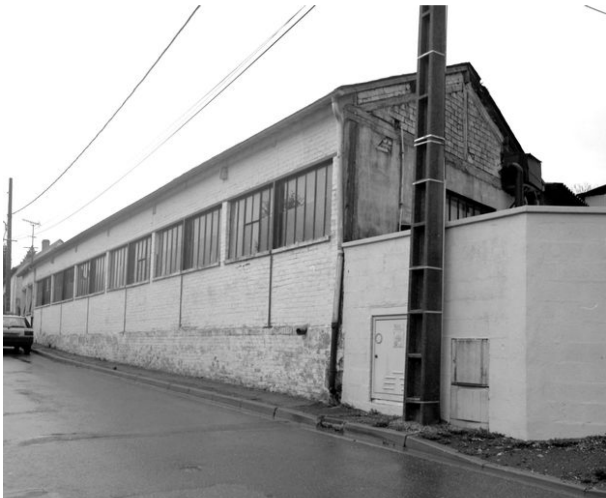
Façade nord de l'usine donnant sur la rue.