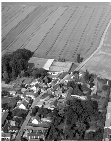
Vue aérienne de l'usine en 1994. IVR22_19946001509X