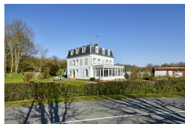
Demeure, vue du sud, depuis la rue.