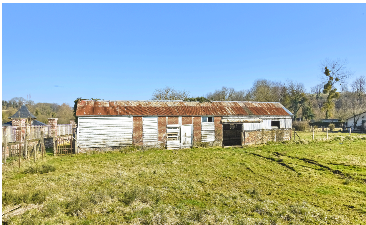
Vue de l'ancien édifice agricole (bergerie ?).