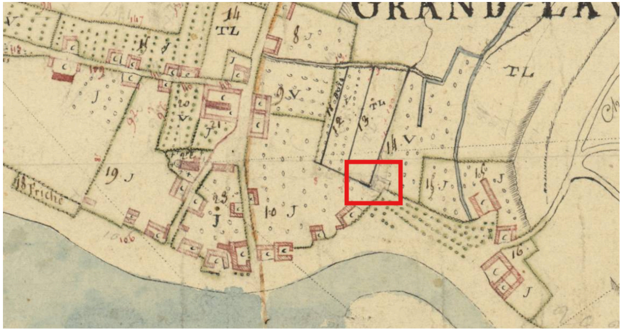
Extrait du plan par masses de cultures, 1807 (AD Somme, 3 P 1014).