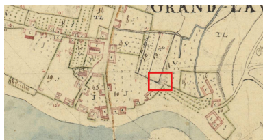
Extrait du plan par masses de cultures, 1807 (AD Somme, 3 P 1014).