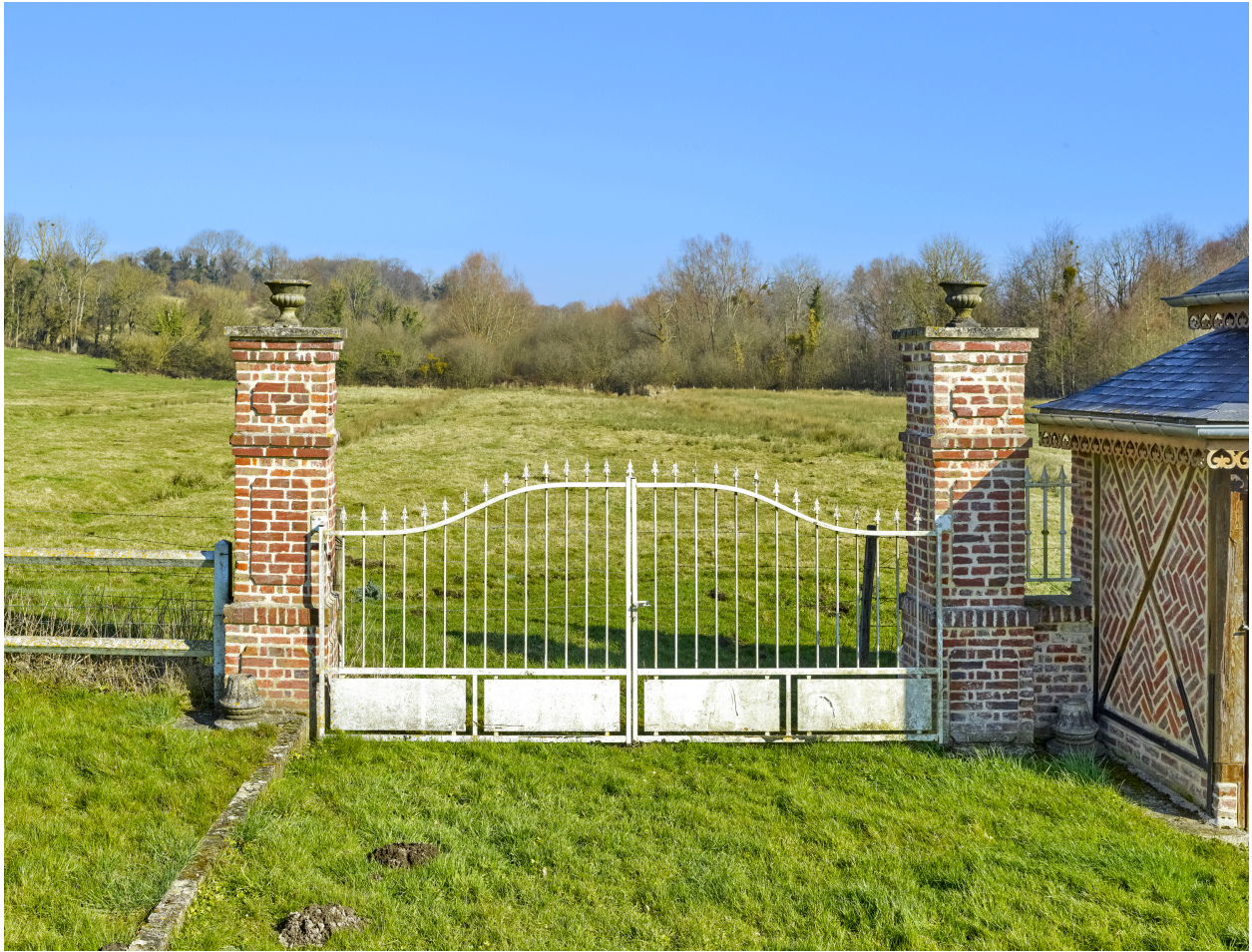
Portail d'accès vers les pâtures.