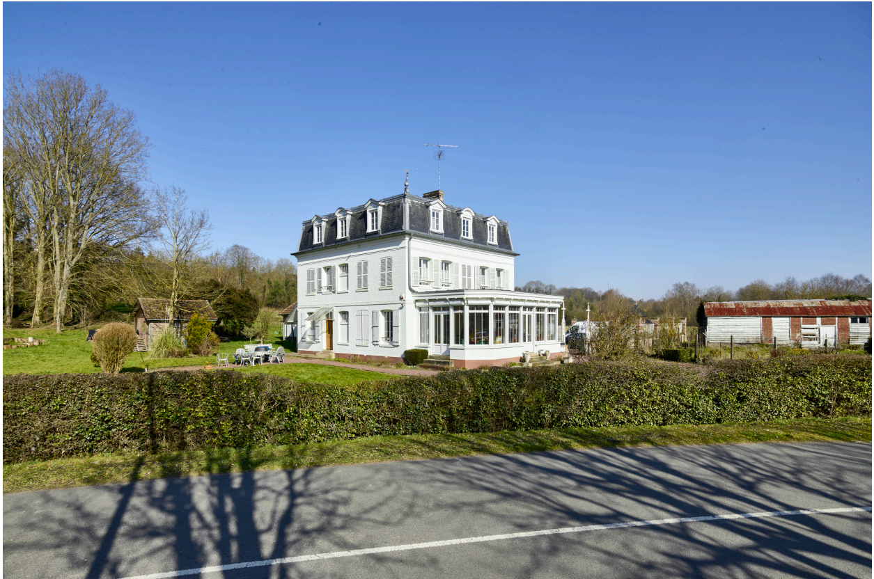
Demeure, vue du sud, depuis la rue.