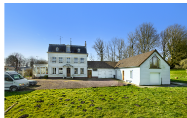
Vue de la demeure et de l'ancienne étable. IVR32_20258000116NUCA