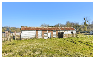
Vue de l'ancien édifice agricole (bergerie ?).