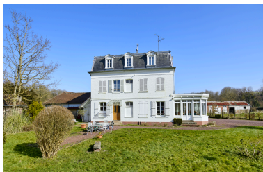
Vue de la demeure, depuis le sud-ouest. IVR32_20258000113NUCA