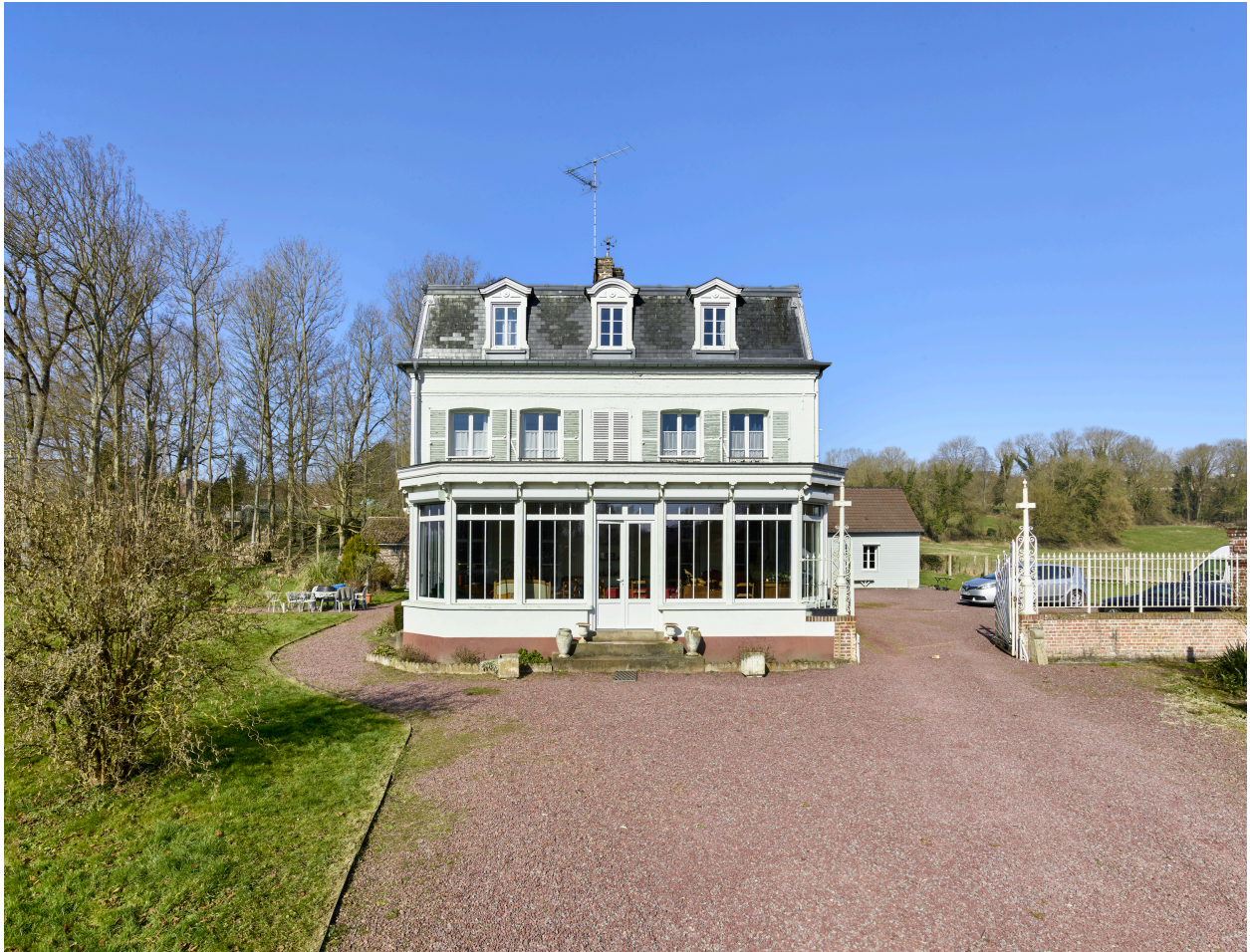
Vue de la véranda, depuis le sud-est.