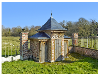
Vue de la remise, depuis le sud. IVR32_20258000117NUCA