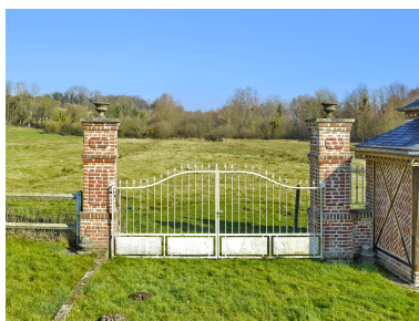
Portail d'accès vers les pâtures. IVR32_20258000118NUCA