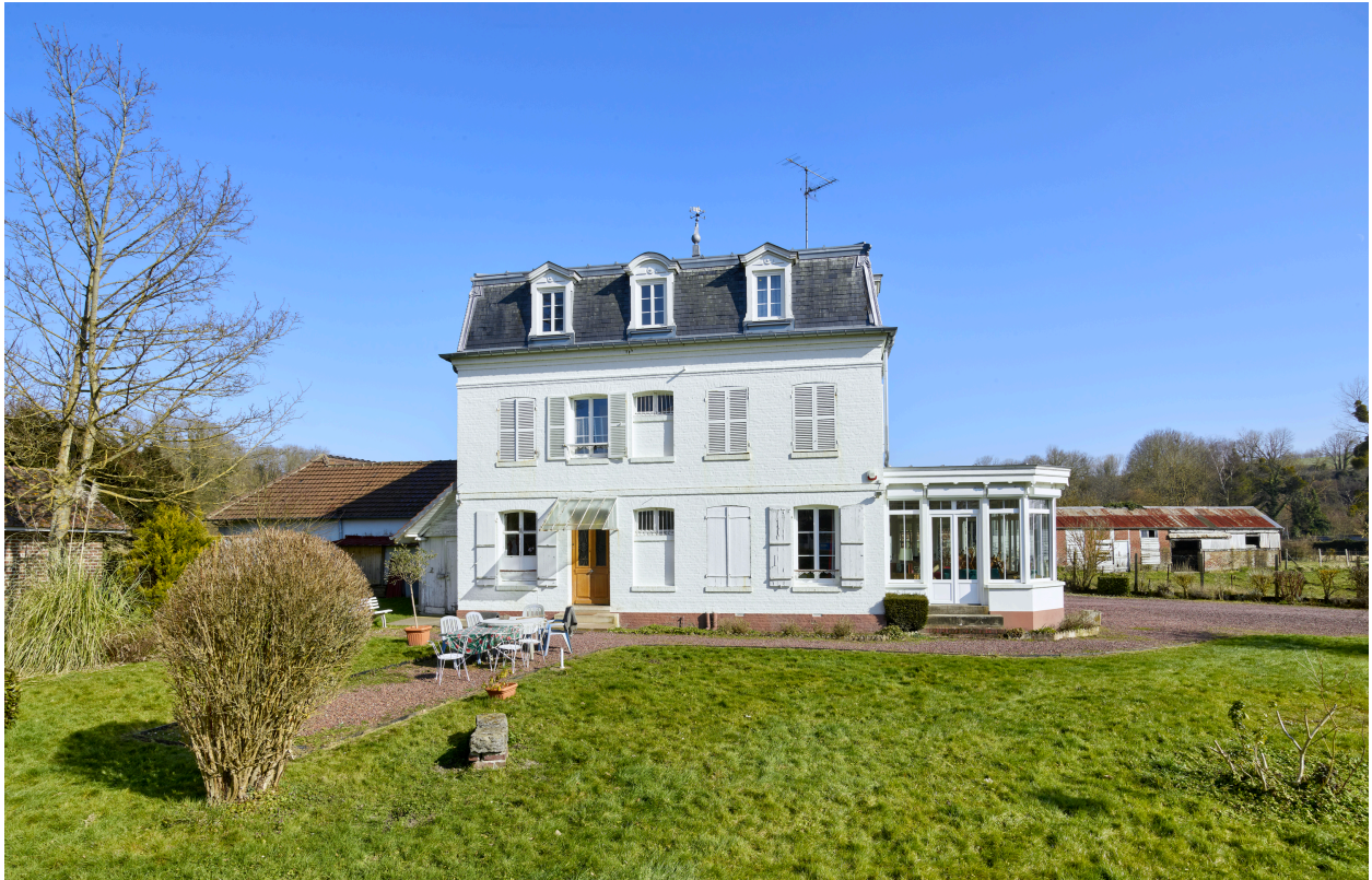
Vue de la demeure, depuis le sud-ouest.