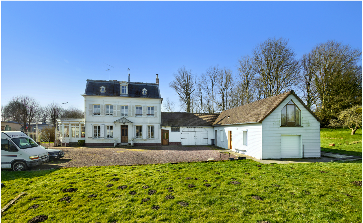
Vue de la demeure et de l'ancienne étable.