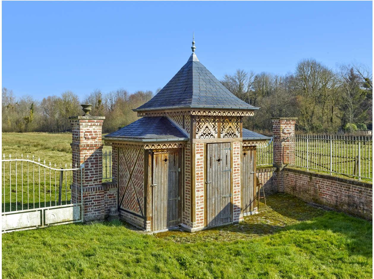
Vue de la remise, depuis le sud.