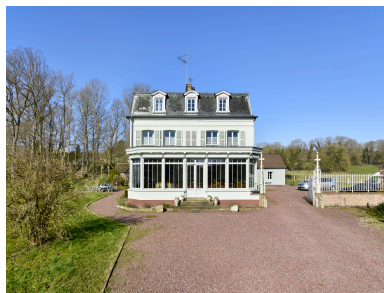
Vue de la véranda, depuis le sud-est.