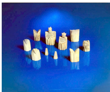
Vue générale. IVR22_19876000289XA