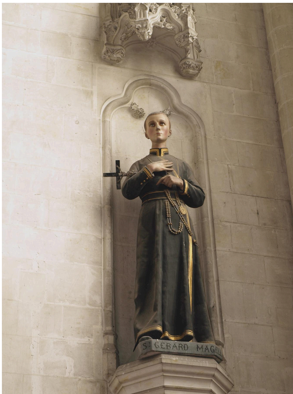
Vue générale, saint Gérard Majella.