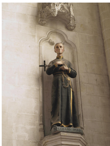
Vue générale, saint Gérard Majella. IVR31_20106207781NUCA