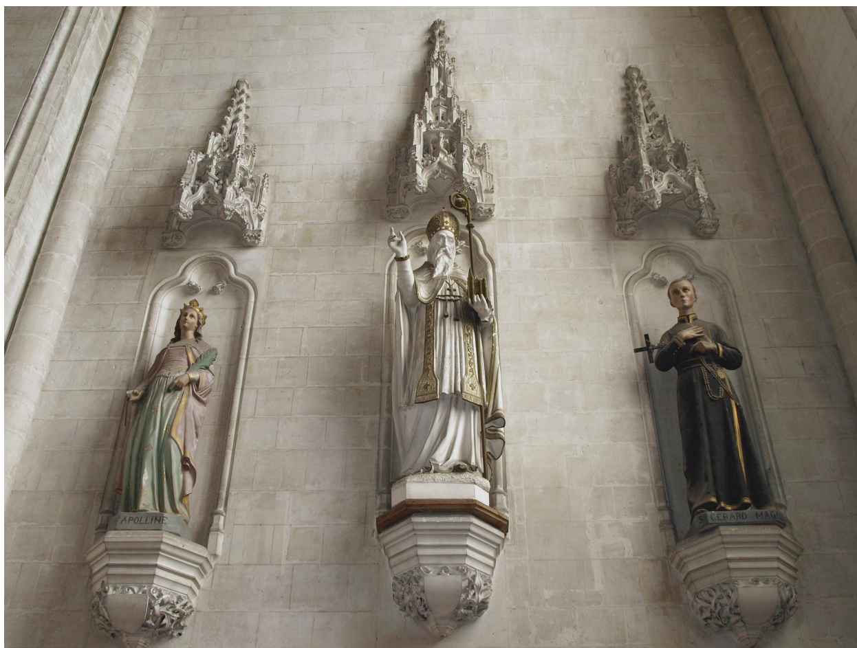
Vue générale d'ensemble.