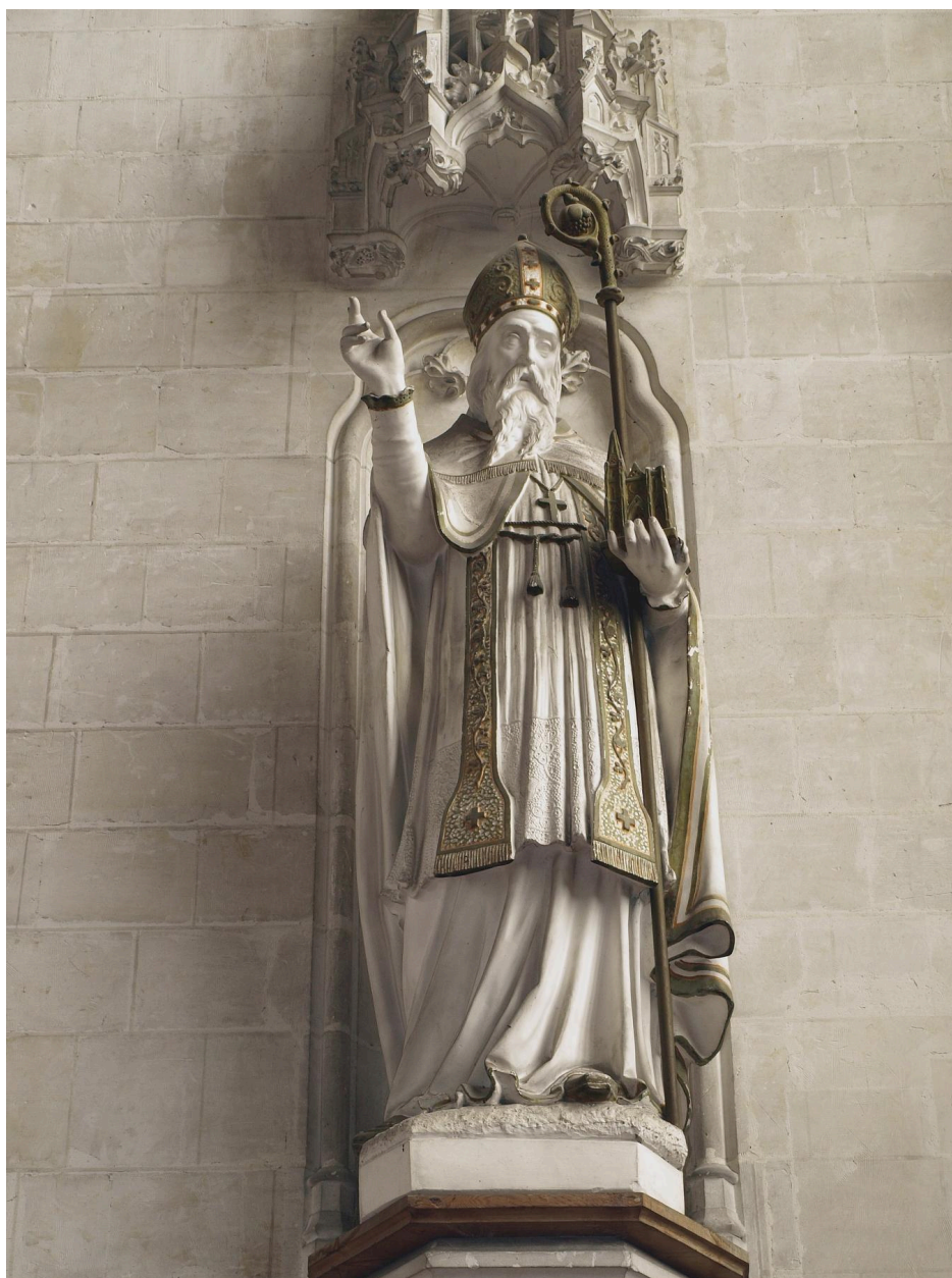
Vue générale, saint Omer.