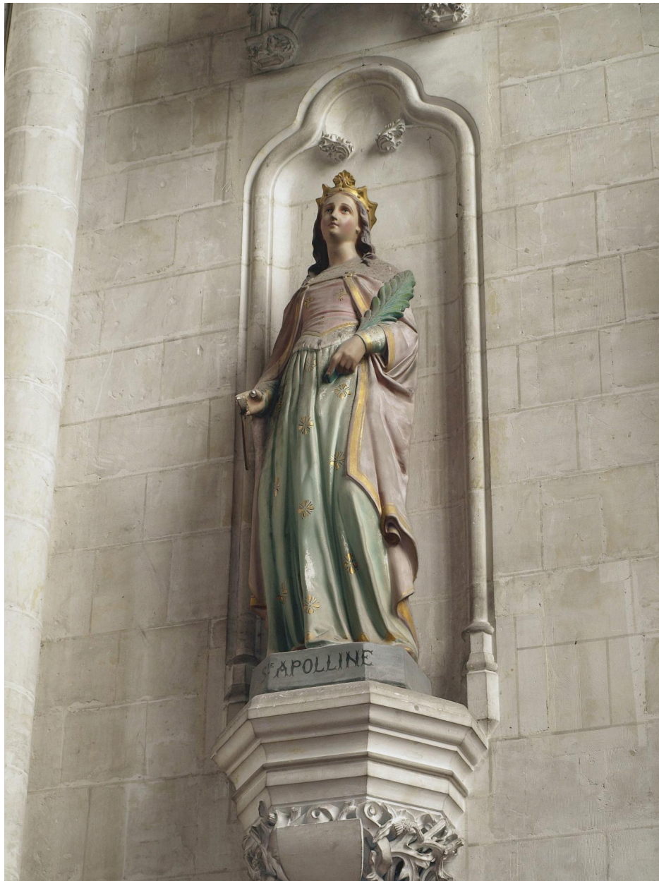
Vue générale, sainte Apolline.