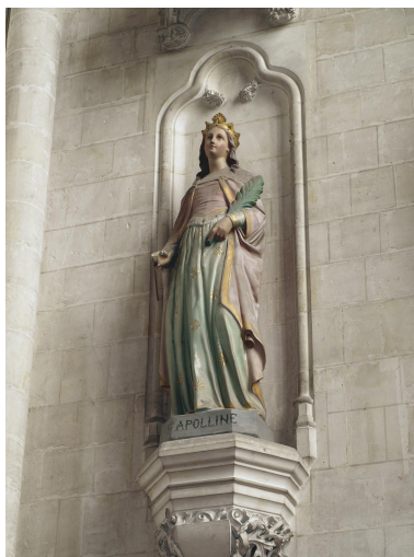
Vue générale, sainte Apolline. IVR31_20106207779NUCA