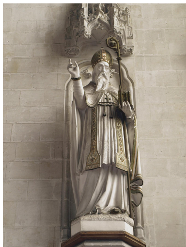
Vue générale, saint Omer. IVR31_20106207780NUCA