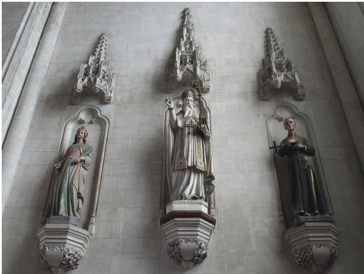
Vue générale d'ensemble.