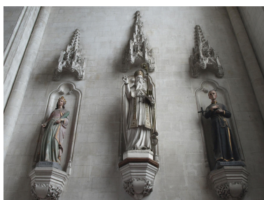
Vue générale d'ensemble. IVR31_20106207777NUCA