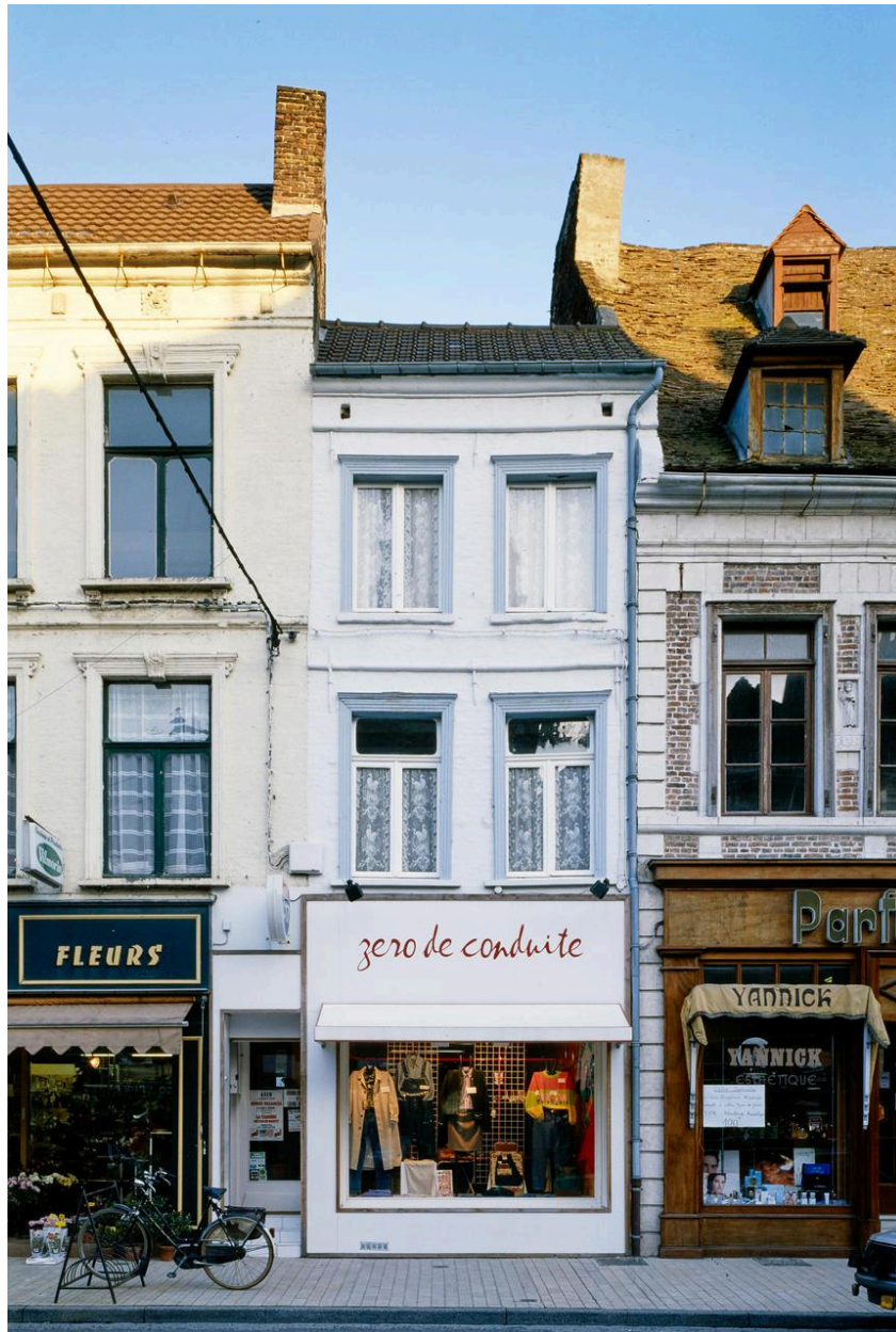
Vue générale de la façade en front de rue.