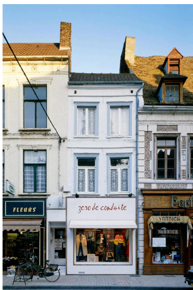
Vue générale de la façade en front de rue. IVR31_19886200058XA