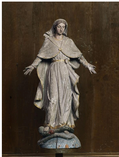
Statue : L'Immaculée Conception. IVR22_20158000148NUC2A