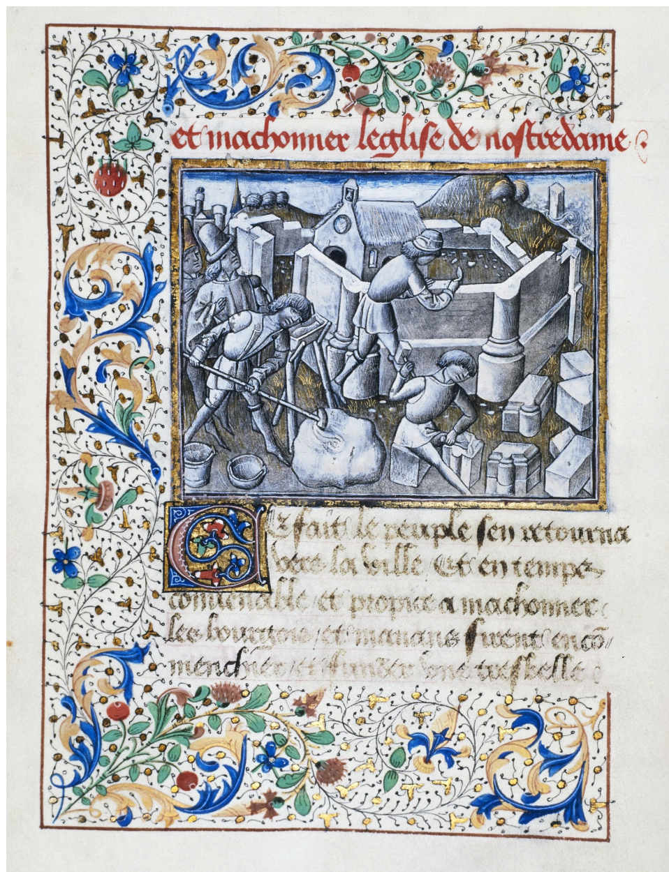
Construction des murs. B. Arsenal, manuscrit.