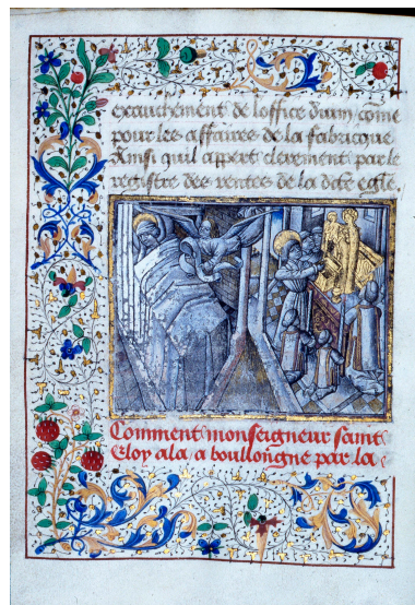
Songe de Saint Eloi. B. Arsenal, manuscrit.