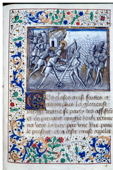
Découverte d'un trésor. B. Arsenal, manuscrit.