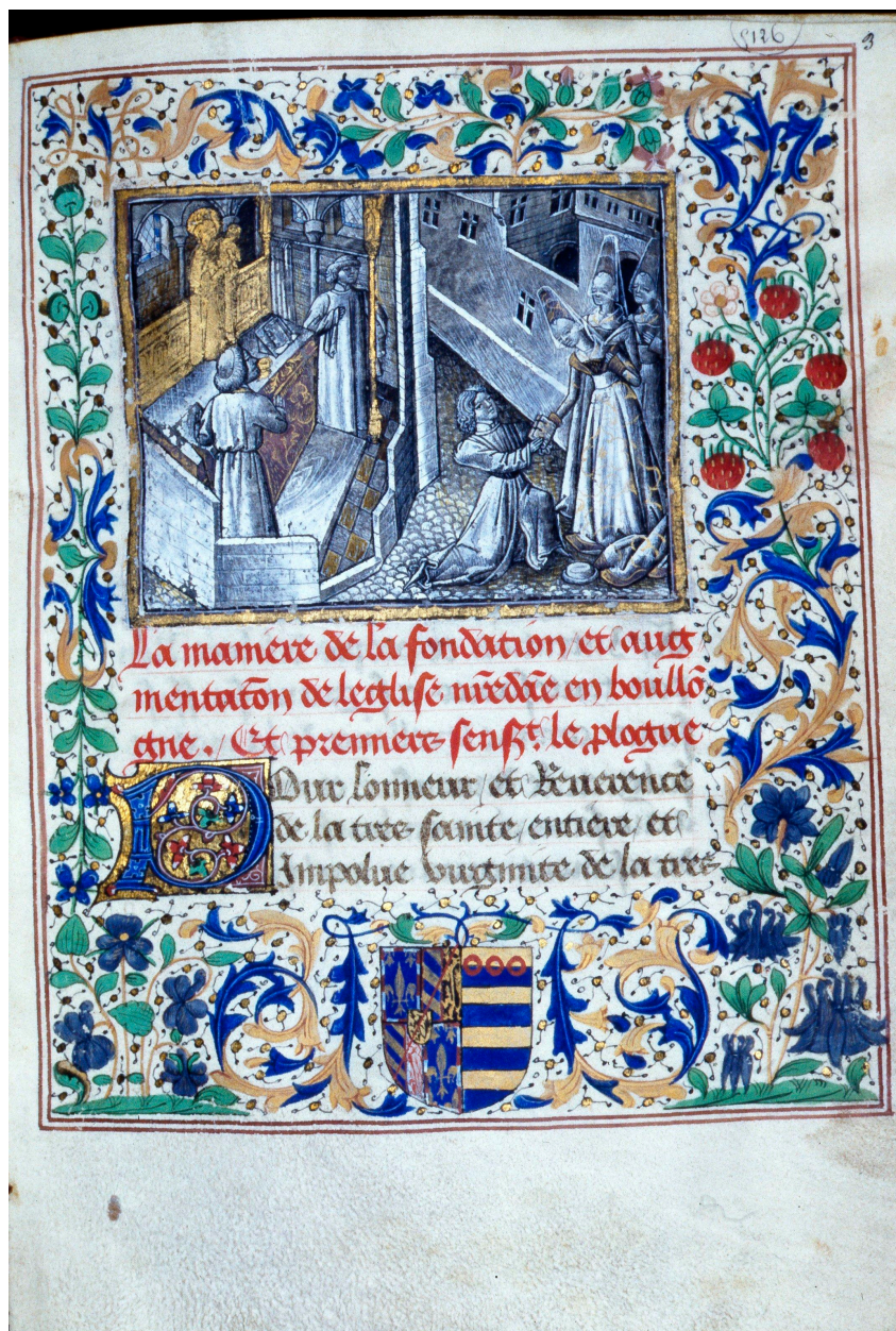
Hommage à Jeanne de la Vieville. B. Arsenal, manuscrit.