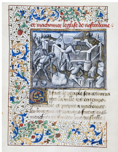
Construction des murs. B. Arsenal, manuscrit.