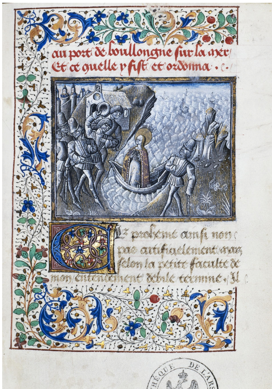
Arrivée de la statue miraculeuse à Boulogne-sur-Mer. B. Arsenal, manuscrit.