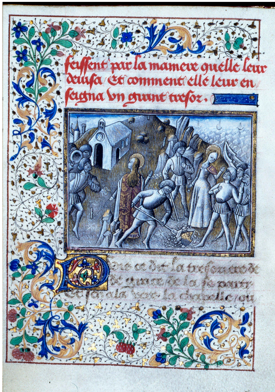
La Vierge apparaît aux Boulonnais pour indiquer l'emplacement de l'église. B. Arsenal, manuscrit.