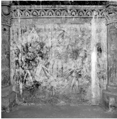
Vue générale d' une peinture : Arrivée de la statue miraculeuse à Boulogne-sur-Mer.

IVR31_19926200156X