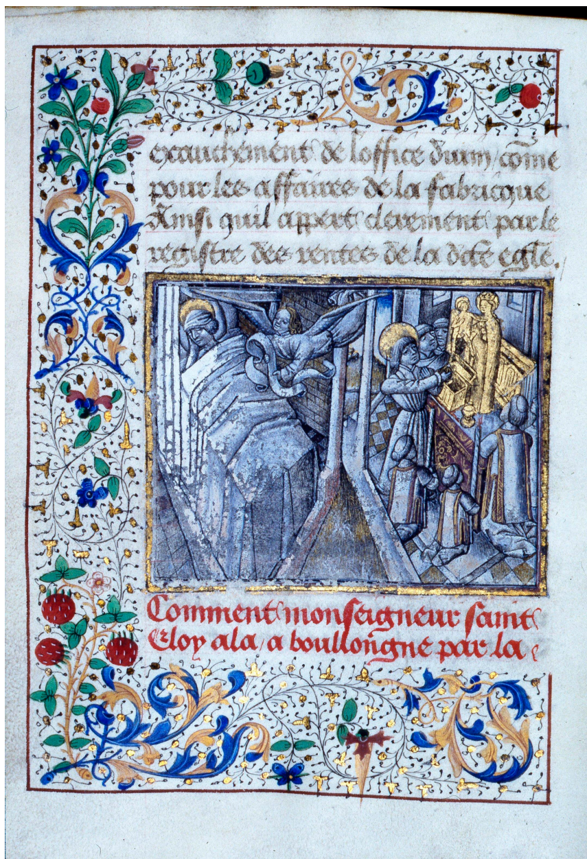
Songe de Saint Eloi. B. Arsenal, manuscrit.