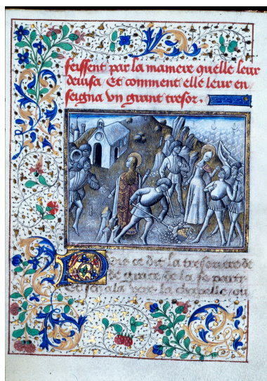
La Vierge apparaît aux Boulognais pour indiquer l'emplacement de l'église. B. Arsenal, manuscrit.