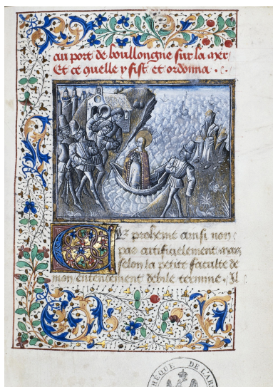
Arrivée de la statue miraculeuse à Boulogne-sur-Mer. B. Arsenal, manuscrit. IVR31_19886200169XA