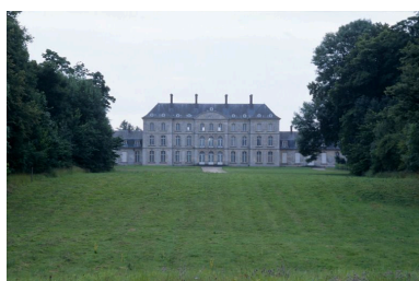
La façade ouest du château. IVR22_19998001592ZA