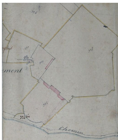
Extrait du cadastre napoléonien (DGI). IVR22_20038010322NUCA