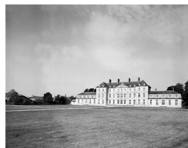
La façade est du château.