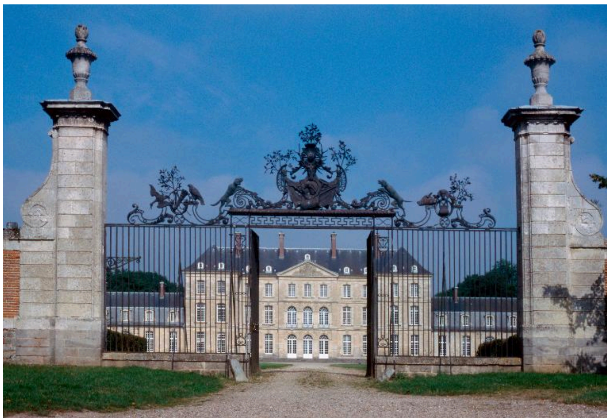
Vue de situation, depuis la vieille route de Villers.