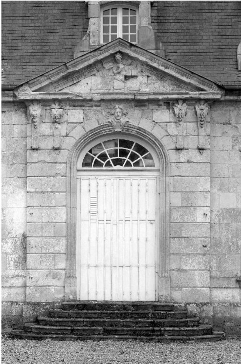
Élévation nord, aile latérale gauche : porte et fronton sculpté (un enfant chevauchant une licorne).