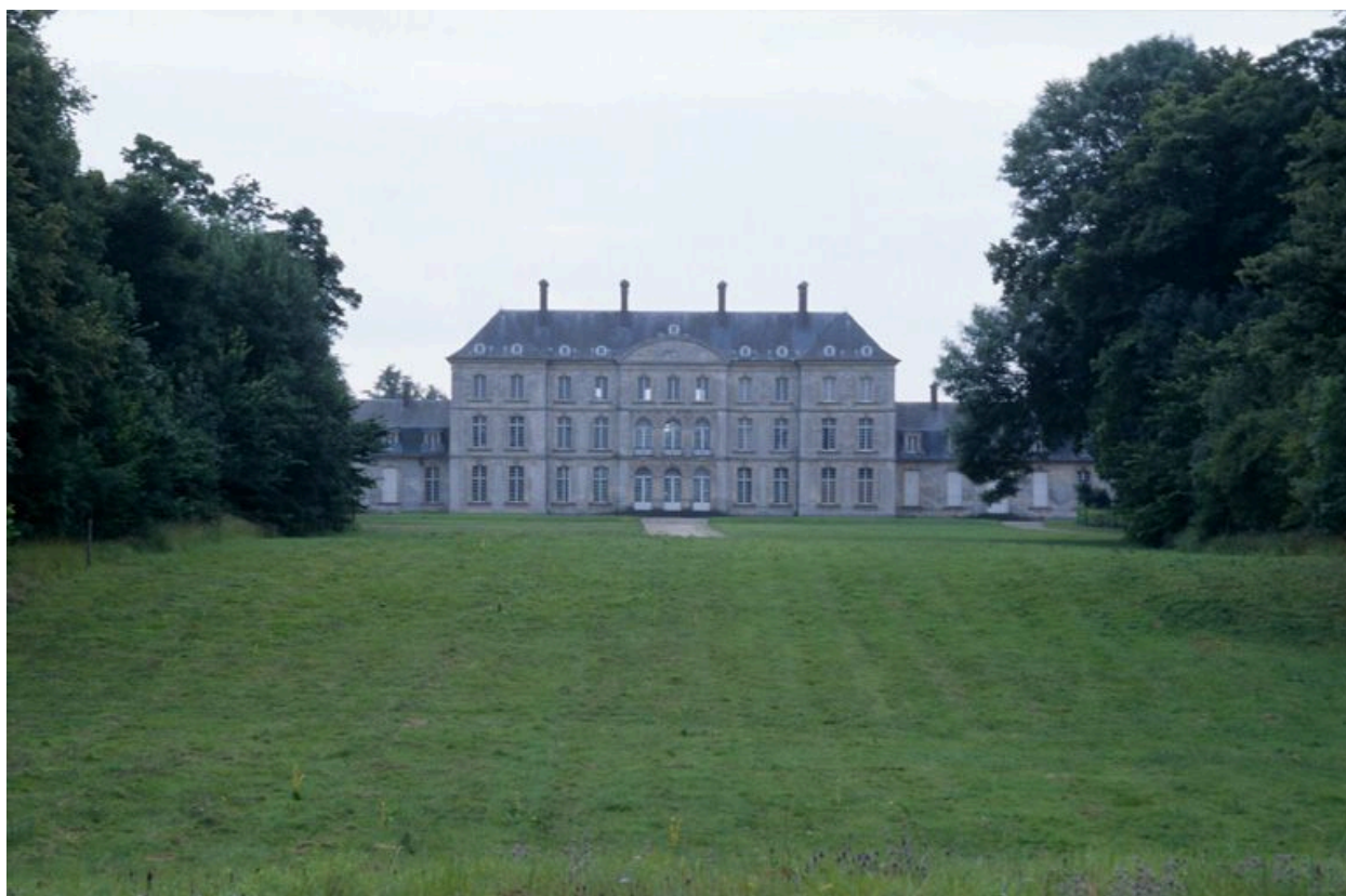
La façade ouest du château.