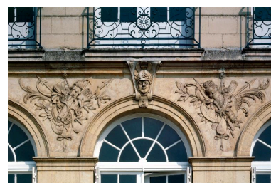
Détail de l'élévation sud : tête d'Athéna et trophées, décor sculpté du rez-de-chaussée. IVR22_19998001763XA