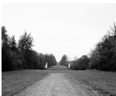
L'allée des Lions, avenue au nord du château.