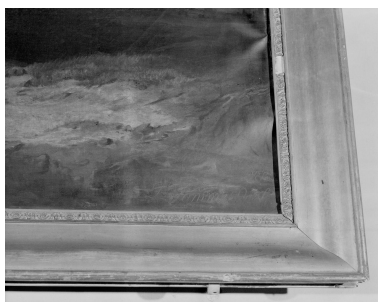
Détail de la signature et de la date.