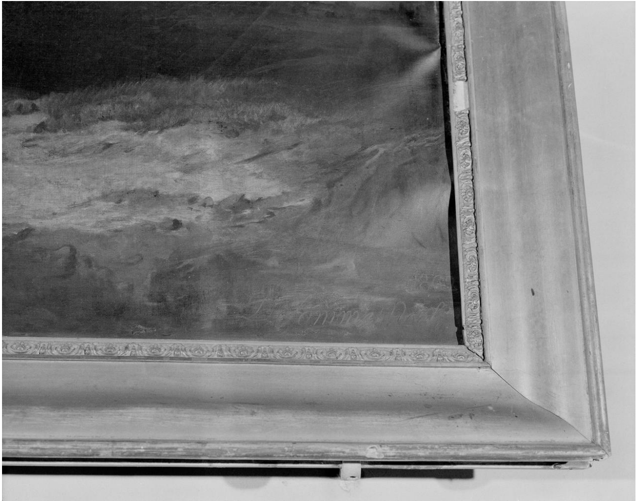
Détail de la signature et de la date.