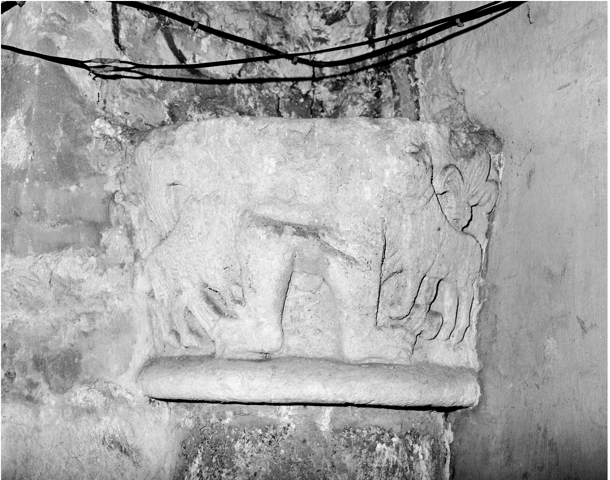
Vue d'ensemble, chapiteau n° 12 du plan de situation.