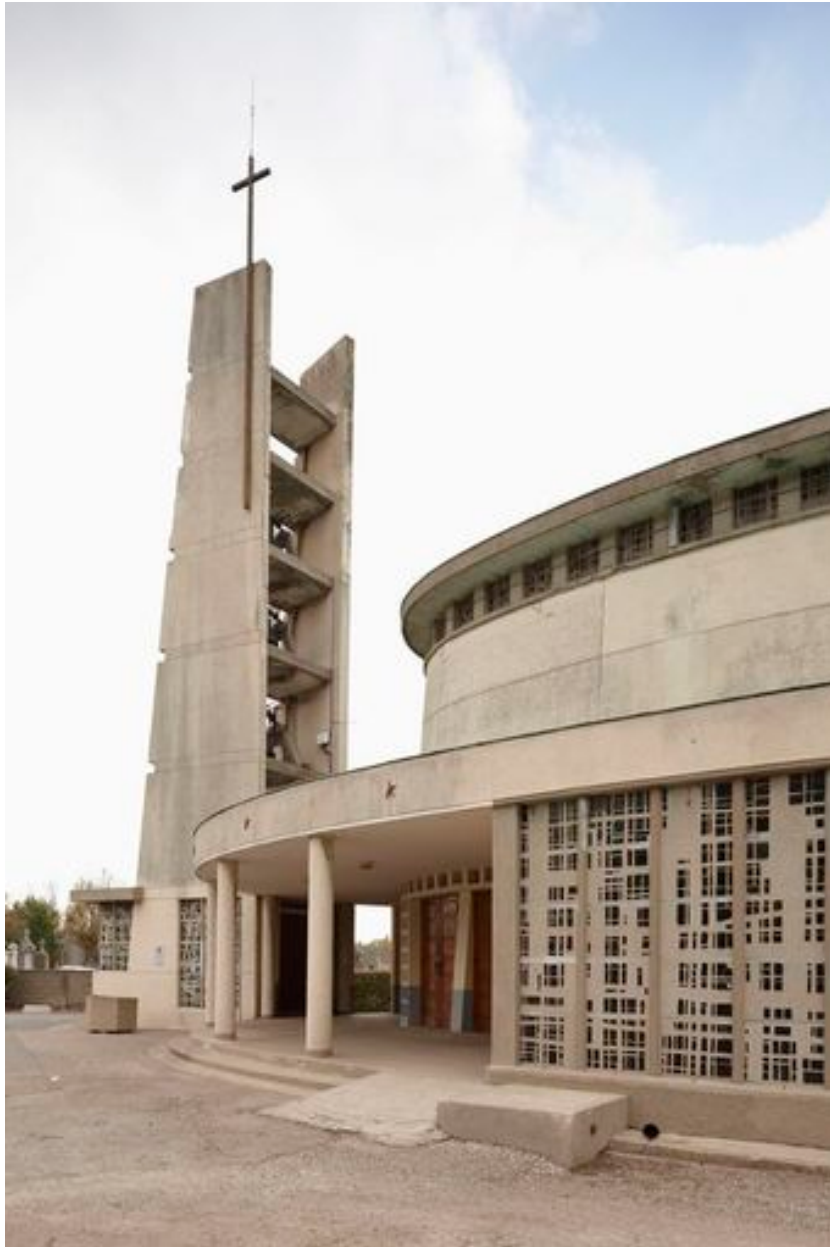
Vue de l'entrée.