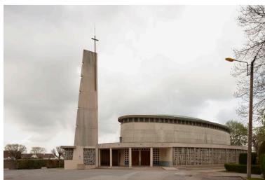
Vue générale. IVR31_20106200719NUCA