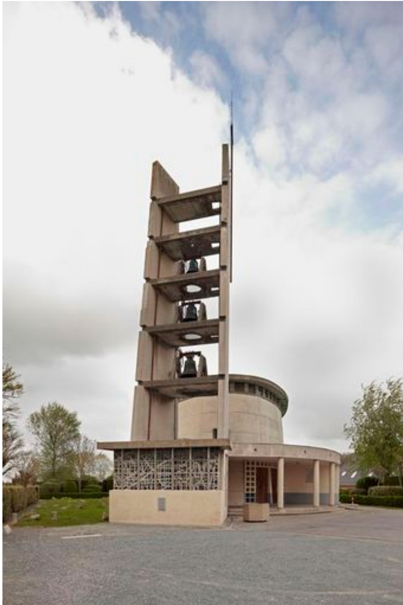
Vue du clocher.