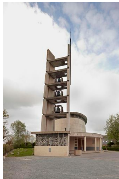
Vue du clocher.