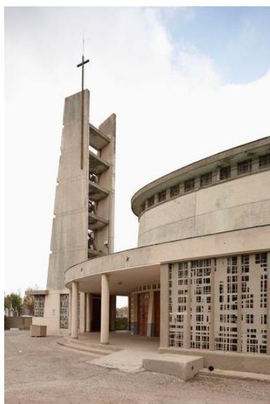
Vue de l'entrée.