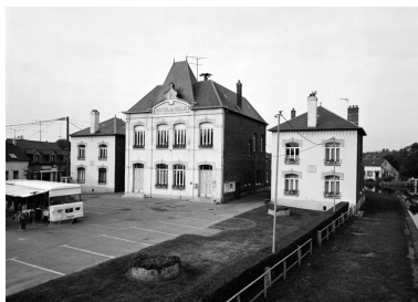
L'hôtel de ville d'Étreux.