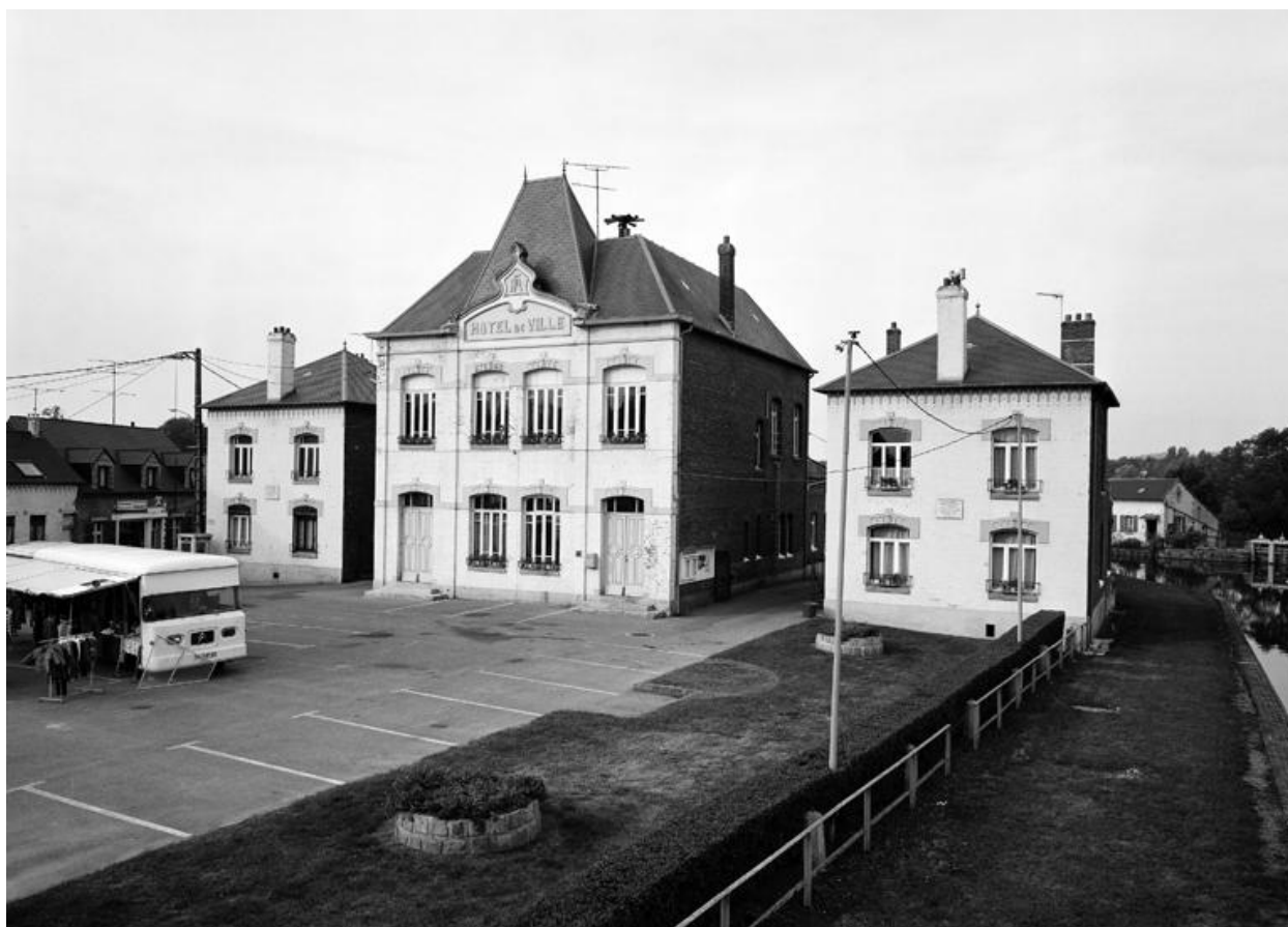
L'hôtel de ville d'Étreux.