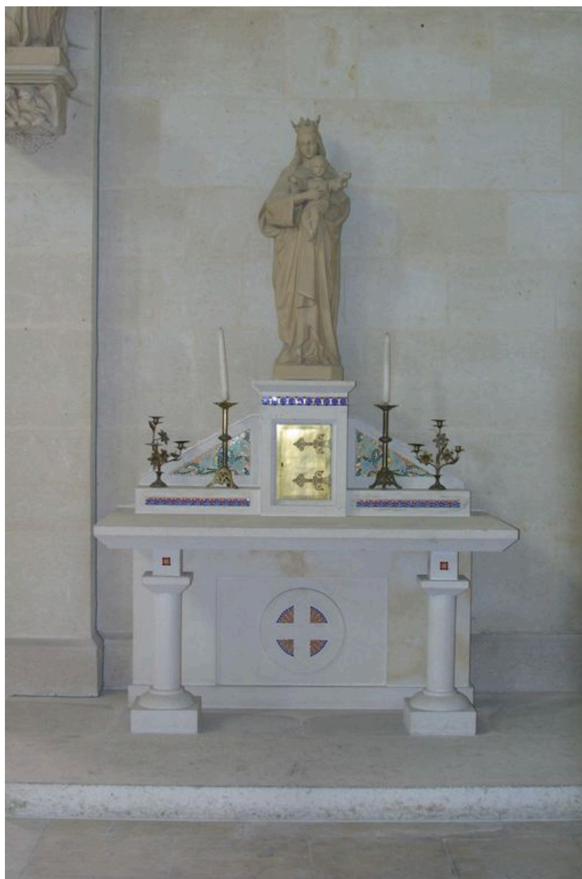
Vue générale de l'autel secondaire sud.