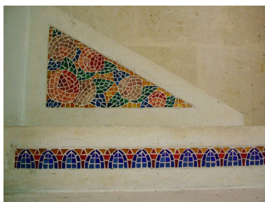
Détail du décor.