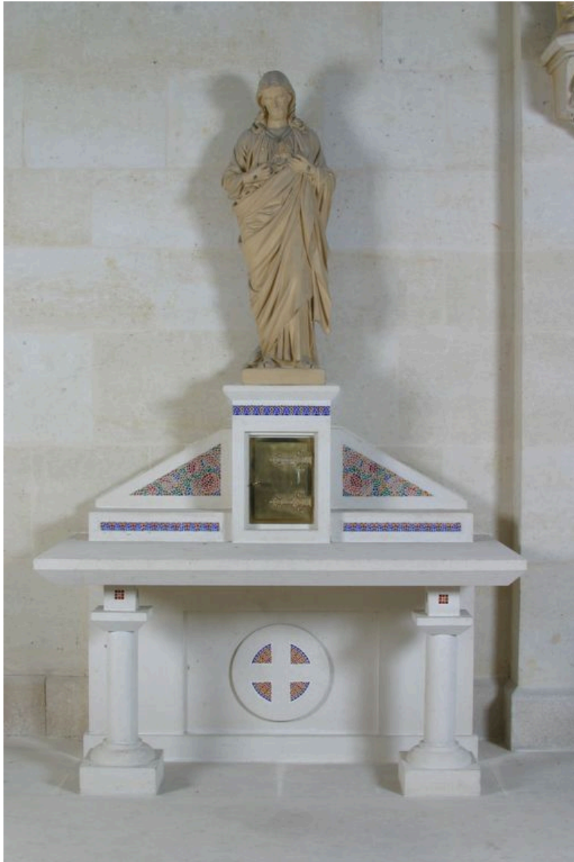
Vue générale de l'autel secondaire nord.