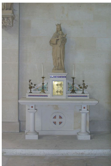
Vue générale de l'autel secondaire sud.