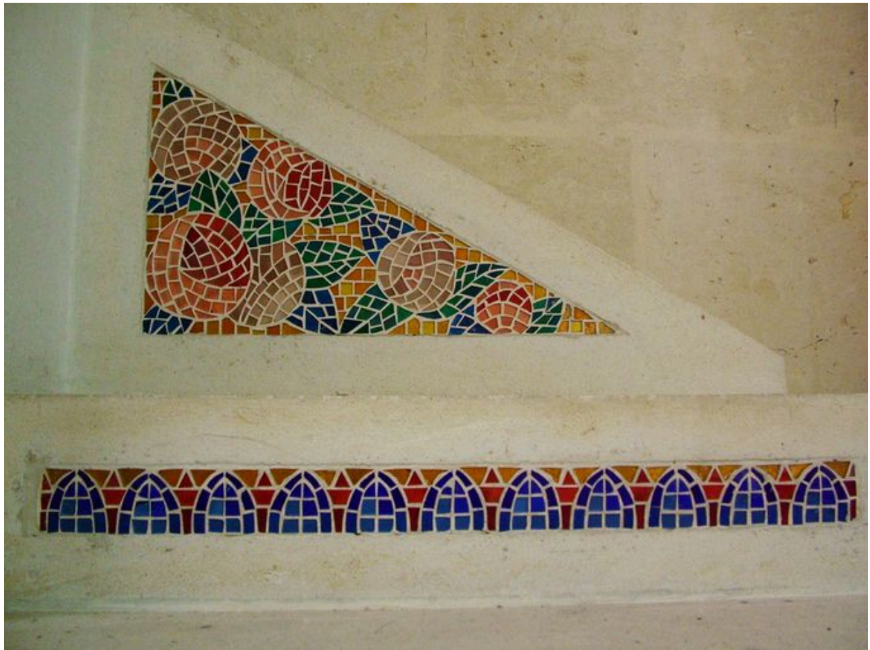
Détail du décor.