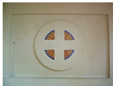
Détail du décor.