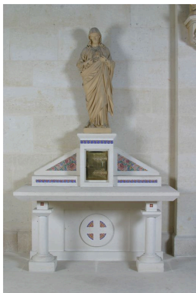
Vue générale de l'autel secondaire nord. IVR22_20030202131NUCA