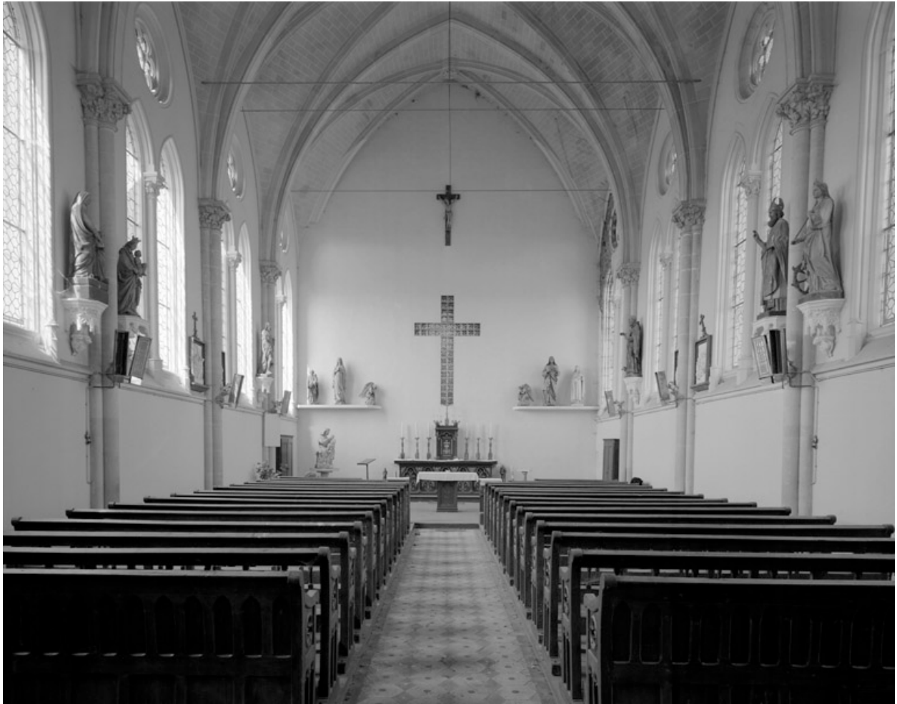
Vue intérieure, vers le chœur.