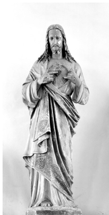
Statue du Sacré-Coeur, maison Calais à Amiens, vers 1880.