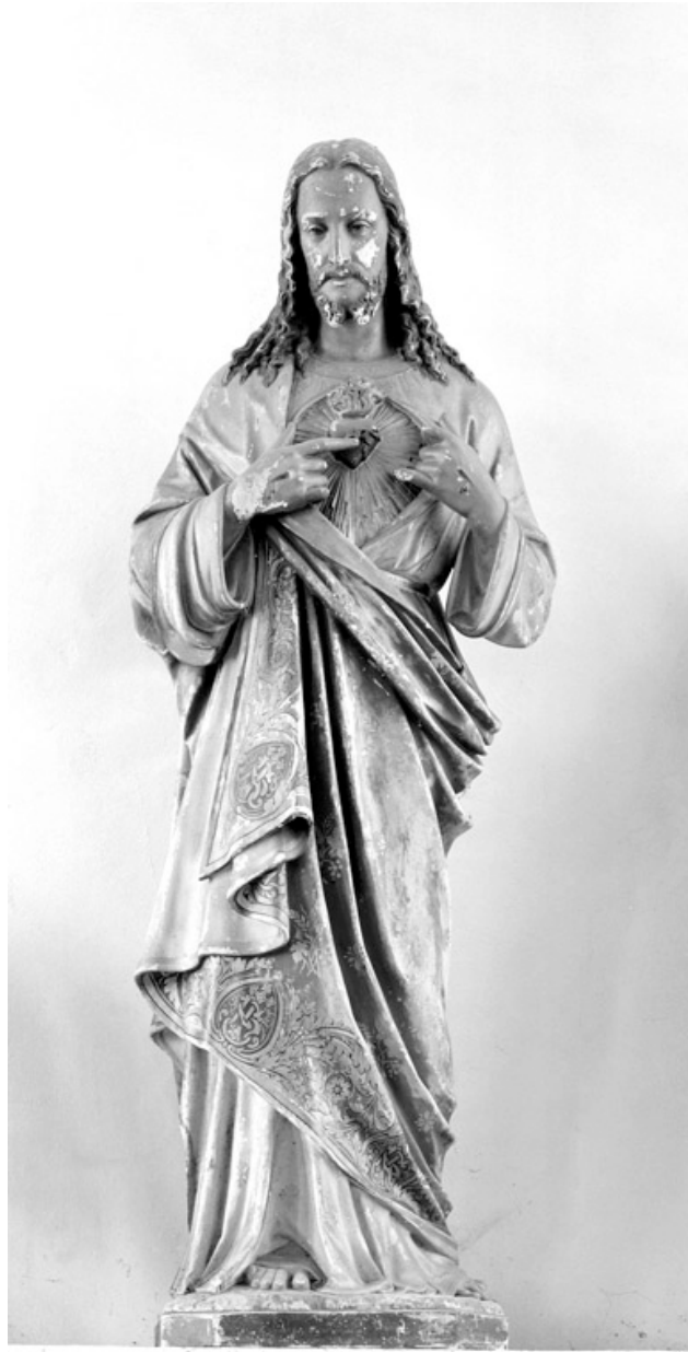
Statue du Sacré-Coeur, maison Calais à Amiens, vers 1880.