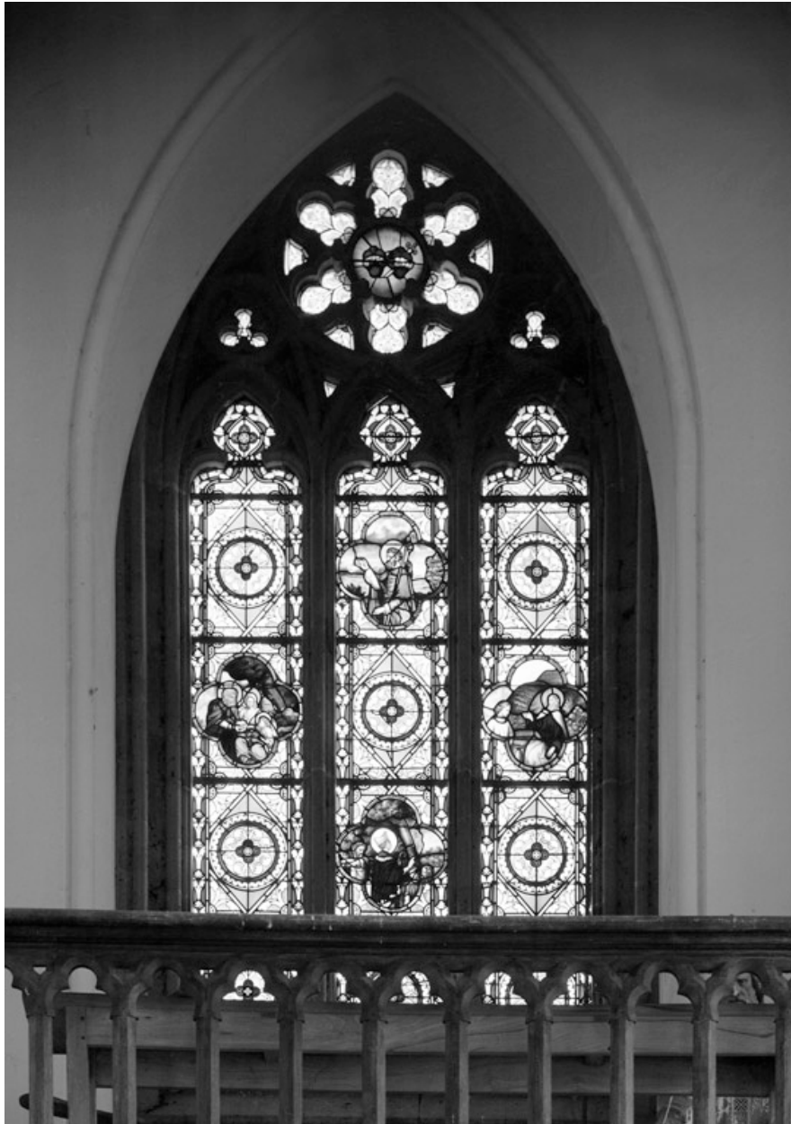
Détail de la verrière de la tribune, par l'atelier Bazin, 1872.