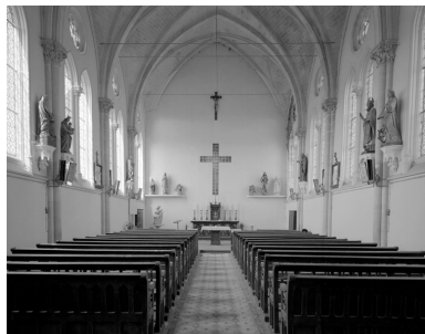
Vue intérieure, vers le chœur. IVR22_19998001485V