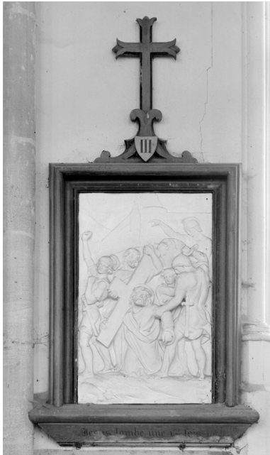
Chemin de croix, maison Fruchart, 1872. IVR22_19998001672X