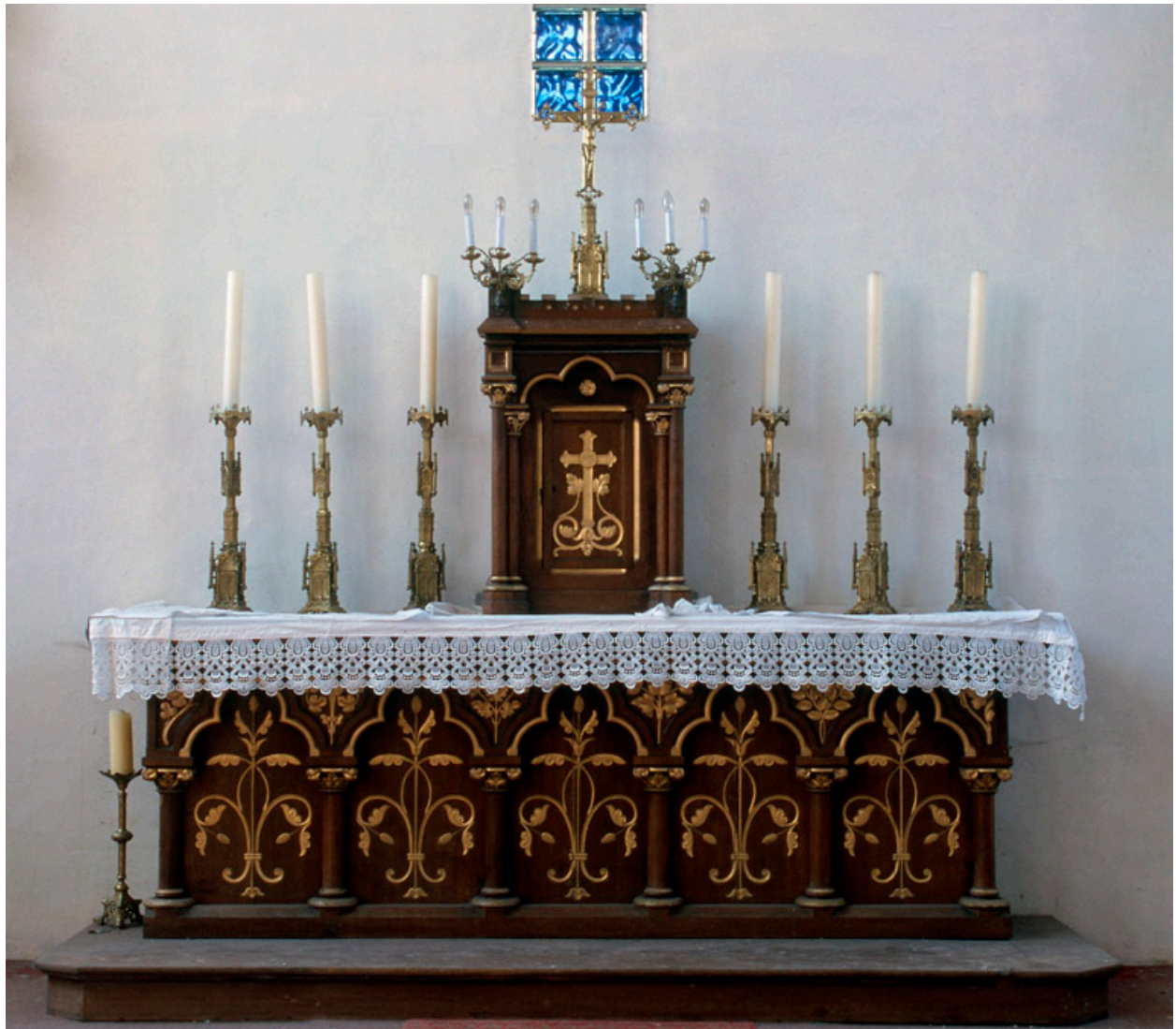
Maître-autel, par Fruchart, 1875.