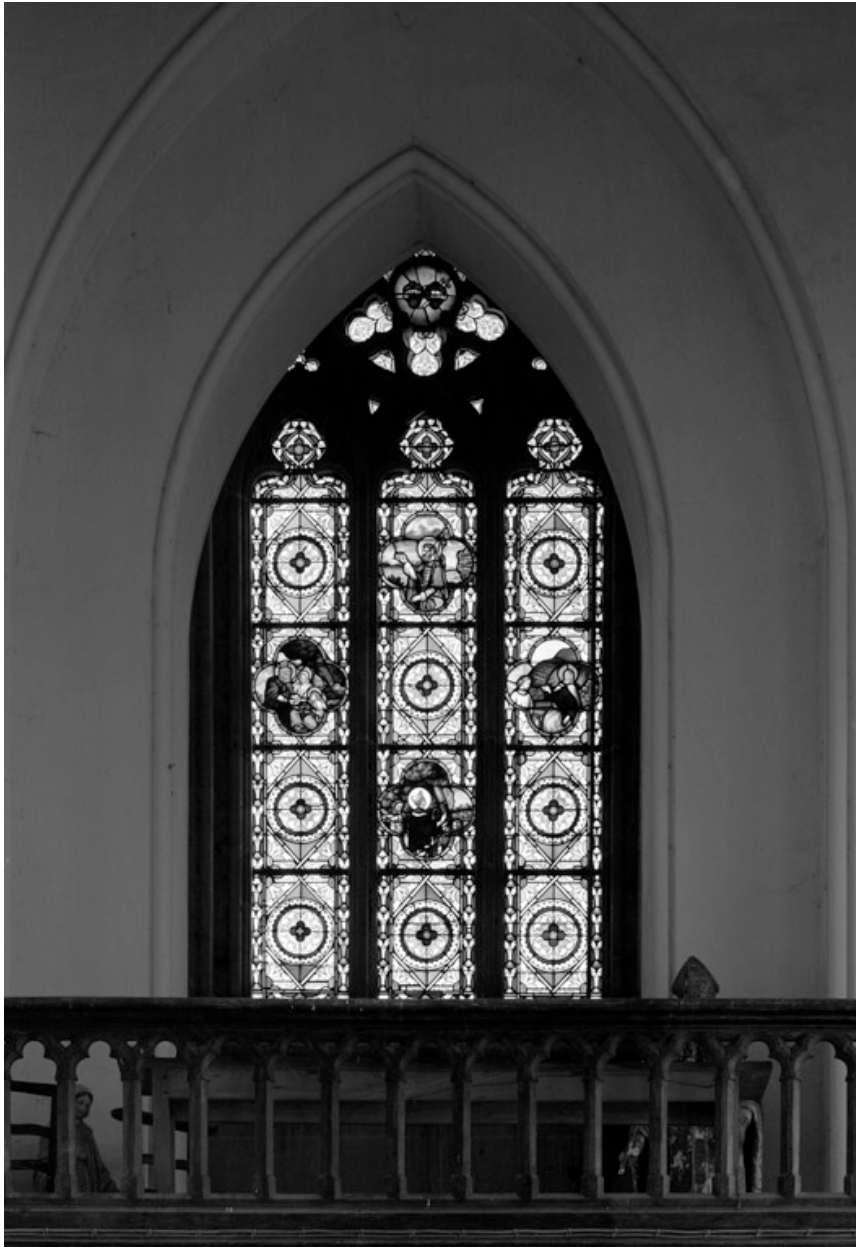
Vue générale de la verrière de la tribune, par l'atelier Bazin, 1872.