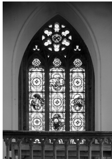
Détail de la verrière de la tribune, par l'atelier Bazin, 1872. IVR22_19998001667X