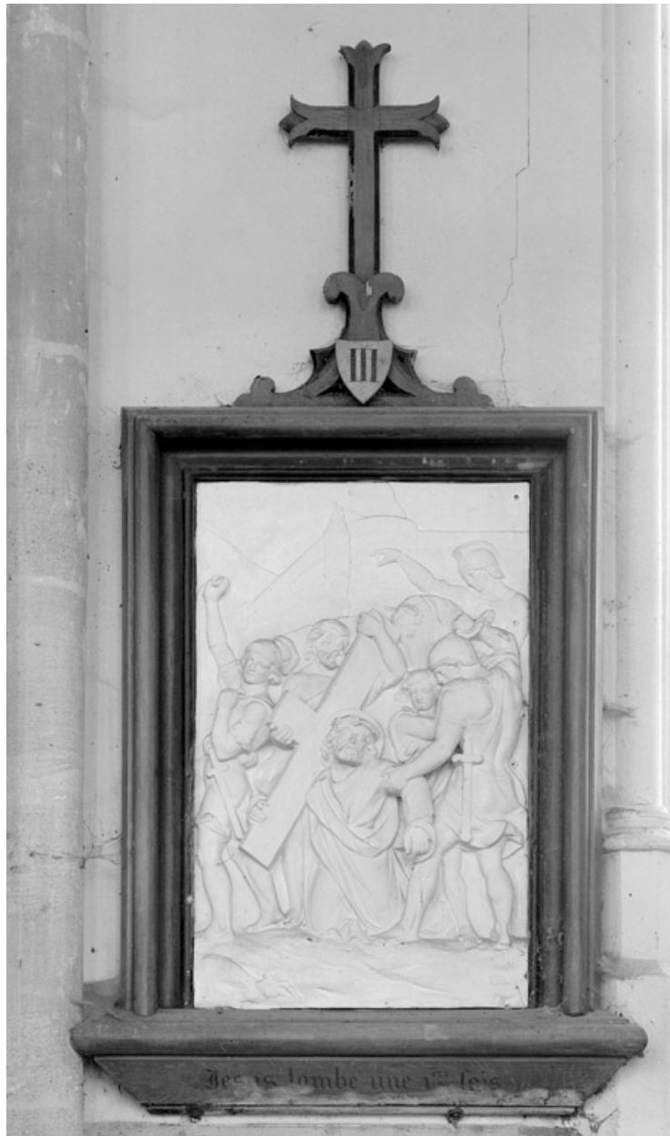
Chemin de croix, maison Fruchart, 1872.