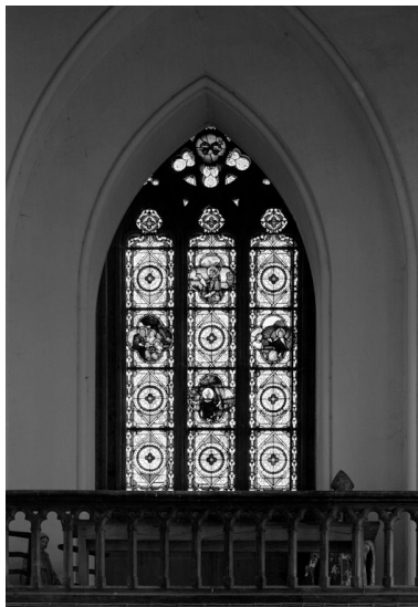
Vue générale de la verrière de la tribune, par l'atelier Bazin, 1872. IVR22_19998001666X