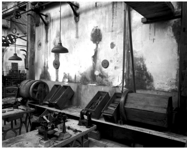
Vue générale des tonneaux de polissage. IVR22_1999600009X