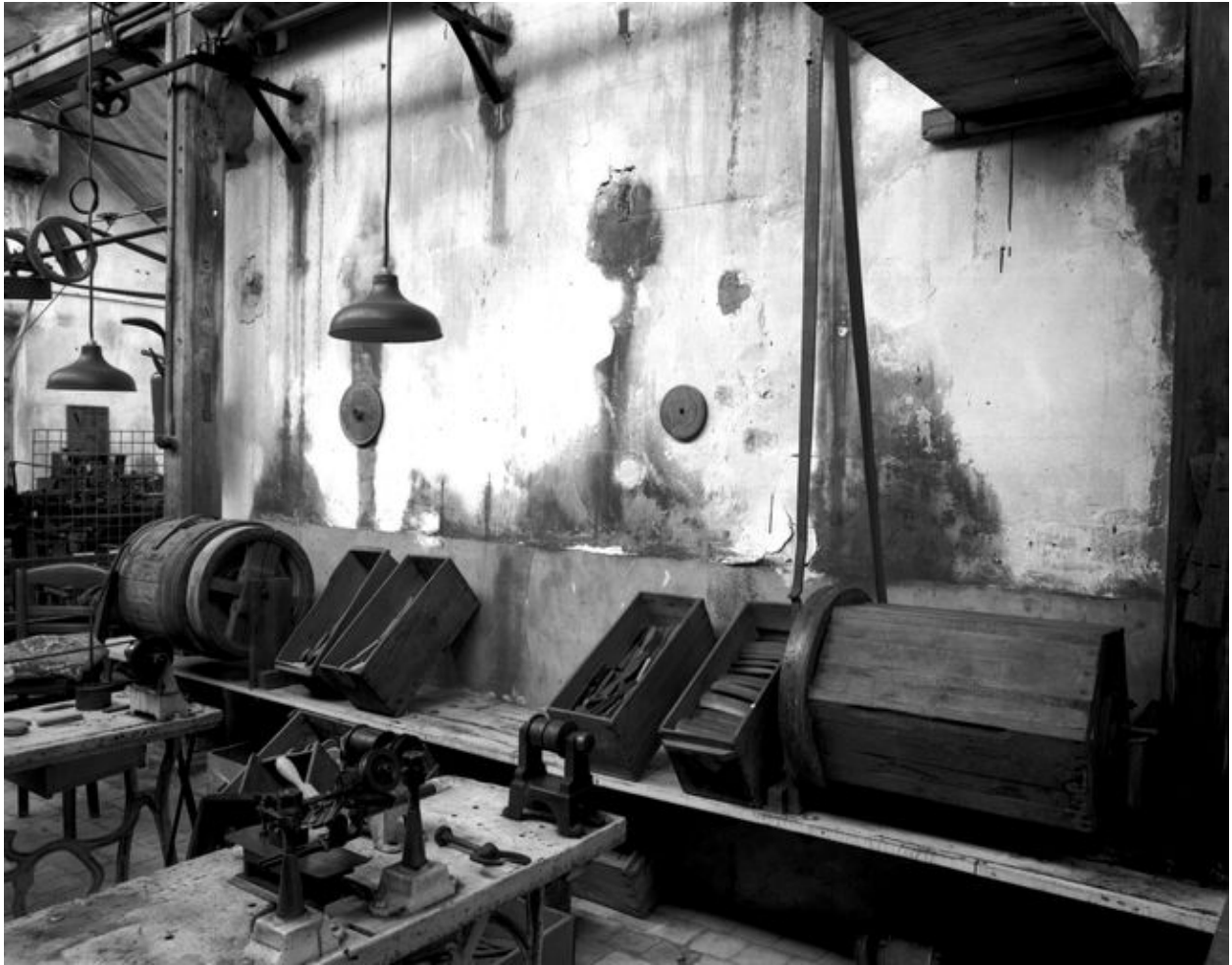
Vue générale des tonneaux de polissage.