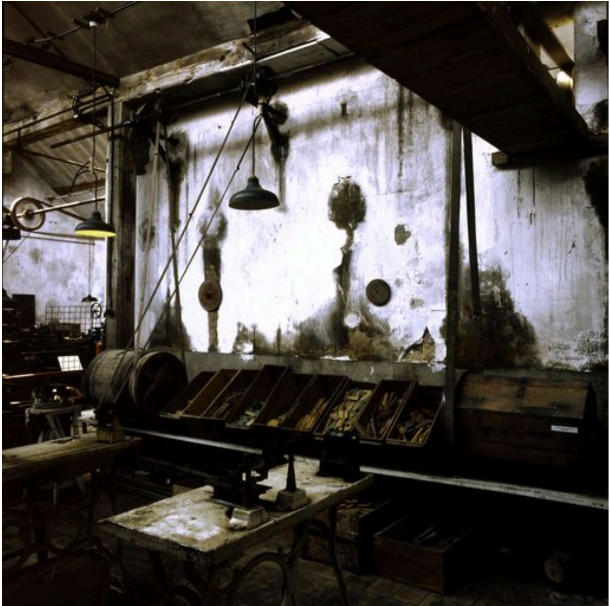
Vue d'ensemble des tonneaux de polissage.